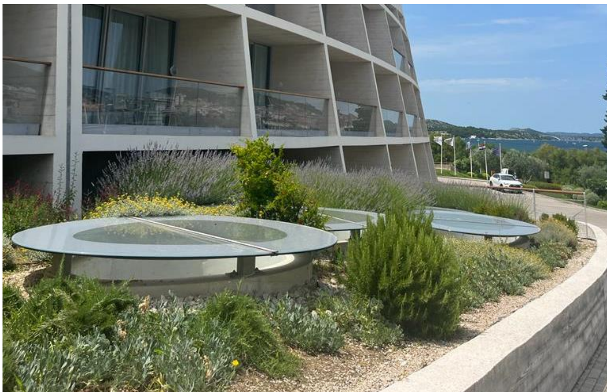
Slika 10. Bočni eksterijer hotela D – Resort Mandalina uređen mirisnim, mediteranskim biljem

Izvor: autorica diplomskog rada, 24. lipnja 2023.