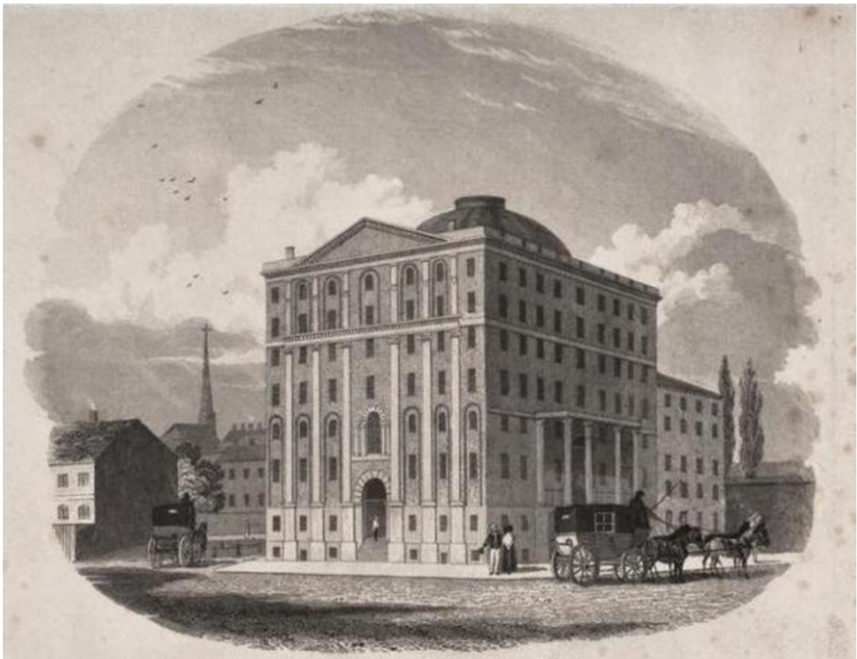
Slika 3. Hotel Exchange Coffee, 1832. godine

Godine 1809. Asher Benjamin projektirao je hotel u Bostonu zvan Exchange Coffee House, imao je samo sedam katova i dvije stotine soba. Tremont House u Bostonu sa stotinu sedamdeset soba i Astor House u New Yorku sa tri stotine i devet soba otvorili su se 1830. – ih, oba projekti Isaiaha Rogersa.