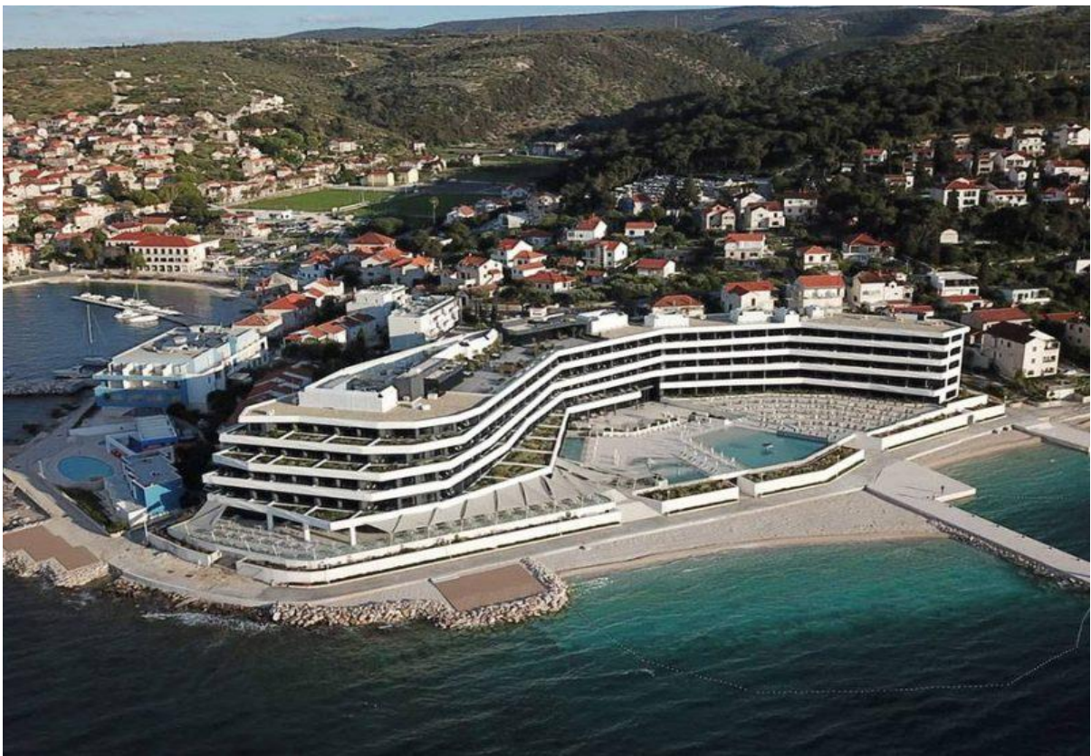
Slika 9.: Grand Hotel View u Postirama na Braču

Oni čak i nisu posebno skupi, i ne samo da ne inkomodiraju hotelski program (uz izuzetak mjerila), nego mu potencijalno mogu donijeti i dodanu vrijednost. Čudi me uskogrudno razmišljanje prilikom investicija u turizam u kojemu mahom izostaje više imaginacije, kako u smislu samog turističkog sadržaja, a tako još i više u smislu pristojnosti prema domaćinskim ambijentima u koje ti sadržaji ulaze.“