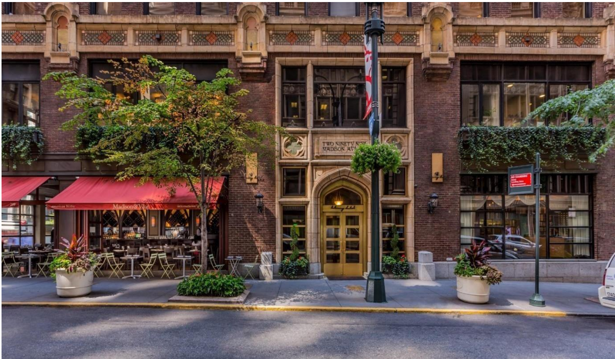
Slika 1. Library Hotel by Library Hotel Collection, New York

Dizajn hotela sastoji se od planiranja dizajna, izrade nacрта, razvoja i redizajniranja hotela. Ideja o projektiranju hotela ukorijenjena je u tradiciji gostoprimstva putnika koja datira iz ranijih vremena. Početak putovanja željeznicom početkom 1900. – ih doveo je do značajnog planiranja, projektiranja i razvoja hotela u blizini željezničkih postaja, koji su bili namijenjeni putnicima željeznicom, logično. Zanimljivost je da su hoteli u blizini Grand Central Terminala u New Yorku najveći primjer ovog fenomena. Jedan od zanimljivijih hotela je Library Hotel by Library Hotel Collection.