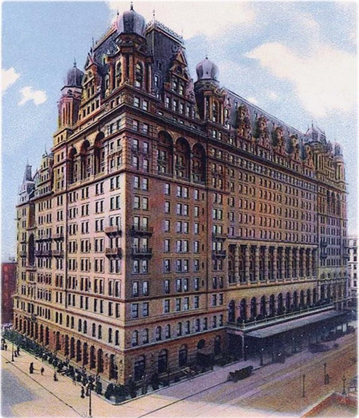
Slika 4.: Hotel Waldorf – Astoria, 1908. godine