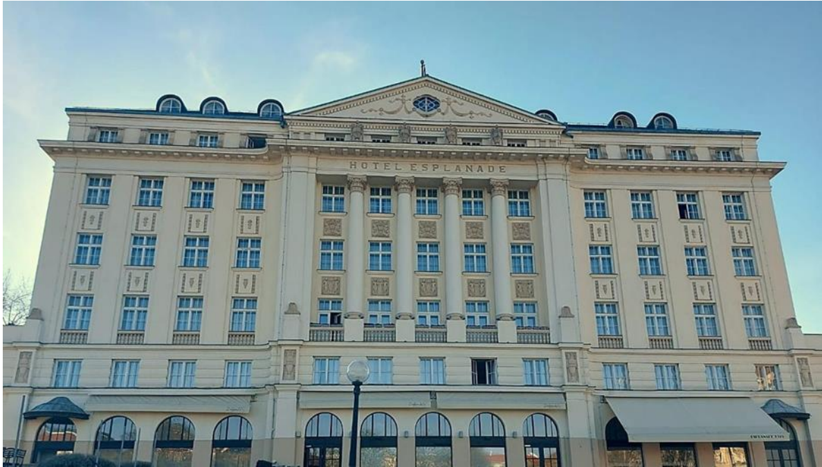
Slika 2. Esplanade Hotel Zagreb

Izvor: autorica diplomskog rada, 22. ožujka 2023.