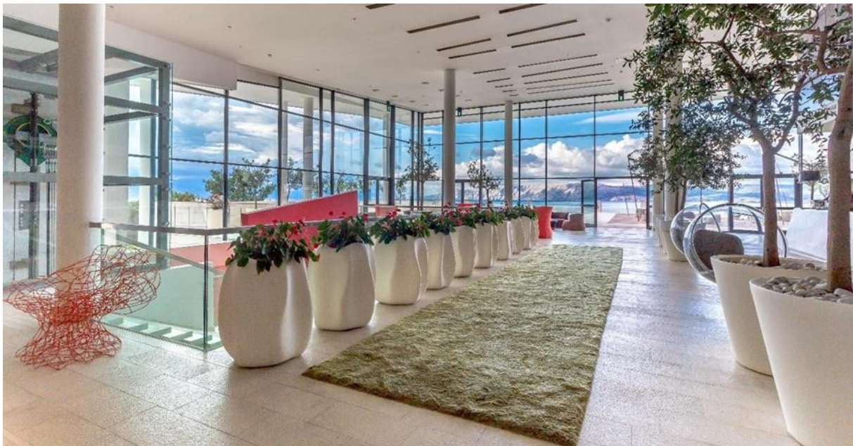
Slika 7. Predimenzionirana unutrašnjost hotela Novi resort u Novom Vinodolskom

Sve masovniji postmoderni turizam mijenja se iz grupnog u individualizirani. Potrebno je zadovoljiti sve više diferenciranih i segmentiranih potreba turista, gostiju i korisnika hotela. Događa se tranzicija turizma iz masovnog u masivniji turizam. Turistička infrastruktura zauzima sve veću površinu. Hoteli također zauzimaju sve više prostora i bez promjene broja soba. Najnoviji primjeri takvog rastrošnog dimenzioniranja, uz iznimno skupu gradnju, u Hrvatskoj su Hotel Novi resort u Novom Vinodolskom te Grand Hotel View u Postirama na Braču. Mnogi su prostori unutar i u okolišu hotela predimenzionirani, bez jasne namjene, u funkciji pasaža i promenada. Investicija u gradnju i u održavanje takvih prostora u uvjetima globalne ekonomske krize ne može se nikako isplatiti te ne ostaje prostora za brze reakcije na promjene zahtjeva tržišta. 32