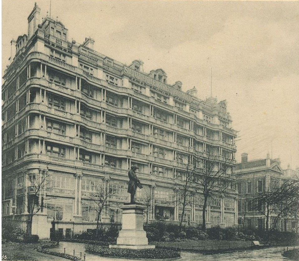
Slika 5.: Hotel Savoy u Londonu

Europa je uhvatila korak sa standardom koji su postavili američki hoteli tek na samom kraju 19. stoljeća i početkom 20. stoljeća. Hotel Savoy u Londonu (1888. – 1889.), Hotel Adlon Kempinski iz 1907. u Berlinu te Hotel Ritz u Parizu iz 1906. godine odgovaraju američkom izazovu.