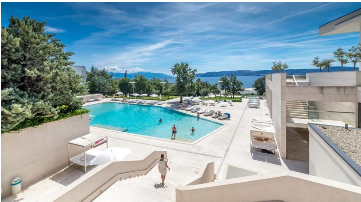
Slika 8. Predimenzionirani eksterijer hotela Novi resort u Novom Vinodolskom