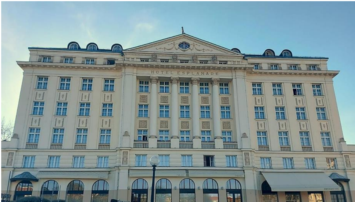
Slika 2. Esplanade Hotel Zagreb

Izvor: autorica diplomskog rada, 22. ožujka 2023.