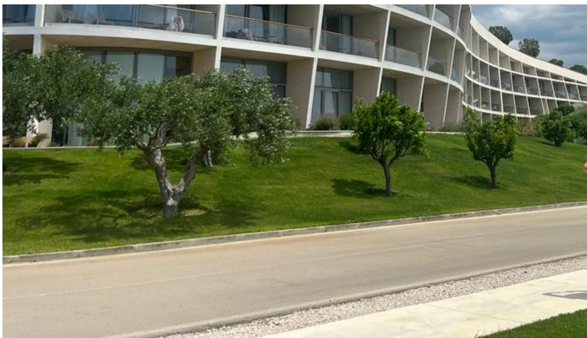
Slika 11. Prednji eksterijer hotela D – Resort Mandalina uređen maslinama i citrusima

Izvor: autorica diplomskog rada, 24. lipnja 2023.