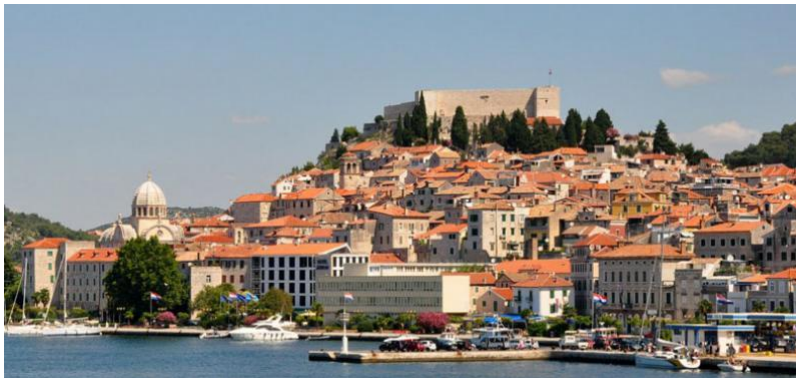
Slika 1. Šibenik

Izvor: http://mok.hr/ , 24. kolovoza 2016.