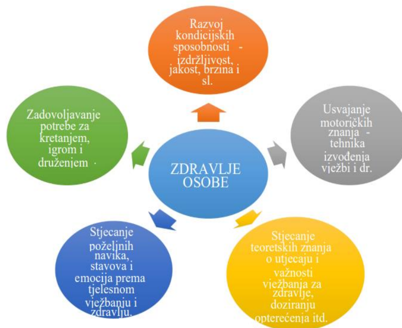
Slika 1. Struktura ciljeva koji se nastoji postići primjenom tjelesnog vježbanja (Pejčić i Trajkovski, 2018)

Prema Bungić i Barić (2009), postavljeni su ciljevi koji doprinose održavanju zdravlja osobe. To uključuje zadovoljavanje potreba za kretanjem, druženjem i igrom, razvoj kondicijskih sposobnosti poput izdržljivosti, jakosti i brzine, usvajanje motoričkih znanja o pravilnom izvođenju vježbi te stjecanje teoretskih znanja o utjecaju i važnosti vježbanja za zdravlje.