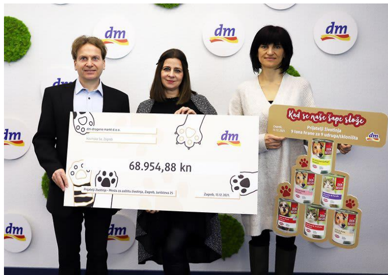
Slika 14: Donacija za napuštene životinje