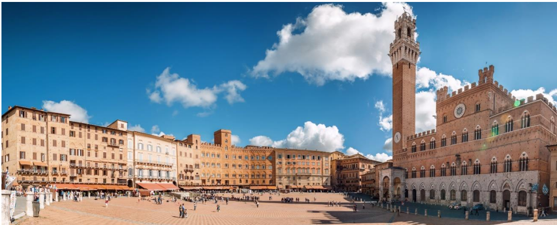
Slika 4: Piazza del Campo