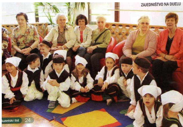
Slika 4. Korisnice Programa pomoći u kući i Dnevnog boravka donijele djeci narodne nošnje