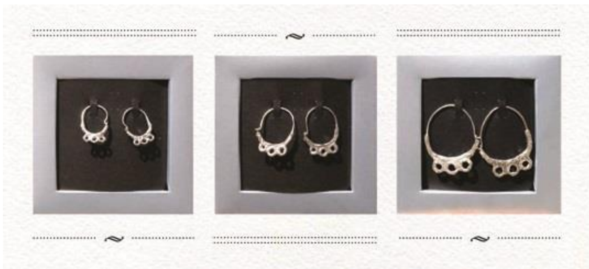
Slika 1. Autohtoni buzetski suvenir - Buzetska naušnica

Buzetske naušnice . Naime, počele su se izrađivati replike srebrnih nosivih naušnica u tri veličine (male, srednje, velike). Danas se Buzetska naušnica prodaje kao novi buzetski suvenir te je odlično prihvaćena od domaćeg stanovništva, ali i stranaca koji ju kupuju kao uspomenu na posjet malom istarskom gradu Buzetu. (Grah Ciliga, 2011: 303-306)