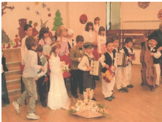
Slika 13. Scenska igra Svatovi po starinski