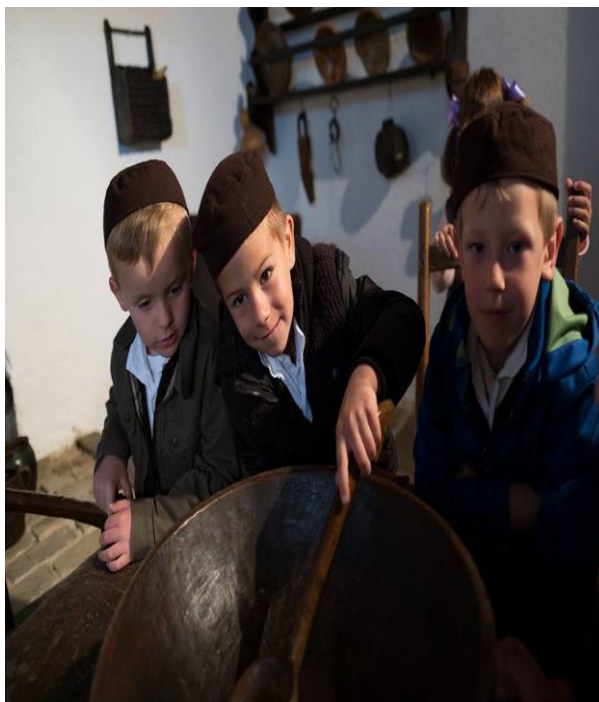
Slika 11. Upoznavanje sa starinskim posuđem

Izvor: Arhiva Dječjeg vrtića „Grdelin“, fotografirano 20. svibnja 2016.