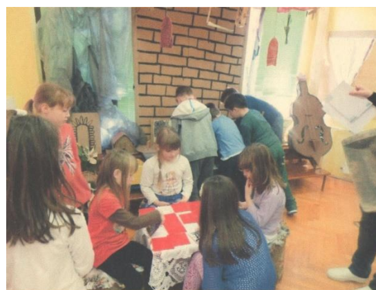
Slika 14. Centar kulturne baštine

Izvor: Arhiva Dječjeg vrtića „Grdelin“, fotografirano u studenome 2013.