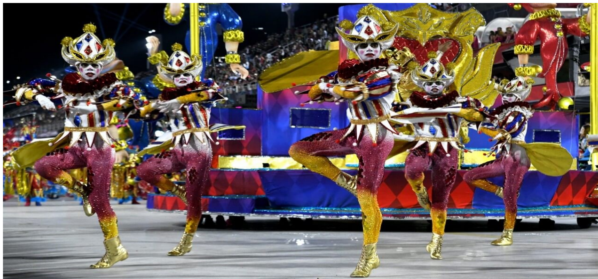
Slika 6. Ručno rađeni kostimi plesne skupine