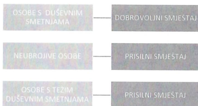
Slika 1: Prikaz kategorija OSTDS-a i njihovog smještaja u psihijatrijsku ustanovu/odjel