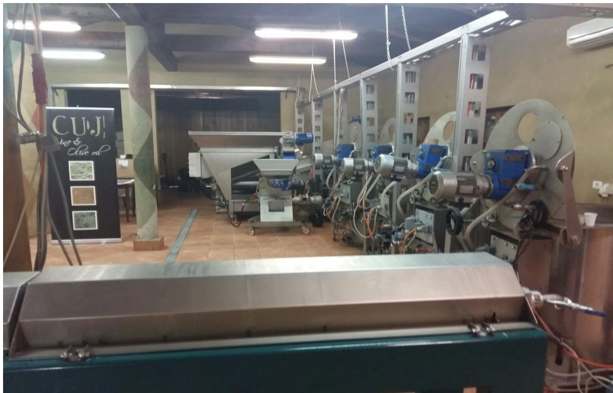
Slika 3. Pogon uljare Cuj

Za sada se njima ne obračunavaju dodatni troškovi, no ukoliko broj zainteresiranih bude opadao, bit će primorani naplaćivati dodatni trošak ili čak prekinuti ekološku proizvodnju. 41