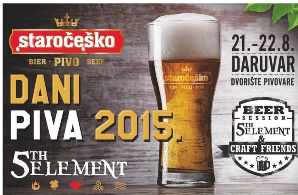
Slika 4. Članak iz Večernjeg lista