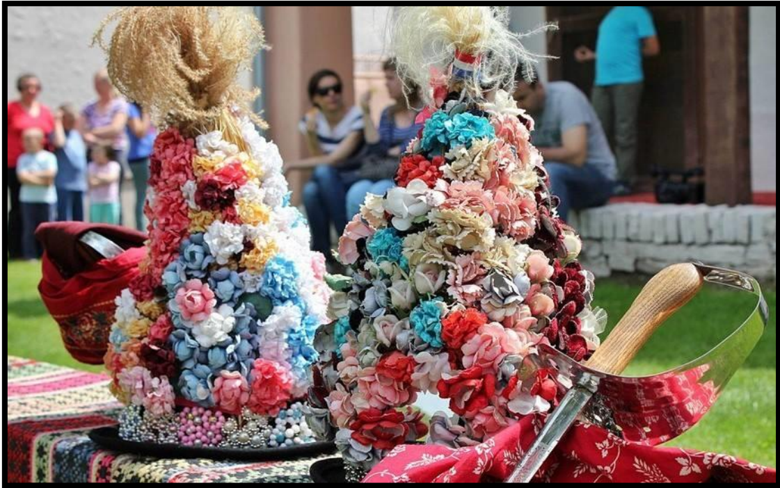
Slika 2. Ljeljin šešir