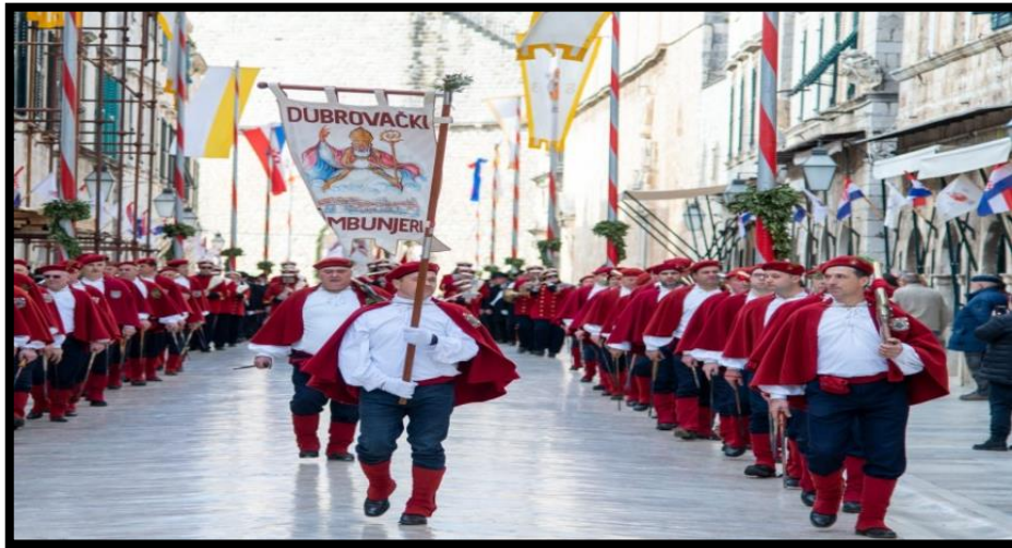
Slika 6. Festa sv. Vlaha

spominjanja svetaca zaštitnika jadranskih i talijanskih gradova, a samim tim su izbacili i dio višestoljetne povijesne zbilje Dubrovnika na koju je tekst i ukazivao. 37