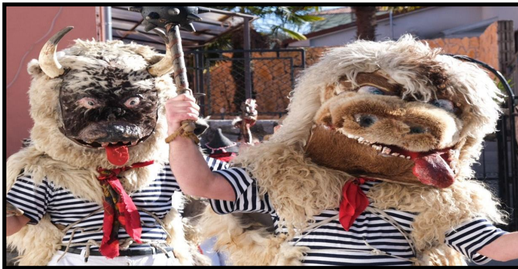
Slika 8. Halubajski zvončari

sela, već iz čitavog područja Viškova i dijelom Grada Kastva. Jedini gradski zvončari jesu zametski zvončari koji su svoju odjeću radili po uzoru na halubajske zvončare, ali im se na glavi ispod ovčje kože nalazi šljem i imaju drugačije kretanje. Grobnički dondolaši isto tako okupljaju muškarce s područja dviju općina i karakterizira ih crna odjeća i kosturska lubanja koju nose kao masku. 52