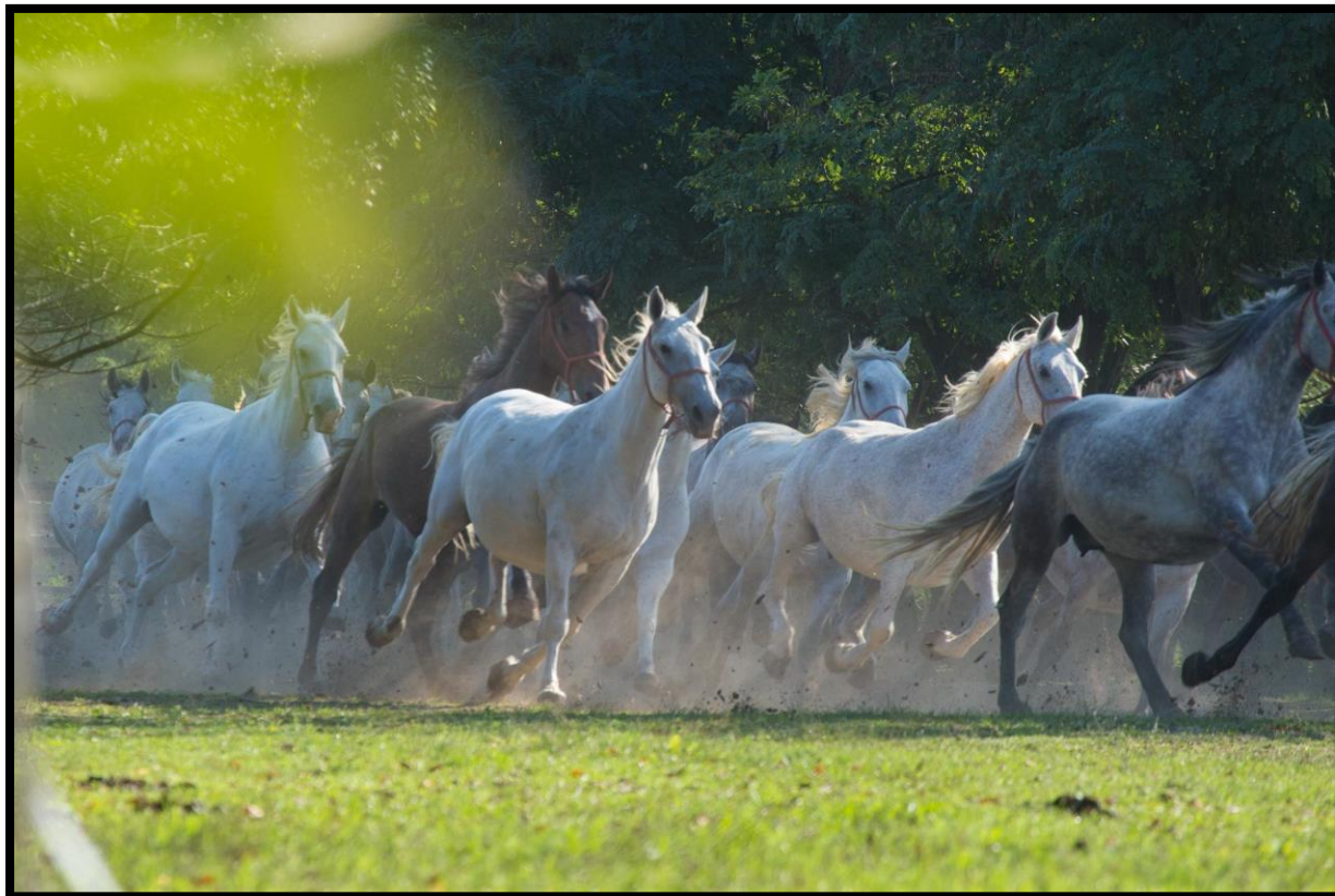
Slika 12. Lipicanci

Od osam priznatih linija lipicanaca, Hrvatska ih uzgoja 7, izuzevši mađarsku liniju. Međunarodno su priznata i 63 lipicanska roda, od kojih je hrvatskih 16. Ostale linije koje su priznate osim tulipana i mađarskog incitato, su danski pluto, napuljski conversano i neapolitano, kladrupski favory i maestoso te arapski siglavy. 98