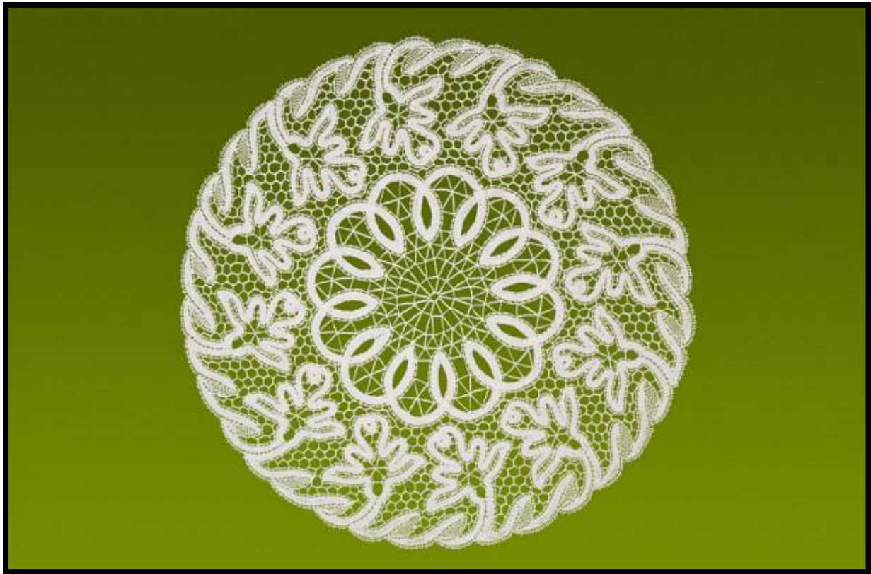
Slika 4. Lepoglavska čipka