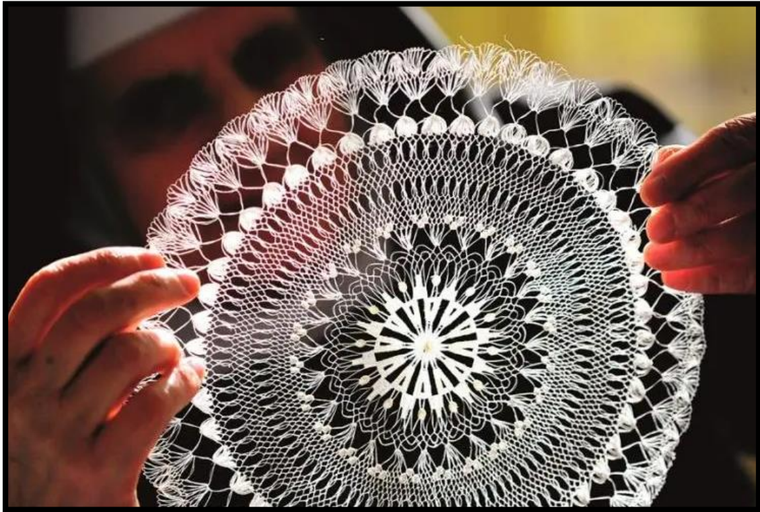
Slika 5. Hvarska čipka

potrebna posebna igla za tkanje mreže. Budući da se u benediktinskom samostanu nalazi vrlo malo sestara, obvezatno uče svaku pridošlu sestru tehnikama izrade hvarske čipke od aloe. Ova vrsta očuvanja umijeća izrade čipke od aloe zapravo je vrlo riskantna jer postoji mogućnost da se tradicija izgubi. Osim benediktinskog samostana, ulogu u očuvanju izrade ove čipke imalo je i otvaranje čipkarske škole 1907. Na pad proizvodnje čipkarstva u Hrvatskoj uvelike je utjecala industrijalizacija, urbanizacija te ratovi. Sada su lepoglavska, hvarska i paška čipka popularan suvenir koji predstavlja hrvatsku kulturu. 30