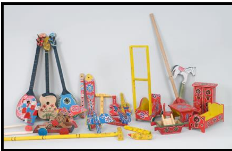
Slika 7. Tradicijske dječje drvene igračke s područja Hrvatskog zagorja

Muzeji igraju veliku ulogu u očuvanju i promidžbi ovog zanata i vrsti igračaka pa se tako pokušavaju održavati i radionice i demonstracije izrade drvenih dječjih igračaka koje vode proizvođači tih igračaka. Održavaju se i sajmovi pa je tako poznat Sajam zagorskog suvenira, na kojem se predstavljaju ručno izrađene drvene igračke. Sela koja su se bavila izradom drvenih dječjih igračaka, od kojih se neka i dalje bave, jesu Laz Bistrički, Laz Stubički, Gornja Stubica, Tugonica, Turnišće, Marija Bistrica, Globočec, Jerovec, Dubravec i Vidovec. 46