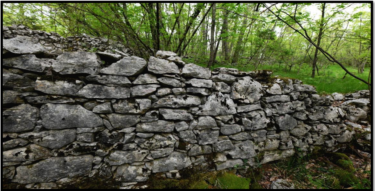
Slika 10. Suhozidna gradnja

Materijal za suhozidnu gradnju se najprije prikupljao i onda slagao u izvornom obliku kako je i pronađen. Na taj način su izgrađena i mnoga suhozida skloništa u poljima, kako bi se radnici mogli sakriti od žege ili nevremena, a služili su i kao spremišta za alate i slično. Razlika između dalmatinskih suhozidnih skloništa i istarskih kažuna je zapravo u krovu. U istarskim kažunima se čak moglo živjeti. Primjer najstarije potvrđene suhozidne gradnje je star otprilike 3500 godina. Radi se o predilirskim i ilirskim utvrdama i grobnim humcima. 87