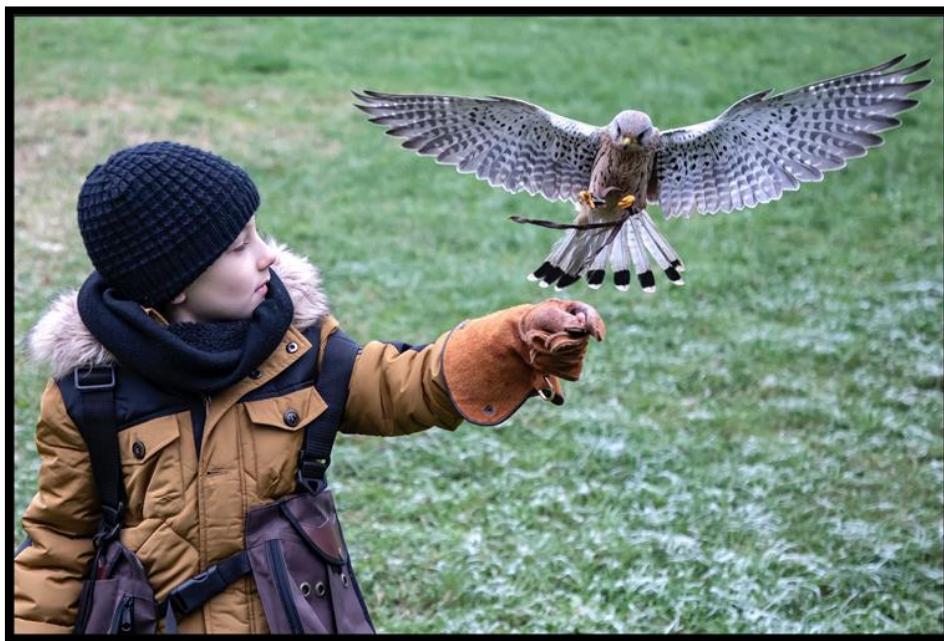
Slika 11. Umijeće sokolarenja

Prema Pravilniku o načinu lova s pticama grabljivicama Ministarstva poljoprivrede, šumarstva i vodnoga gospodarstva, propisuju se načini lova i Program o polaganju sokolarskog ispita. Tako prema članku 2. tog Pravilnika piše kako ispitu mogu pristupiti samo punoljetne osobe s položenim lovačkim ispitom te se sokolarski ispit polaže pred povjerenstvom. Sokolar može tijekom čitave godine trenirati sokolarske ptice, ali u lovištu koje je određeno za to, uz pisano odobrenje te ptica može biti jedino iz umjetnog uzgoja. 91