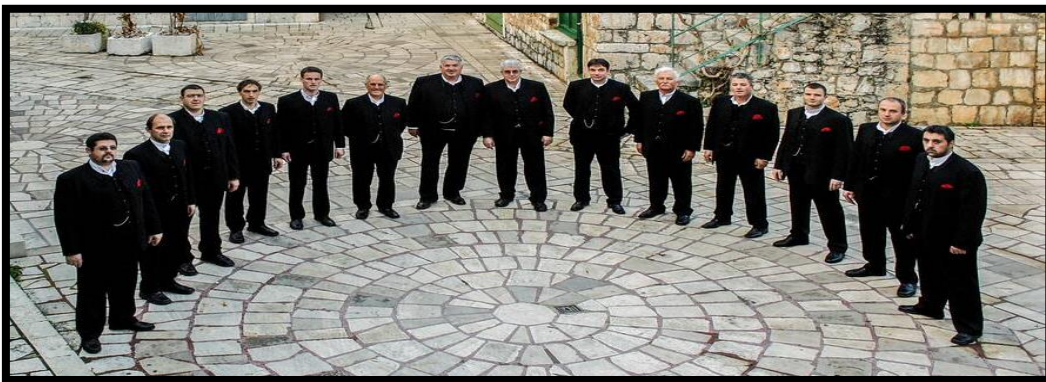
Slika 9. Klapsko pjevanje

Klape i klapske pjesme se neprestano mijenjaju ovisno o geografskim i psihološkim značajkama pojedinog područja. Pjevači klape sudjeluju u oblikovanju pojedine glazbene kulture mikro ili makroregije i nacionalnog glazbenog identiteta. Prisutna je i uvijek će biti sklonost klapa i klapskog pjevanja k promjenama i prilagođavanju trenutnog stanja, iako se samim time udaljava od starijeg klapskog izričaja. 74