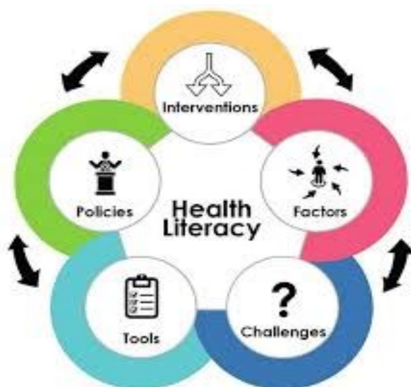
Slika 2. Povezanost i utjecaj određenih čimbenika na zdravstvenu pismenost 2

Zdravstvena pismenost (Slika 2.) se u budućnosti može poboljšati postavljanjem ciljeva i razvojem strategija u Nacionalnim akcijskim planovima, organiziranjem rasprava u zajednicama o zdravstvenoj pismenosti s ciljem praćenja i prihvaćanja primjera dobre prakse i njihovih dostignuća, aktivnim djelovanjem poduzeća, edukatora, čelnika zajednica, vladinih agencija, pružatelja zdravstvenih usluga, medija te drugih organizacija i pojedinaca koji imaju važne uloge u društvu (CDC 2023). Osim navedenog, smatra se da će se u budućnosti obrazovanjem steći viša razina zdravstvene pismenosti koja je važna zbog utjecaja na unaprjeđenje zdravstvene pravednosti u zdravlju ljudi. Zhamantayev i suradnici (2023) objašnjavaju u svojem istraživanju povezanost između zdravstvenog odgoja i ekološkog, političkog i društvenog ponašanja koji utječu na zdravlje.