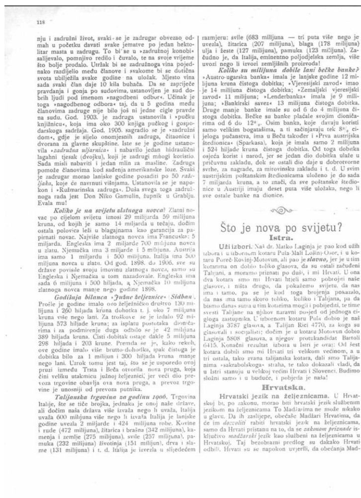
Sl. 3. Pučki prijatelj, broj 32, str. 128.

Laginja je pao kod užih izbora i u izbornom kotaru Pula-Mali Lošinj-Osor, i u kotaru Poreč-Rovinj-Motovun, ali pao je slavno, jer je u tim kotarima on dobio toliko glasova, da su ostali začuđeni Talijani, a moramo priznati po duši, i mi Hrvati. 37 Članak završava statistikom izbora i pozivom za očuvanje jedinstva: „U izbornom kotaru Pula dobio je naš Laginja 3787 glasova, a Talijan Rici 4770. Konačni rezultat izbora u Istri je ovaj: Od šest kotara dobili smo mi Hrvati tri velikom većinom, a u tri ostala, tako zvana talijanska kotara, dali smo Talijanima „sakrabskoga“ straha, te tako dokazali vladi, da u Istri stanuju u velikoj većini Hrvati i Slovenci. Budimo složni samo i u buduće, i pobjeda je naša!“