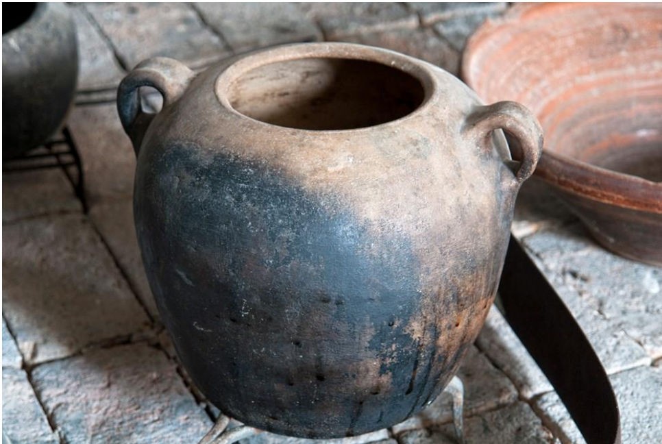
Slika 5. Rakljanski lonac

Velik broj brončanodobnih posuda pronađen je na mnogim nalazištima i lokalitetima koje pokazuju da je proizvodnja zemljanih posuda postojala i u antičko doba. Također i srednjovjekovni nalazi potvrđuju da je proizvodnja zemljanih posuda bila dobro razvijena. Zemljani su se lonci u povijesti koristili svakodnevno, pri spremanju hrane na ognjištima, ali uvođenjem štednjaka i masovne uporabe emajliranog i drugog suvremenog posuđa glineni su se lonci postupno istisnuli.