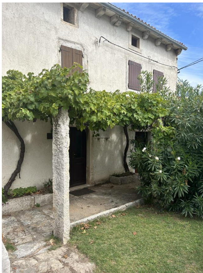
Slika 6. Rodna kuća Mije Mirkovića u Raklju; vlastita fotografija, 2023.

Posjet muzeju je dozvoljen samo uz prethodnu najavu lokalnoj turističkoj zajednici. Većinom dolaze velike grupe učenika i studenata, kao i razne udruge umirovljenika iz Istre, ali i šire.