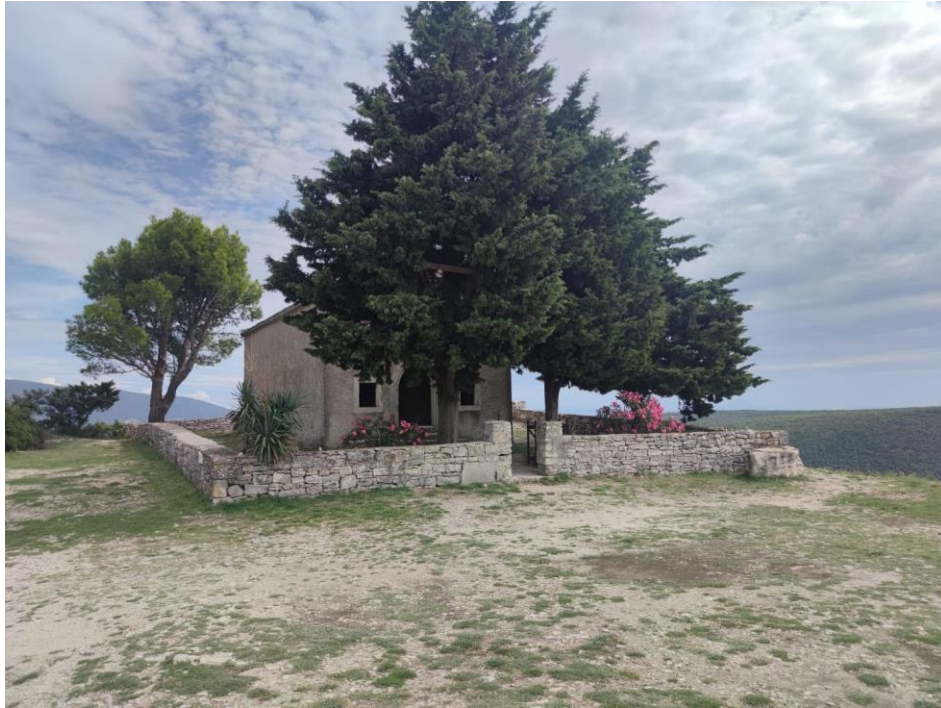
Slika 3. Crkva svete Agneze; vlastita fotografija, 2023.

Danas se nedjeljne svete mise više ne održavaju u crkvi sv. Agneze, već u župnoj crkvi Rođenja Blažene Djevice Marije. Njezina pozicija je danas postala sve više popularna za vjenčanja, festivale, priredbe i ostale razne manifestacije. Dugi niz godina je Turistička zajednica Općine Marčana organizirala koncerte pod nazivom Rakljsko kulturno ljeto, na kojima su sudjelovali poznati hrvatski glazbenici, uključujući Gibonnija, Olivera Dragojevića, Jacquesa Houdeka, kao i svjetski poznatog violončelista Stjepana Hausera.