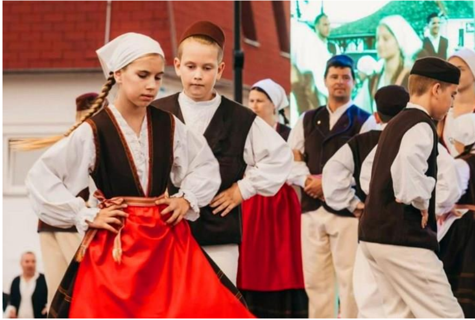
Slika 9. Manifestacija "Rakalj u srcu"