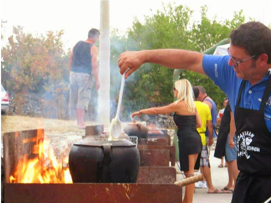
Slika 7. Gastro manifestacija "U Rakljansken loncu"