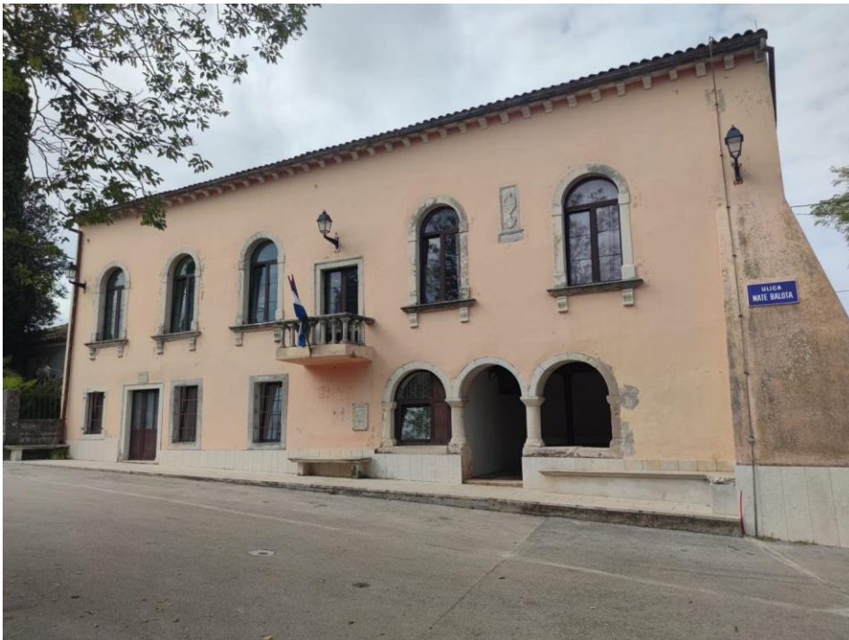
Slika 2. Palača Loredan u Raklju; vlastita fotografija, 2023.

Tako su u Barbanu i Raklju sagrađene dvije palače Loredan koje su pripadale istoimenoj venecijanskoj plemićkoj obitelji i to sve do propasti Venecije 1797. godine. Reprezentativna je građevina u Raklju sagrađena kao trokatnica te danas se koristi u svrhu školstva, odnosno područna je škola Osnovne škole Vladimira Nazora u Krnici za 1. i 2. razred. Nalazi se u samom centru Raklja i do danas je zadržala svoj prvobitni izgled.