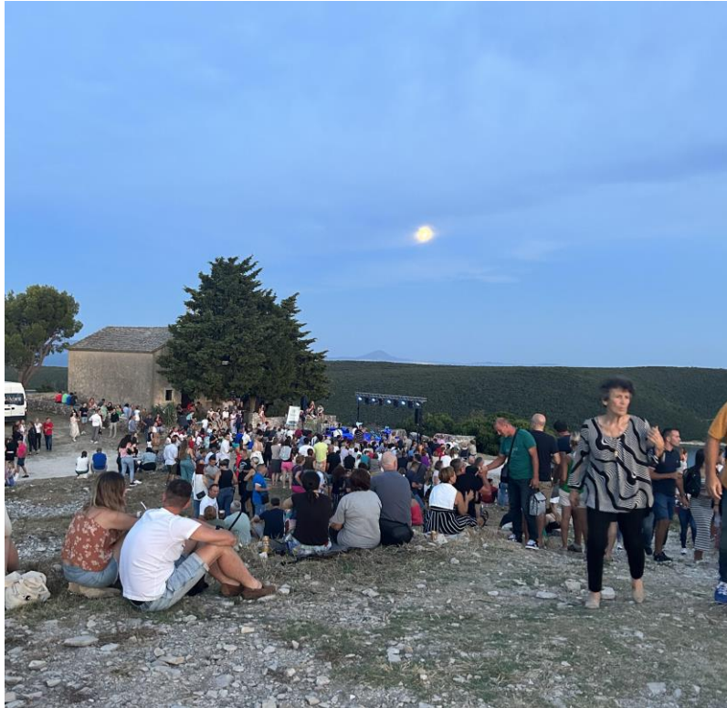
Slika 4. Koncert kod svete Agneze – Oliverove večeri; vlastita fotografija, 2023.

Osim koncerata, popularno je mjesto za održavanje vjenčanja. Najatraktivniji je vidikovac u Istri s kojeg se pruža veličanstveni pogled na Raški zaljev, Labinštinu i Kvarner. Sve veći broj mladenaca odluči se da svoje sudbonosno "da" izjave upravo na ovoj lokaciji.