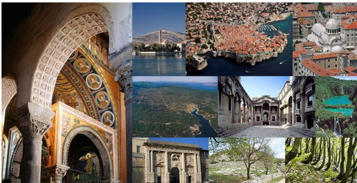
Slika 1. Nepokretna kulturna dobra upisana na UNESCO-ov Popis svjetske baštine