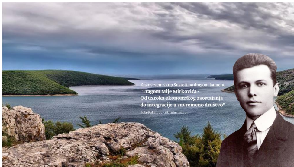
Slika 12. Najava znanstvenog skupa Susreti na dragom kamenu

Ovaj je skup uvijek valorizirao djelo poznatog istarskog pjesnika, pisca i znanstvenika. Ponajviše se bavio mnogostranim Mirkovićevim stvaralaštvom, na kojemu su u trideset godina postojanja obrađeni ključni aspekti njegova znanstvenog, publicističkog i književnog djela, ali i ostale problematike razvojnih i integracijskih procesa Istre. Kako bi se revitaliziralo Mirkovićevo djelo, Fakultet ekonomije i turizma "Dr. Mijo Mirković" s partnerskim institucijama ove godine obnavlja susret povodom 125. godišnjice rođenja Mije Mirkovića. 43