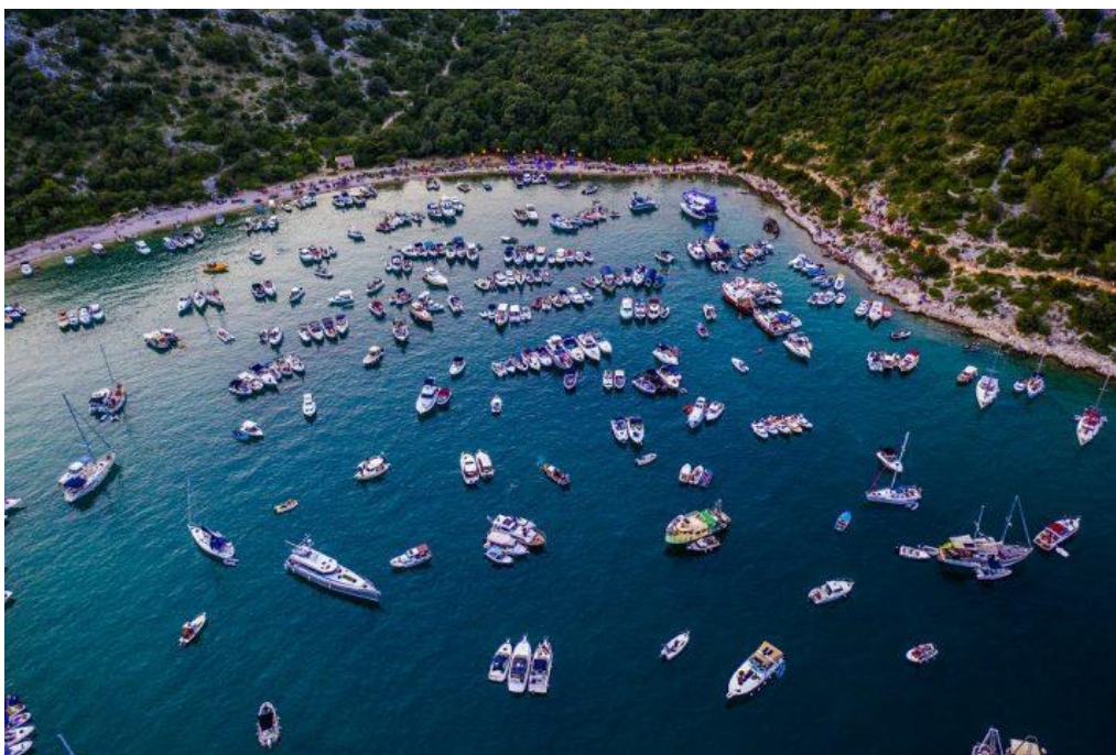
Slika 10. Usidri se za Rišpet – uvala Luka