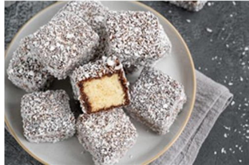
Slika 6. Čupavci

Pred vama se nalazi "Recept za čupavce". Budite kreativni u osmišljavanju recepta da čupavci budu što ukusniji! Vaš zadatak je da uz pomoć ponuđenih imenica i glagola sastavite recept.