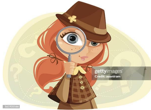
Slika 4. Ilustracija 3 - Budite kreativni i maštoviti! Sretno!