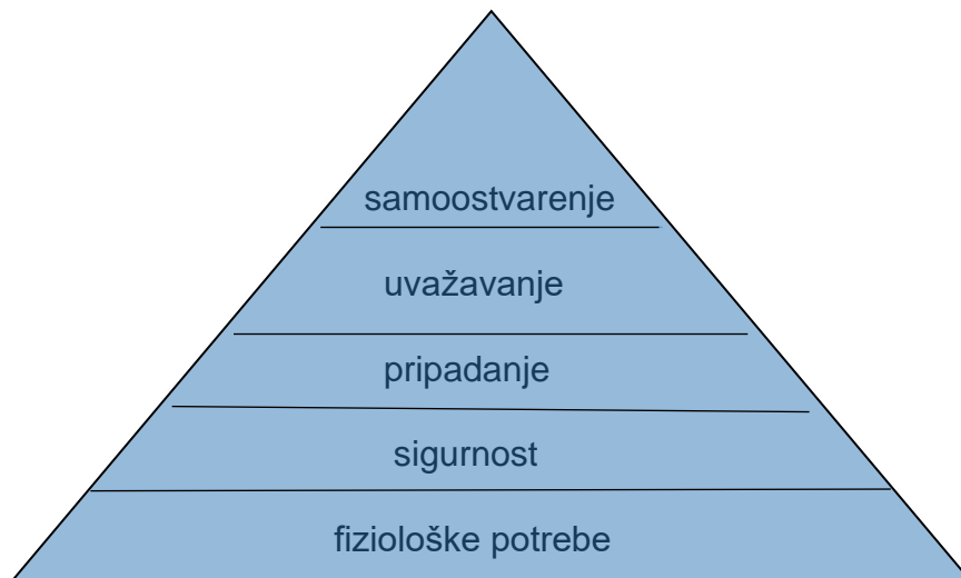
Slika 1. Maslowljeva teorija

Abraham Maslow jedan je od glavnih predstavnika humanističke psihologije. On smatra da se neko ponašanje teško može povezati sa samo jednom potrebom. Ljudi se u životu suočavaju prvo sa potrebama nižeg reda, a onda idu preko potreba višeg reda da bi došli do potreba najvišeg reda. (Vidović i dr. 2003: 210) Kada su zadovoljene potrebe nižeg reda, čovjek se može posvetiti potrebama višeg reda. Maslowljeva teorija potreba izgledom je oblikovana kao piramida i pokazuje potrebe od dna do vrha.