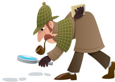
Slika 2 Ilustracija 1 - Budite kreativni i maštoviti! Sretno!.