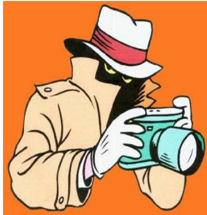
Slika 3. Ilustracija 2 - Budite kreativni i maštoviti! Sretno!