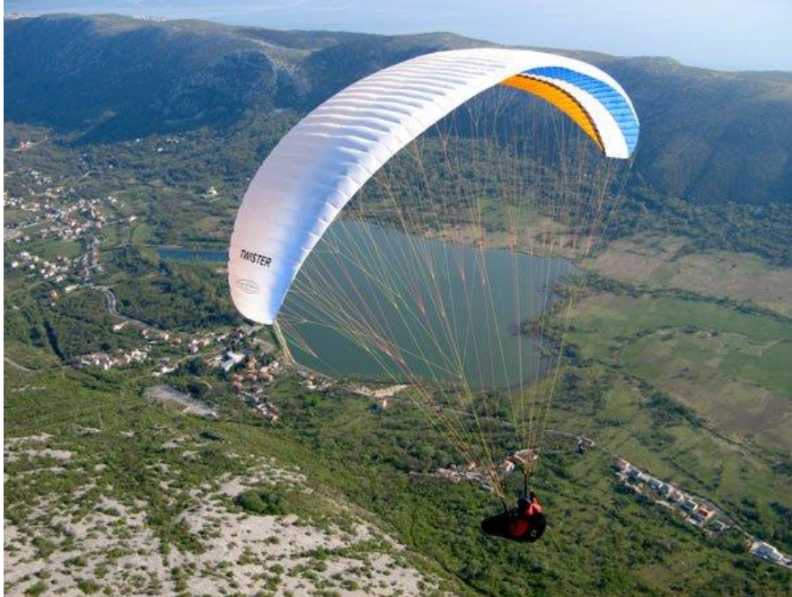
Slika 17: Paragliding, Tribalj