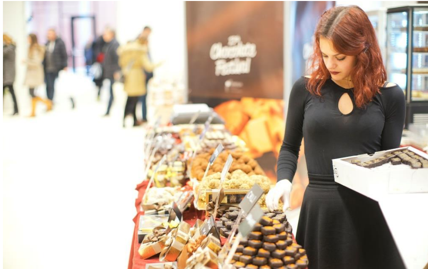
Slika 20. Festival Čokolade, Opatija