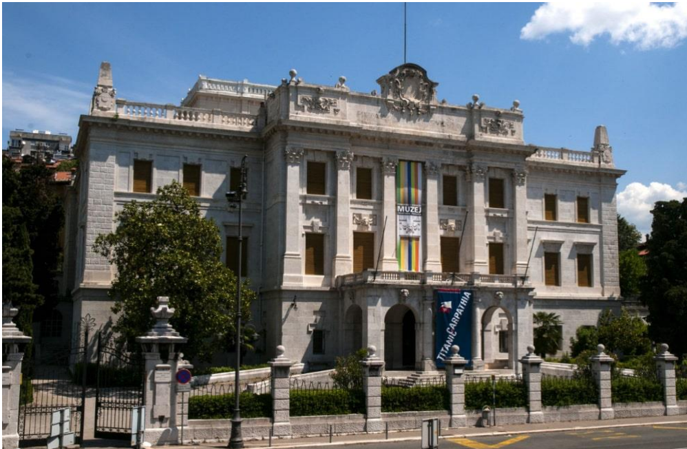
Slika 12. Pomorski i povijesni muzej Hrvatskoj primorja u Rijeci