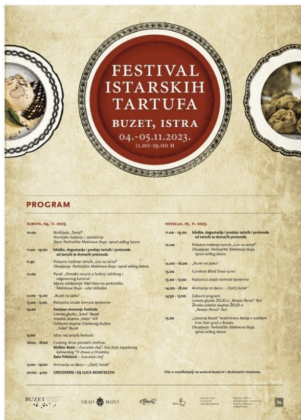
Slika 1. Program Festivala istarskih tartufa