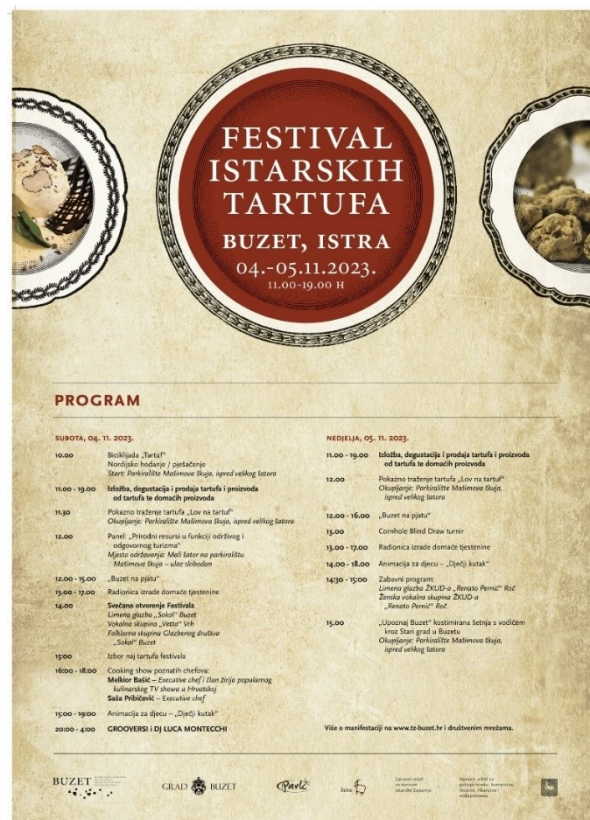
Slika 1. Program Festivala istarskih tartufa