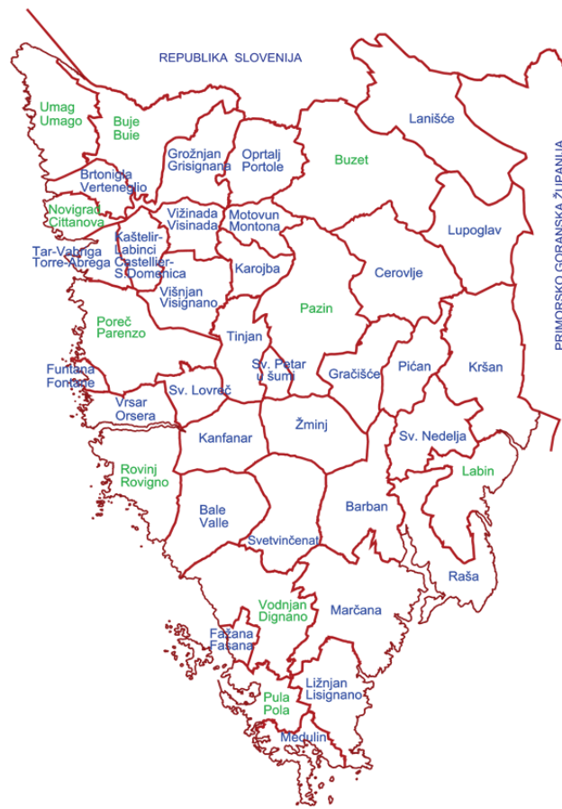
Slika 2 : Općine Istarske županije

Istra je najveći poluotok Jadranskog mora smješten u njegovom sjeveroistočnom dijelu. To je područje koje je iz tri smjera okruženo morem i dijele ga tri zemlje: Italija, Slovenija, na sjeverozapadnom dijelu poluotoka i Hrvatska kojoj pripada 90% ukupne površine poluotoka ili njegov zapadni dio. Skoro cijeli dio hrvatskog dijela poluotoka nalazi se u Istarskoj županiji i predstavlja oko 5% ukupne površine Republike Hrvatske. Nalazi se na pola puta između ekvatora i sjevernog pola i predstavlja most koji povezuje srednjoeuropski kontinentalni prostor s mediteranskim. Osnovna komparativna prednost razvoja turizma Istarskog poluotoka nalazi se u njegovom povoljnom geografskom položaju. Naime, uz odgovarajuće prometne veze ona predstavlja najbliži izlaz na toplo more za područje Srednje Europe. Ova blizina emitivnih centara predstavlja izuzetnu prednost za položaj Istre s obzirom na činjenicu kako preko 70% međunarodnih turista dolazi u Hrvatsku automobilom.