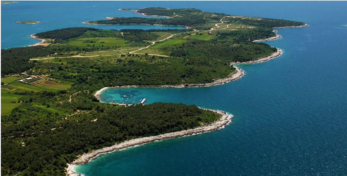
Slika 6 Rt Kamenjak

Rt Kamenjak, koji se nalazi na krajnjem jugu istarskog poluotoka, predstavlja izuzetnu destinaciju unutar konteksta sportskog turizma u Hrvatskoj. Ovaj zaštićeni prirodni krajolik, poznat po svojoj bogatoj bioraznolikosti i specifičnoj geomorfološkoj strukturi, pruža posjetiteljima mogućnost da iskuse razne sportske aktivnosti.