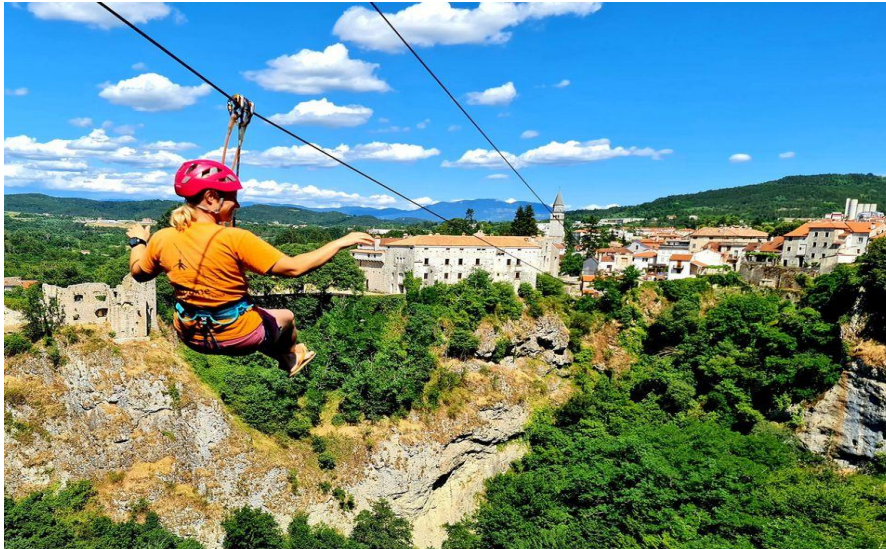
Slika 5 Zip-line Pazinska jama

Pazinska jama, koja se nalazi u srcu Istre, predstavlja jedno od najprepoznatljivijih prirodnih obilježja regije. Ova formacija, koju oblikuje rijeka Pazinčica, oduvijek je bila predmet interesa geologa i prirodoslovaca, no u novije vrijeme postaje sve popularnija destinacija za sportski turizam. Dvije ključne aktivnosti koje privlače posjetitelje u Pazinsku jamu su zip-line i kanjoning, koje zajedno pružaju jedinstveno iskustvo adrenalinskih sportova u prirodnom okruženju.