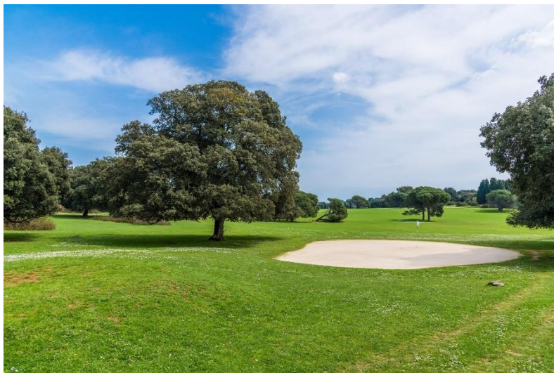
Slika 7 Golf teren na NP Brijuni, Izvor: Službena stranica NP Brijuni, Dostupno na: https://www.np-brijuni.hr/hr/planiraj-posjet/sport/golf (Pristupljeno: 22.8.2024.)

Golf tereni na Brijunima predstavljaju ključni dio sportsko-turističke ponude Hrvatske, s posebnim naglaskom na očuvanje prirodne baštine i integraciju u specifični okoliš arhipelaga. Otoci Brijuni, smješteni u jadranskoj regiji, nude jedinstvenu kombinaciju prirodnih ljepota i visoko kvalitetnog golf iskustva, što ih čini atraktivnom destinacijom za ljubitelje golfa iz cijelog svijeta. Povijest golf terena na Brijunima seže u razdoblje