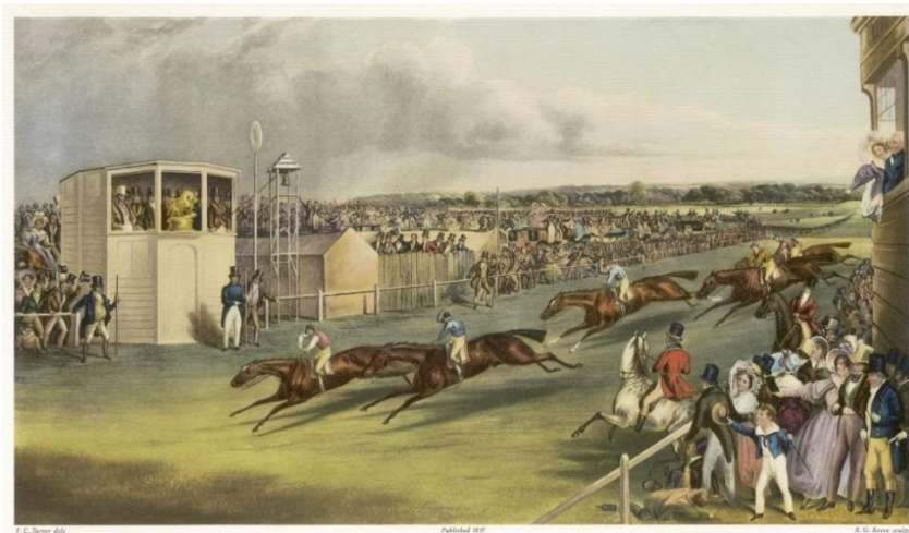
Slika 1: Konjske utrke u Ascotu , Izvor: The History Of Ascot Racecourse , Dostupno na: https://www.ascot.com/history-timeline (pristupljeno 30.7.2024.)