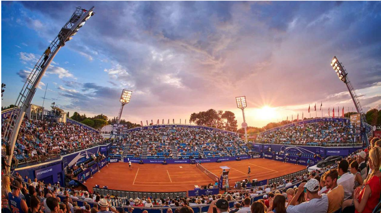
Slika 3 Croatia Open Umag

ATP Croatia Open Umag predstavlja jedan od najvažnijih i najprestižnijih teniskih turnira u Hrvatskoj koji se održava u obalnom gradu Umagu, smještenom na zapadnoj obali Istre. Ovaj turnir, koji je dio ATP World Tour 250 serije, privlači vrhunske svjetske tenisače i ljubitelje tenisa iz cijelog svijeta, te se ističe kao značajan sportski događaj u regionalnom i međunarodnom kalendaru.