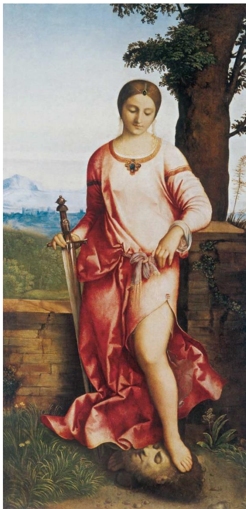
Slika 6. Judita, Giorgione, oko 1504. godine