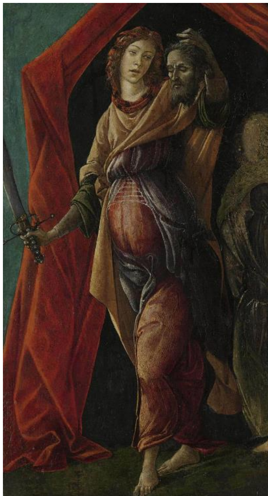
Slika 5. Judita s glavom Holoferna, Sandro Botticelli, 1497.godina

Nadalje, slika Judite Sandra Botticellija nudi složen prikaz koji obuhvaća i emocionalne i simboličke slojeve biblijske priče. Na ovoj slici Judita je prikazana kako trijumfalno drži odsječenu Holofernovu glavu u jednoj ruci, dok u drugoj drži mač. Mekan, gotovo nježan način na koji drži Holofernovu glavu u kontrastu je sa smrtonosnim oružjem u njezinoj drugoj ruci, simbolizirajući dvostruku prirodu njezine prijevare. Iskoristila je svoju ljepotu i lukavost da ga emocionalno razoruža, što je dovelo do njezine konačne pobjede. Judita svojim smirenim i staloženim izrazom prenosi i ranjivost koju je projicirala i snagu koju je upregnula da izvrši svoju misiju.