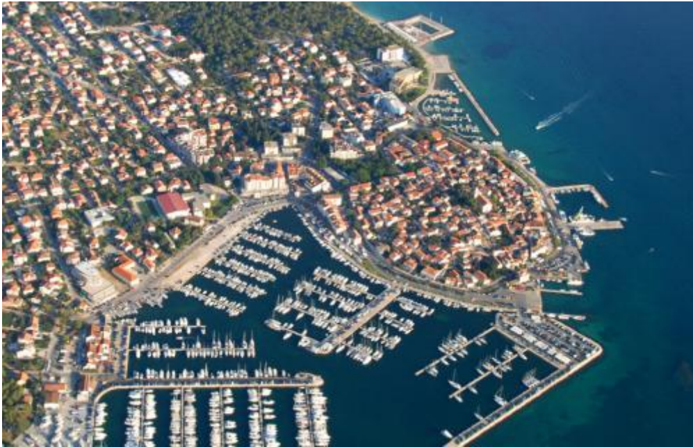
Slika 3 Marina Kornati Biograd na Moru

turizam po cijelom Jadranu, i prvu vlastitu charter flotu od četrdeset Elanovih plovila, te je s punim pravom ponijela naziv pionira nautičkog turizma, dok je grad Biograd postao kolijevka nautičkog turizma.“ 16 Marina Kornati je danas među top 3 marina u Hrvatskoj. Marina je kompletirala svoje usluge i povećala kapacitet te sadrži 805 vezova od čega ih je 70 na kopnu i 15 na gatova sa priključcima za struju i vodu.