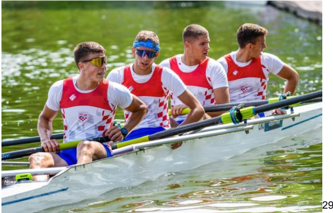
Slika 11 Veslanje na rijeci Krki

Šibenska regata. Poznata je jedriličarska regata koja se održava svake godine. Veslačka natjecanja na rijeci Krki. U organizaciji Veslačkog kluba u Šibeniku, često se održavaju natjecanja i regate na rijeci Krki te privlači veslače iz cijele Hrvatske.