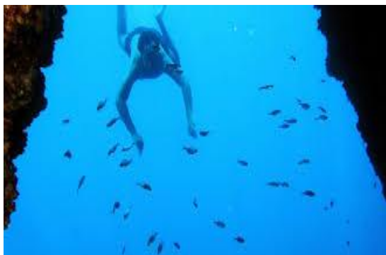
Slika 4 Ronjenje u Zadru

je i nezaboravno iskustvo. Čak i u čudesnom Nacionalnom parku Kornati možete uživati u ronjenju na devet prekrasnih lokacija, ali nužno poštujući pravila Parka.“ 19 Zadarska županija napreduje i razvija se kontinuirano.