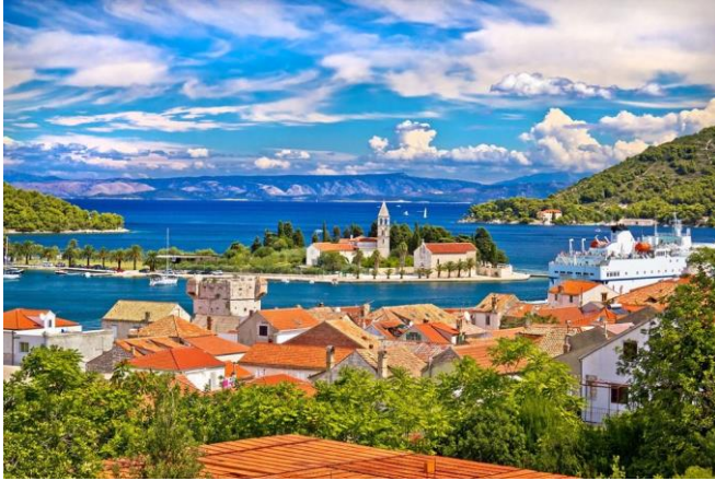
Slika 29 Otok Vis

koja privlači mnogo turista diljem svijeta. Svaki od ovih otoka ima jedinstvene prirodne i kulturne znamenitosti te ih čini idealnim lokacijama za različite sportske aktivnosti.