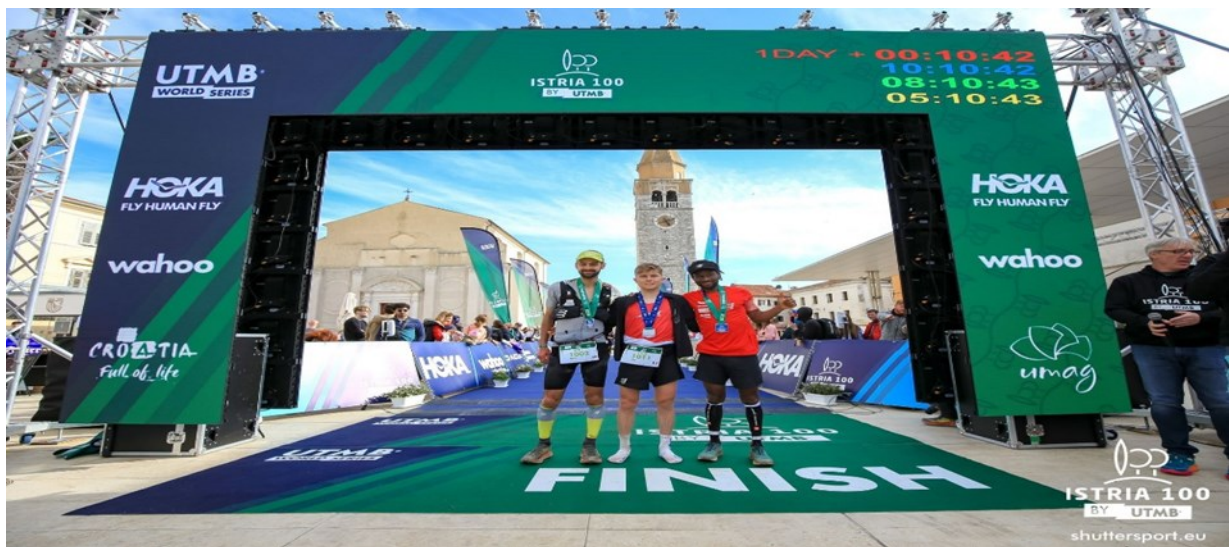
Slika 7. Trail utrka u Istarskoj županiji

Turističkoj ponudi Umaga uvelike nedostaje sadržaja i aktivnosti za goste koji odluče svoj boravak provesti u hotelskom smještaju. Zabavni programi i folklorne manifestacije nemaju više svoj kontinuitet. Unatoč visoko kategoriziranim luksuznim objektima turistima nedostaju gastronomske ponude, prezentacija folkloru i običaja kojima bi upotpunili svoje već dobro poznate sadržaje.