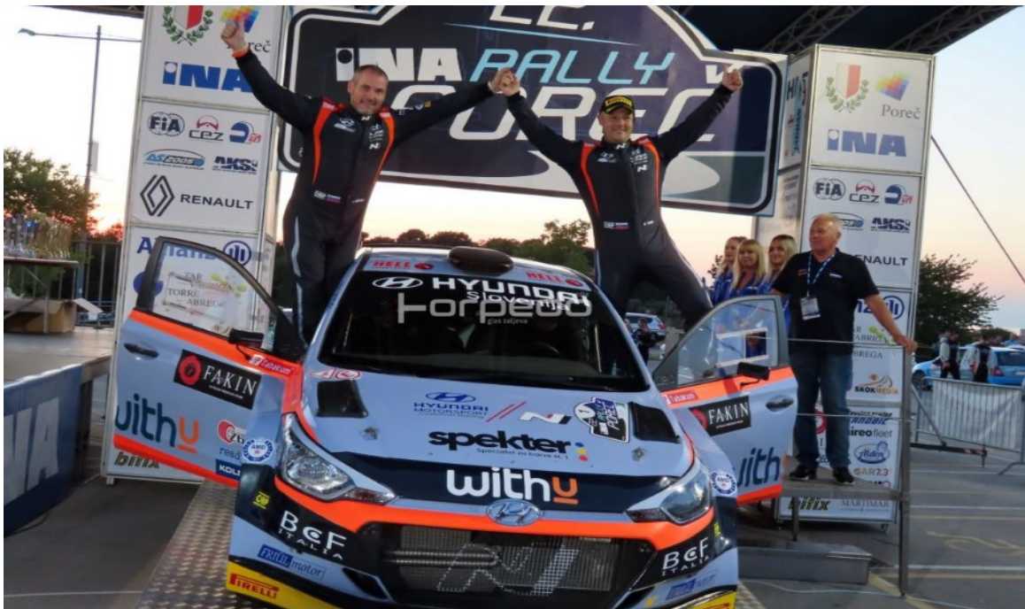
Slika 5. Rally Poreč