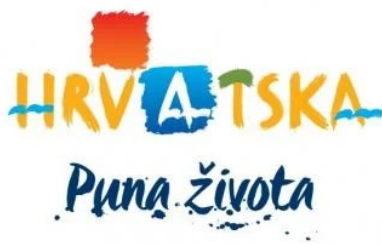
Slika 1. Logo Hrvatske turističke zajednice

razine kvalitete cjelokupne turističke ponude u Republici Hrvatskoj (Hendija, 2011.). U krug rada HTZ-a ulazi i upravljanje sustavom eVisitor te drugim turističkim informacijskim sustavima, ali i koordinacija svih turističkih zajednica, kao i svih gospodarskih te drugih subjekata u turizmu koji djeluju neposredno i posredno na unapređenju i promidžbi turizma u Hrvatskoj. Hrvatska turistička zajednica ima sjedište u Zagrebu i 19 ureda predstavništava i ispostava u svijetu: Frankfurt (Njemačka), München (Njemačka), Beč (Austrija), Ljubljana (Slovenija), Milano (Italija), Prag (Češka), Bratislava (Slovačka), Varšava (Poljska), Pariz (Francuska), London (Velika Britanija), Budimpešta (Mađarska), Amsterdam (Nizozemska), Bruxelles (Belgija), Stockholm (Švedska), Moskva (Rusija), New York (SAD), Los Angeles (SAD), Shanghai (Kina), Seoul (Južna Koreja). (Hrvatska turistička zajednica, 2024.)