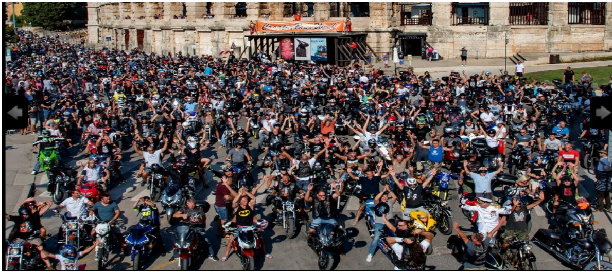
Slika 2. Croatia Bike Week