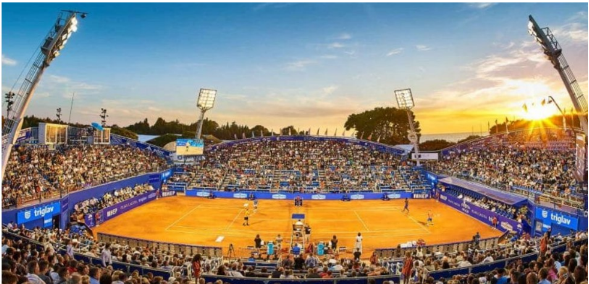
Slika 6. ATP Umag