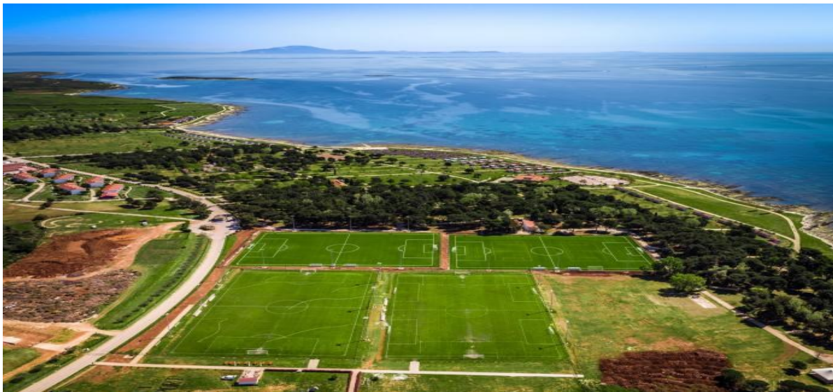
Slika 4. Nogometni tereni u Medulinu