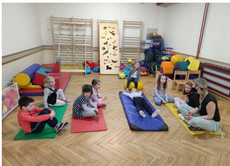
Slika 11. Završni dio aktivnosti tjelesnog odgoja: odgojitelj razgovara s djecom