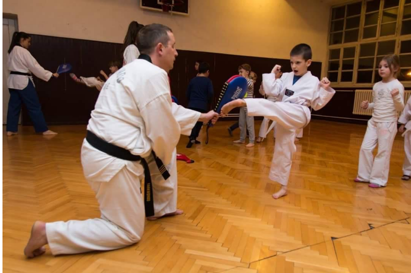
Slika 16. Specijalizirani sportski program: taekwondo