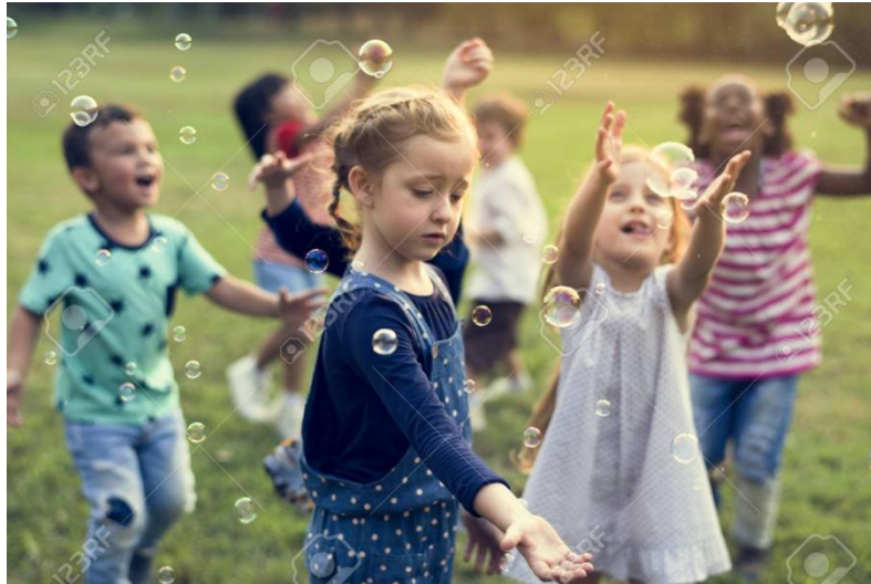
Slika 6. Igra „Lov na mjehuriće”