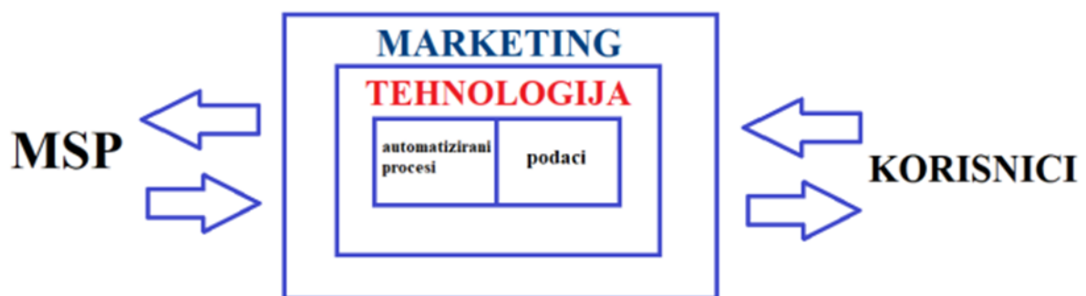
Slika 2. Uloga tehnologije u digitalnoj transformaciji marketinga malih i srednjih poduzeća

Izvor: Pihir, I. (2019): Digitalna transformacija marketinga u malim i srednjim poduzećima – pregled postojećih istraživanja, CroDiM, Vol. 2, No. 1, str.131