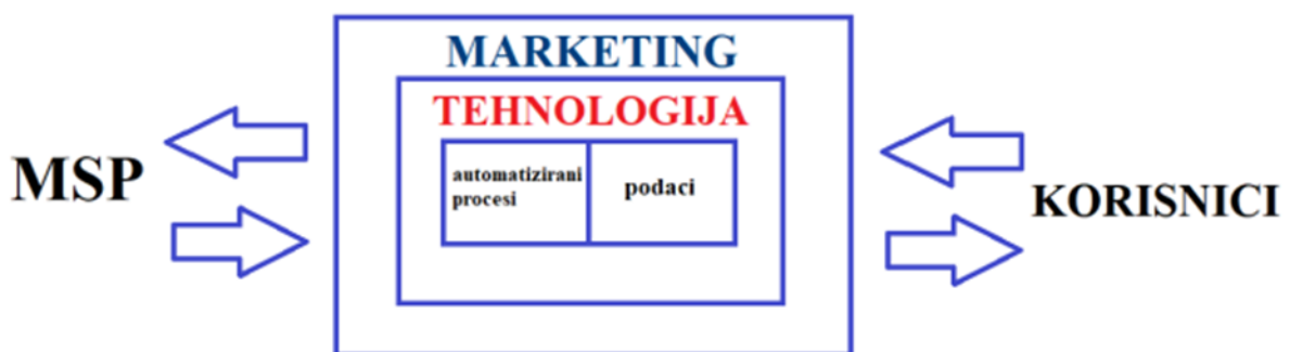
Slika 2. Uloga tehnologije u digitalnoj transformaciji marketinga malih i srednjih poduzeća

Izvor: Pihir, I. (2019): Digitalna transformacija marketinga u malim i srednjim poduzećima – pregled postojećih istraživanja, CroDiM, Vol. 2, No. 1, str.131