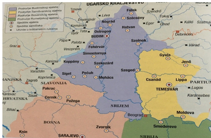
Slika 2. Osmanska uprava u Ugarskoj