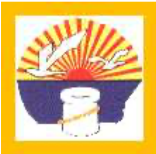
Slika br. 2 – Grb Selca