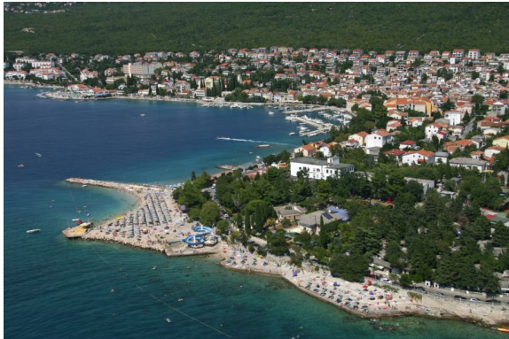
Slika br. 1 – Panorama Selca

Izvor: http://www.rivieracrikvenica.com/sites/default/files/selce-panorame_selce_0908-11-1067.jpg (08.08.2023.)