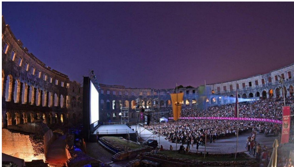
Slika 1. Pula Film Festival

Pula Film Festival (Slika 1.) godišnji je natjecateljski festival hrvatskog dugometražnog igranog filma koji se održava od 1954. u pulskoj Areni. Najprije je održan kao Revija domaćeg filma, a od 1955. kao Filmski festival u Puli. Od 1960. razdvojen je na dva festivala: Festival jugoslavenskog igranog filma u Puli i Festival jugoslavenskog dokumentarnog i kratkometražnog filma u Beogradu.