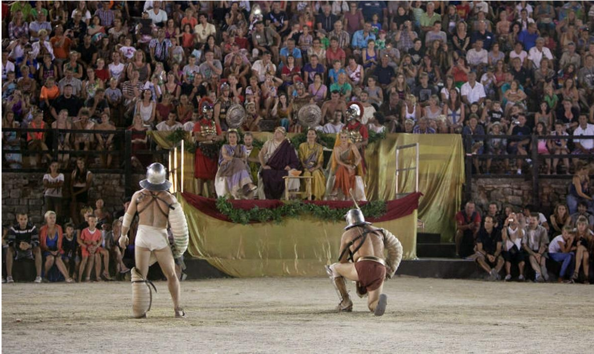
Slika 2. Spectacvla Antiqva