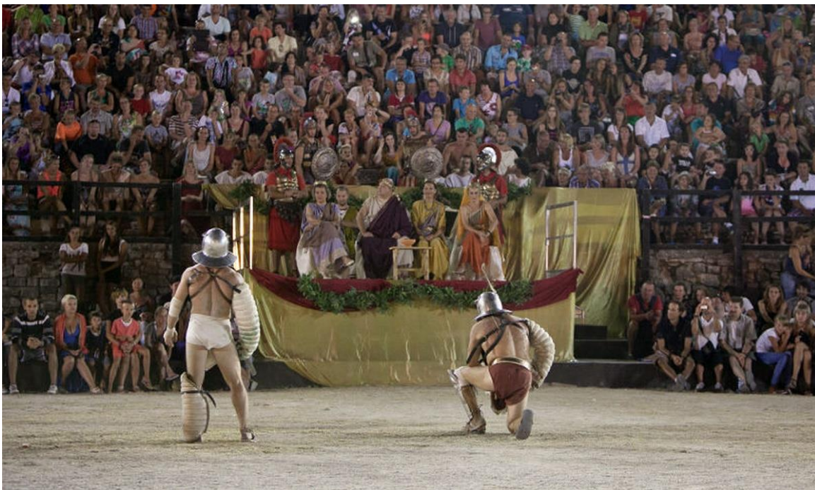
Slika 2. Spectacvla Antiqva