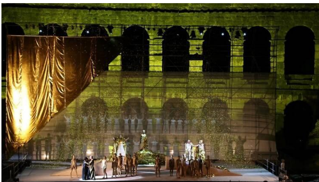
Slika 3. Operne sezone u pulskoj Areni

opera pod nazivom Opera Madama Butterfly , nakon punih 45 godina. Važno je spomenuti i operne sezone u pulskoj Areni (Slika 3.), ljetne glazbeno-scenske predstave koje su se održavale između Prvog i Drugog svjetskog rata u Areni u Puli, a nastavile su se, s prekidima, i kasnije ( https://www.istrapedia.hr/hr/natuknice/447/operne-sezone-u-pulskoj-areni , posjećeno 17. kolovoza 2024.). Od 1978. Pula je dio Operne sezone Opatija-Rijeka, gdje u pulskoj Areni redovito nastupa opera NK „Ivan Zajc” iz Rijeke s domaćim i inozemnim solistima. U trećem tisućljeću operne predstave se nastavljaju kroz različite festivale i gostovanja, poput Histria Festivala i Pulskog kulturnog ljeta.