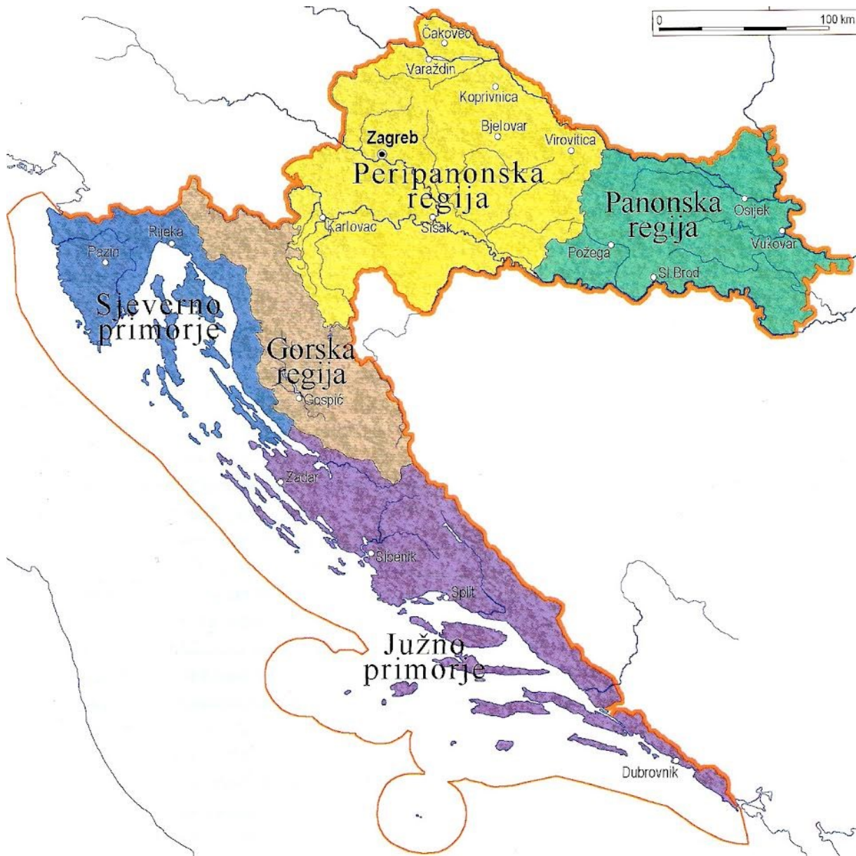
Slika 1. Turističke regije Hrvatske

Ovome radu je aktualna geografska podjela na četiri regije prikazane na slici 1, a diplomski je fokusiran na regiju Središnju Hrvatsku odnosno Peripanonsku regiju.