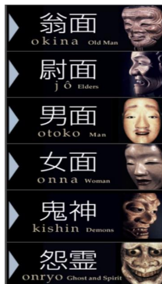
Slika 4. Maske u izvedbama nōa