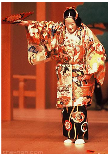
Slika 3. Kostim nōa