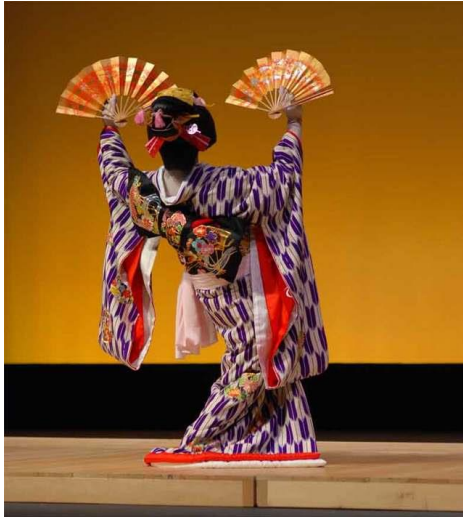
Slika 1. Kostim kabukija