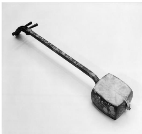
Slika 5. Instrument shamisen korišten u predstavama kabukija