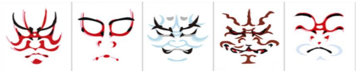
Slika 2. Prikaz šminke korištene u kabukiju