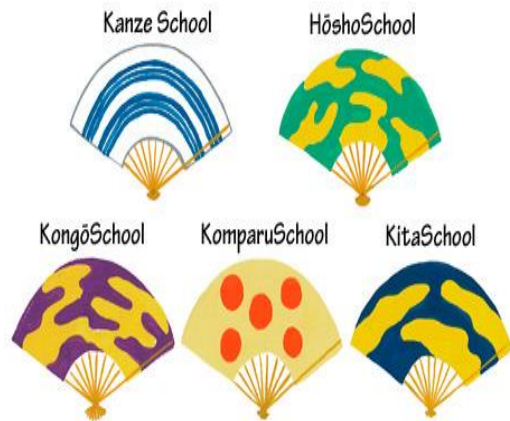
Slika 8. Tradicionalne lepeze korištene u predstavama nōa