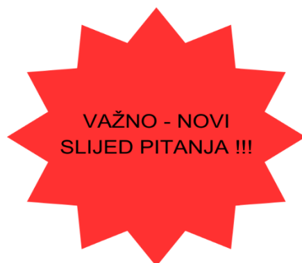
Slika 10. Vizualno upozorenje novog slijeda pitanje