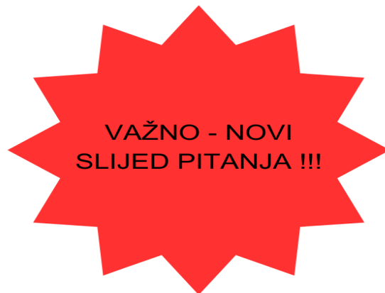
Slika 6. Vizualno upozorenje novog slijeda pitanja