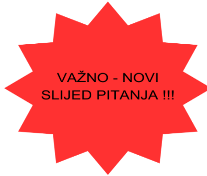
Slika 11. Vizualno upozorenje novog slijeda pitanja