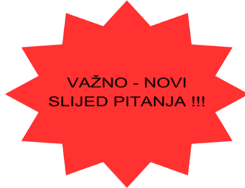
Slika 2. Vizualno upozorenje novog slijeda pitanja