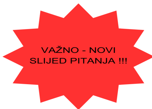
Slika 4. Vizualno upozorenje novog slijeda pitanja