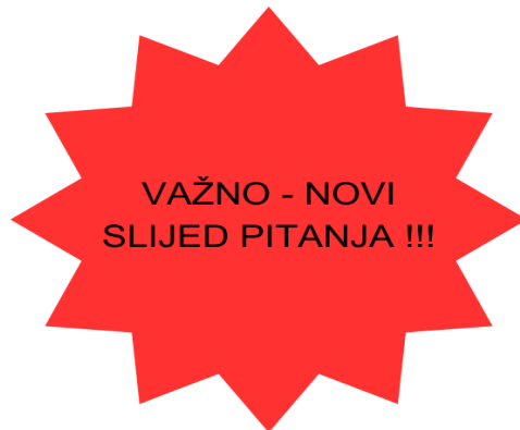
Slika 8. Vizualno upozorenje novog slijeda pitanja