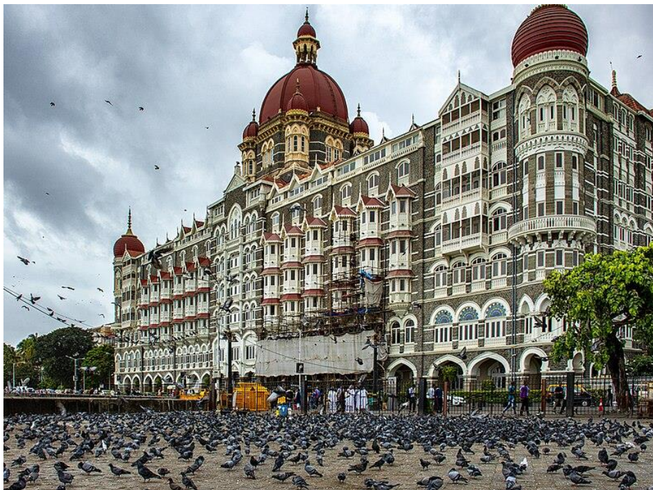
Slika 4. Heritage hotel Taj Mahal Palace