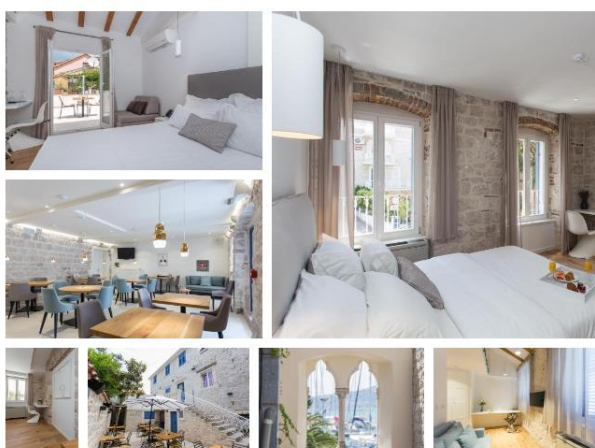
Slika 3. Heritage hotel Bifora