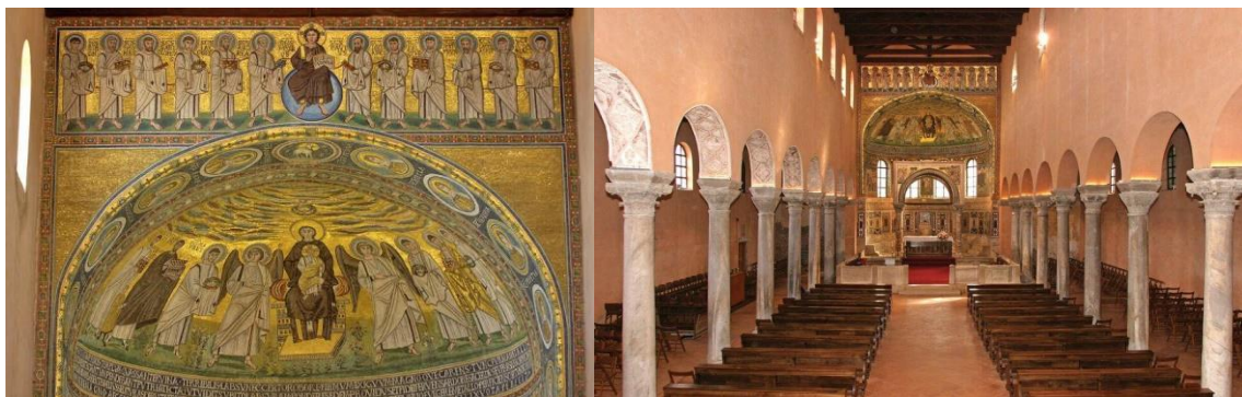
Slika 1. Eufrazijeva bazilika u Poreču