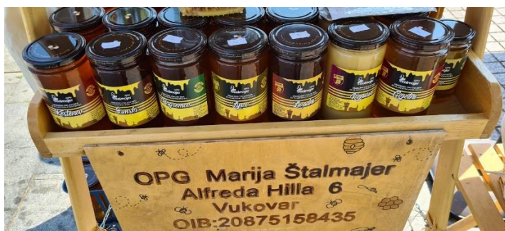
Slika 3. Med kao domaći proizvod OPG – a Štalajmer MED