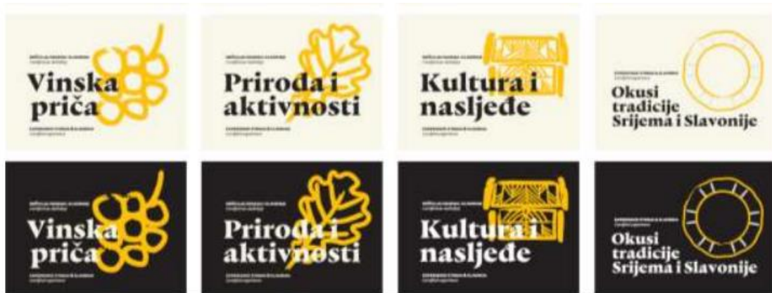
Slika 1. Oznake standarda kvalitete Vukovarsko srijemske županije