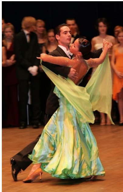
Slika 6. Prikaz bečkog valcera kao primjer