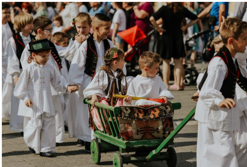
Slika 23. Đakovački mali vezovi

S vremenom, Đakovački vezovi su izrasli u jedan od najvažnijih i najprestižnijih festivala te vrste u Hrvatskoj, s izuzetno bogatom izdavačkom djelatnošću koja prati sve manifestacije festivala. Njihova popularnost potvrđena je i velikim brojem posjetitelja – prema podacima Ministarstva turizma iz 2019., festival godišnje privuče oko 110.000 ljudi. Ova manifestacija ne samo da čuva i promiče bogatu kulturnu baštinu Đakova i Slavonije, već i pridonosi razvoju turizma u regiji, čineći Đakovačke vezove jedinstvenim kulturnim događajem na nacionalnoj i međunarodnoj razini.