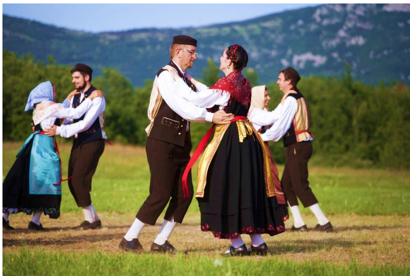
Slika 5. Istarska polka