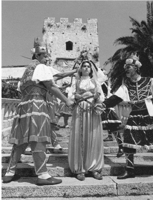
Slika 15. Moreška – djevojka „bula“