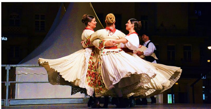
Slika 18. Drmeš