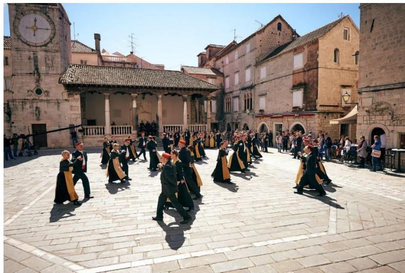
Slika 9. Trogirska kvadrilja