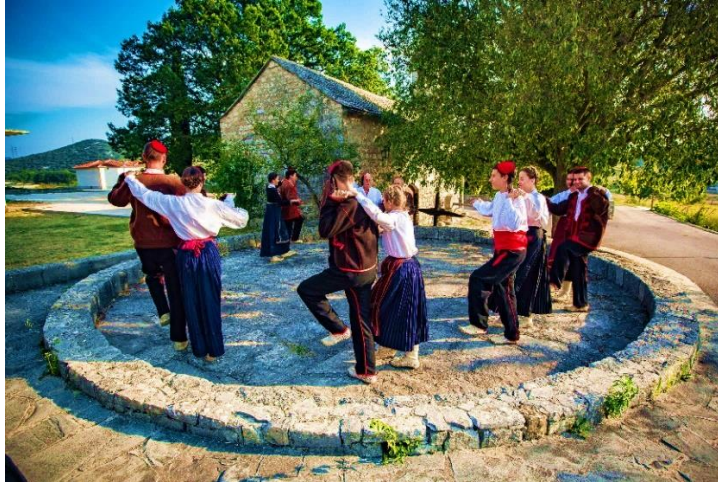
Slika 10. Nijemo kolo s područja Dalmatinske zagore