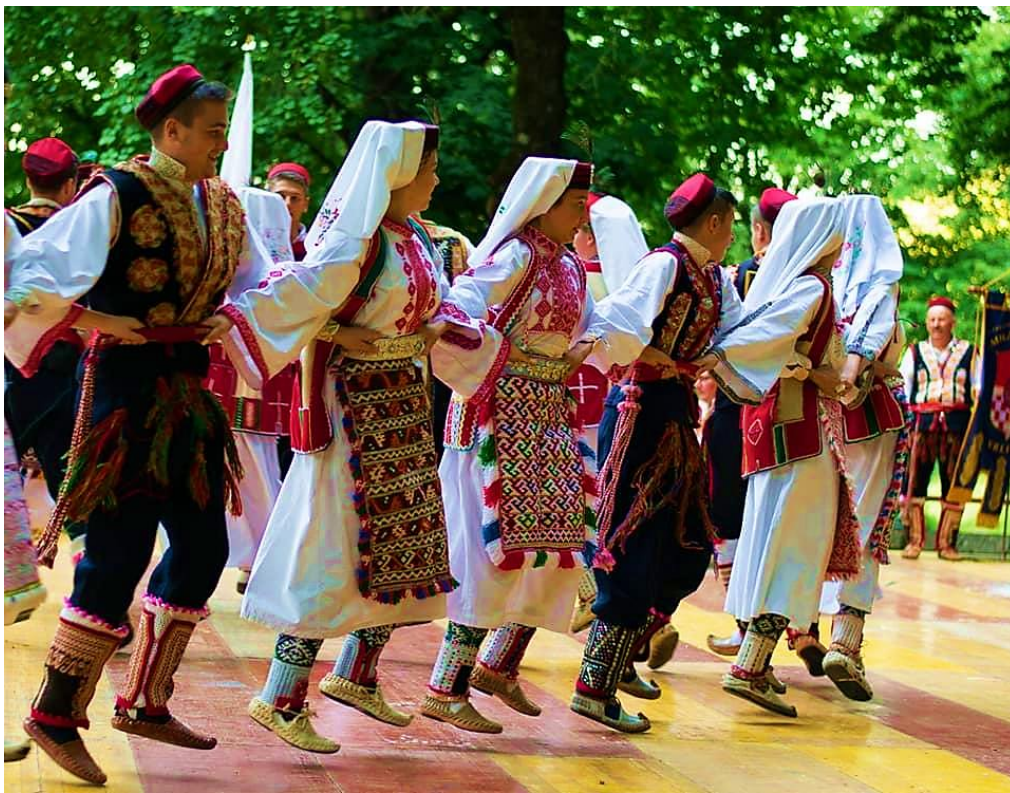
Slika 2. Vrličko kolo, Dalmatinska zagora