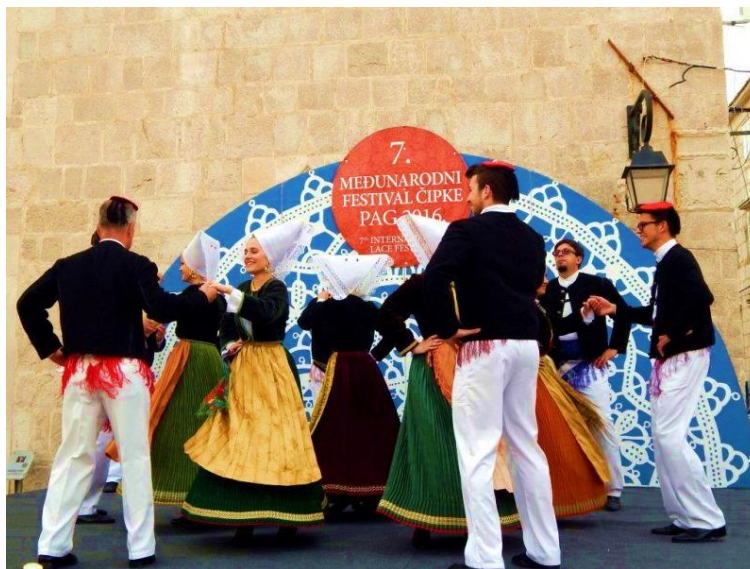
Slika 8. Paški tanac