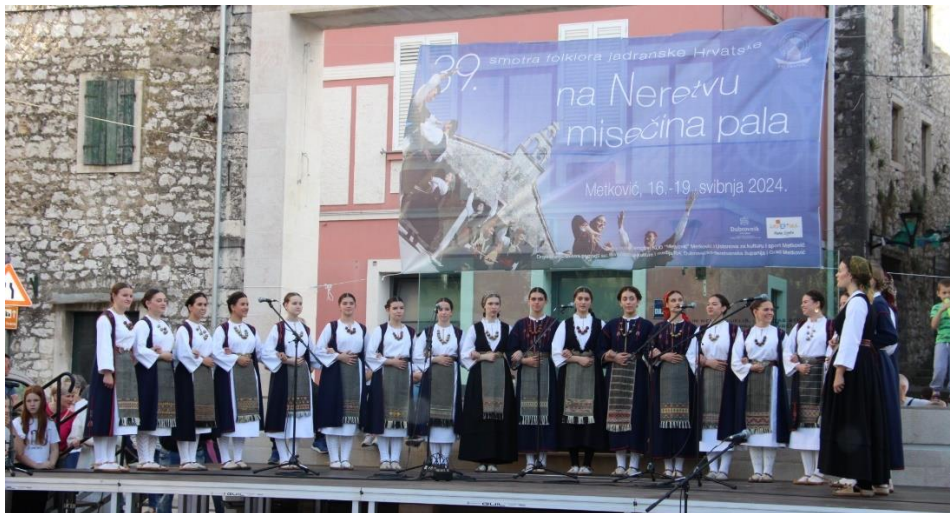
Slika 25. Smotra folkloru „Na Neretvu misečina pala“