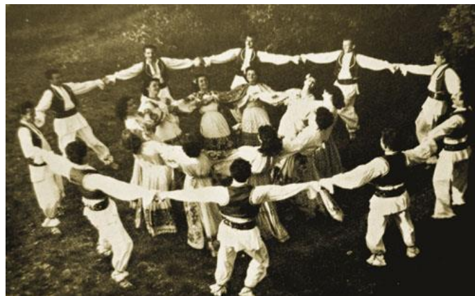
Slika 7. Ličko kolo