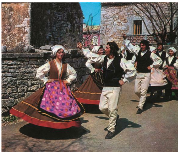
Slika 4. Balun