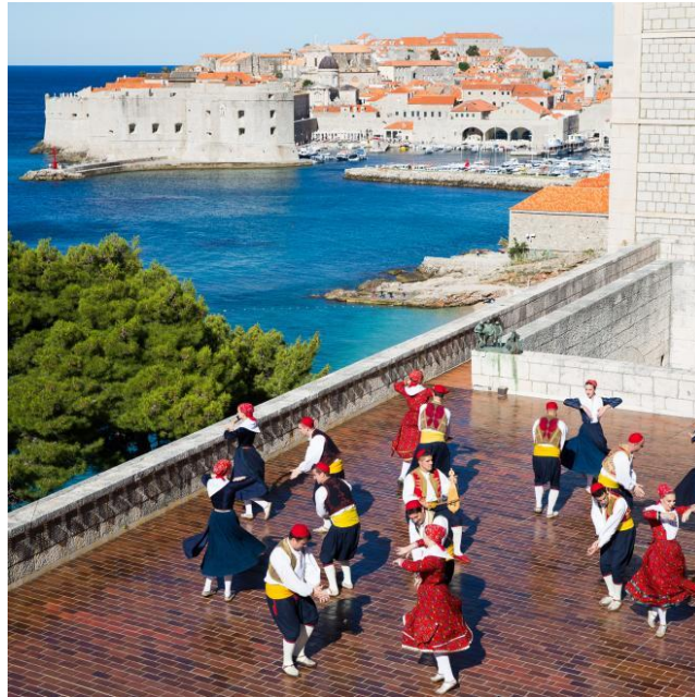
Slika 13. Folklorni ansambl Linđo