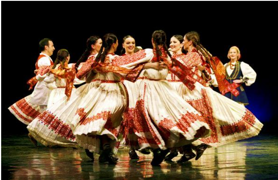
Slika 17: Slavonsko kolo