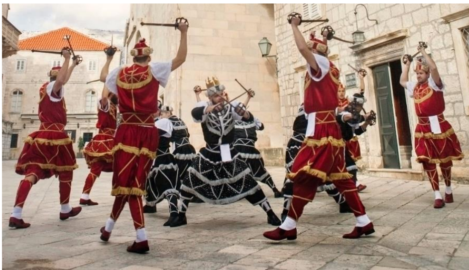
Slika 14. Moreška – borbeni ples s mačevima