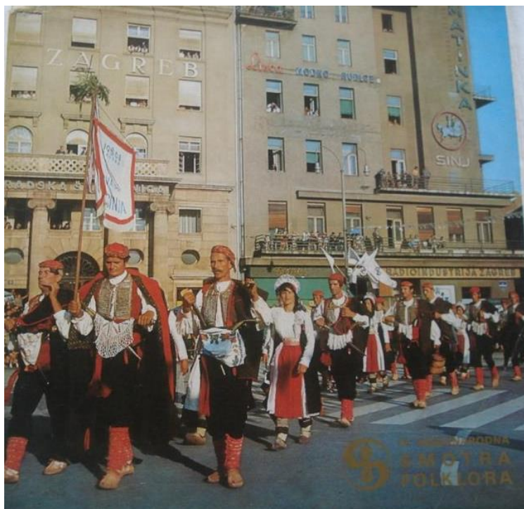
Slika 20. IV Međunarodna smotra folkloru u Zagrebu 1969.