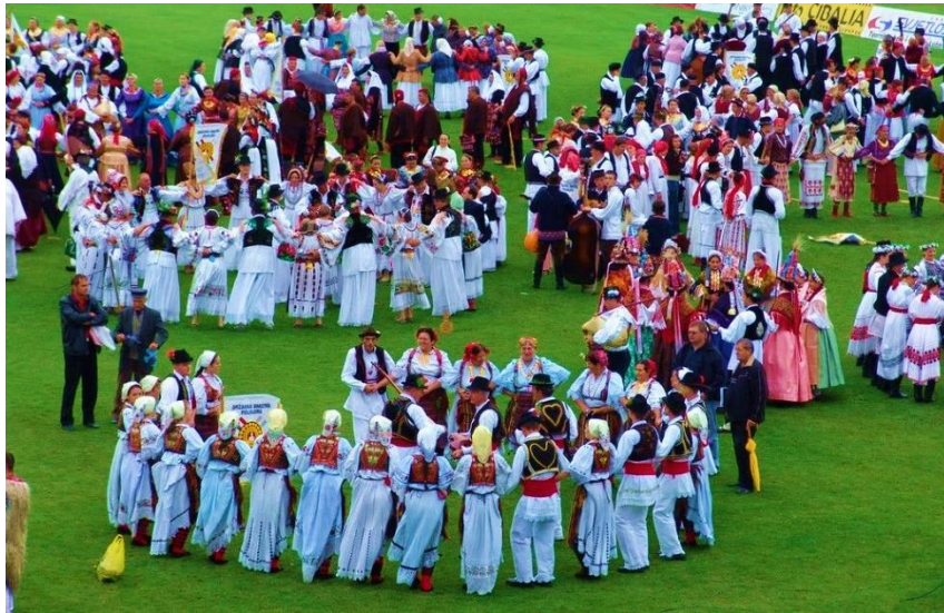
Slika 16. Šokačko kolo