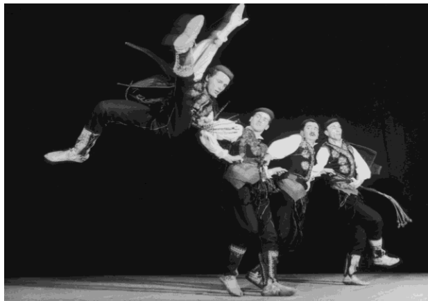
Slika 11. Poznati skok kao dio nijemog kola