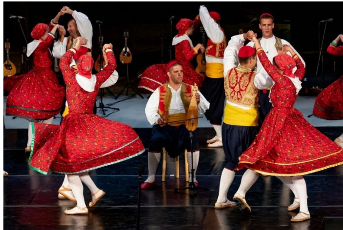
Slika 12. Lindo na Dubrovačkim ljetnim igrama