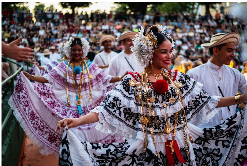
Slika 26. MFF – Ulazak folklorne skupine Panama