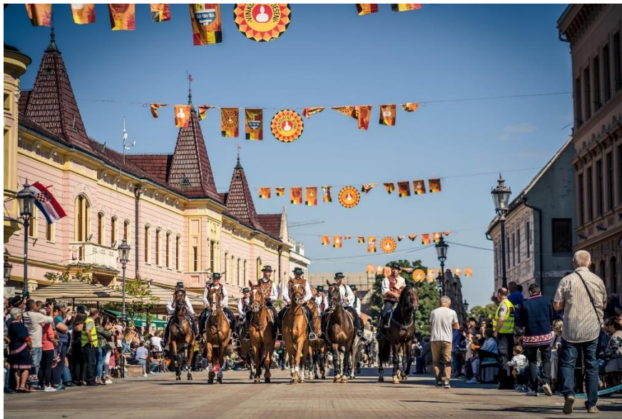
Slika 22. Vinkovačke jeseni – mimohod