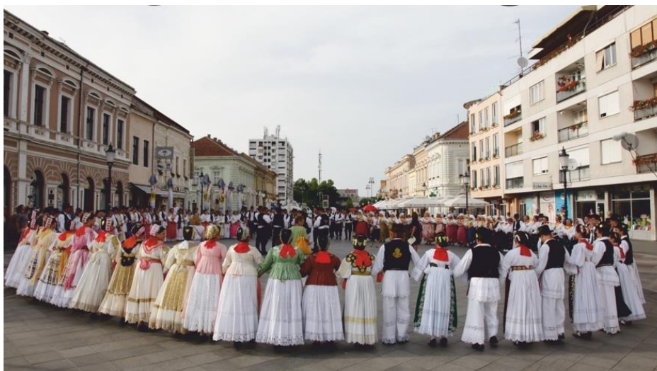
Slika 24. 60. Brodsko kolo