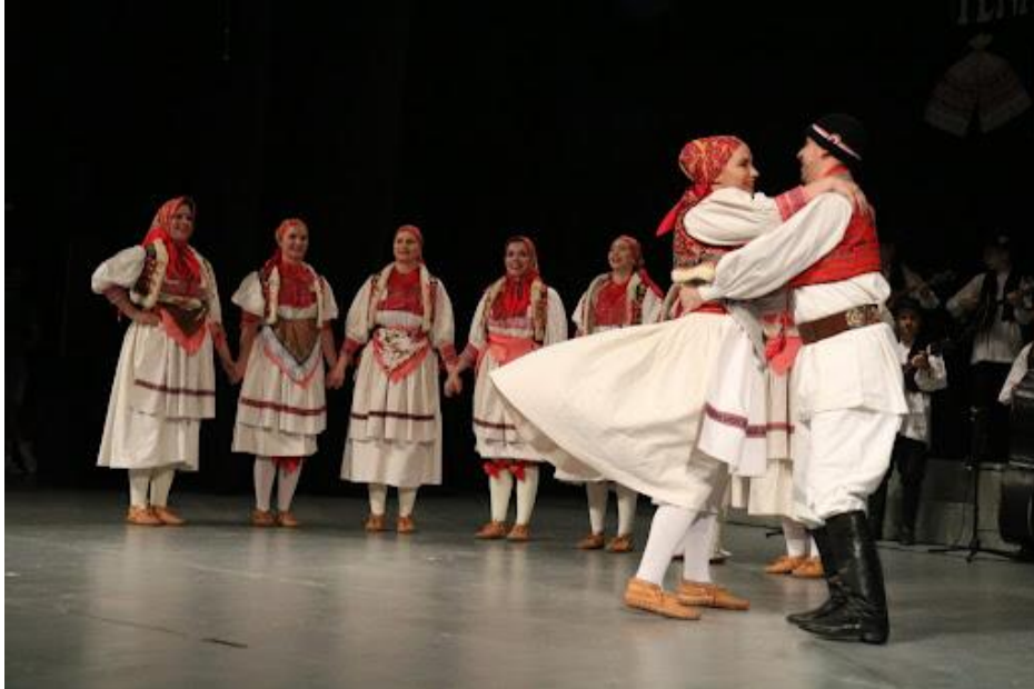
Slika 19. Polka