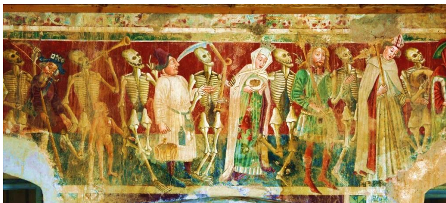
Slika 1. Prikaz freske beramskog Plesa mrtvacu