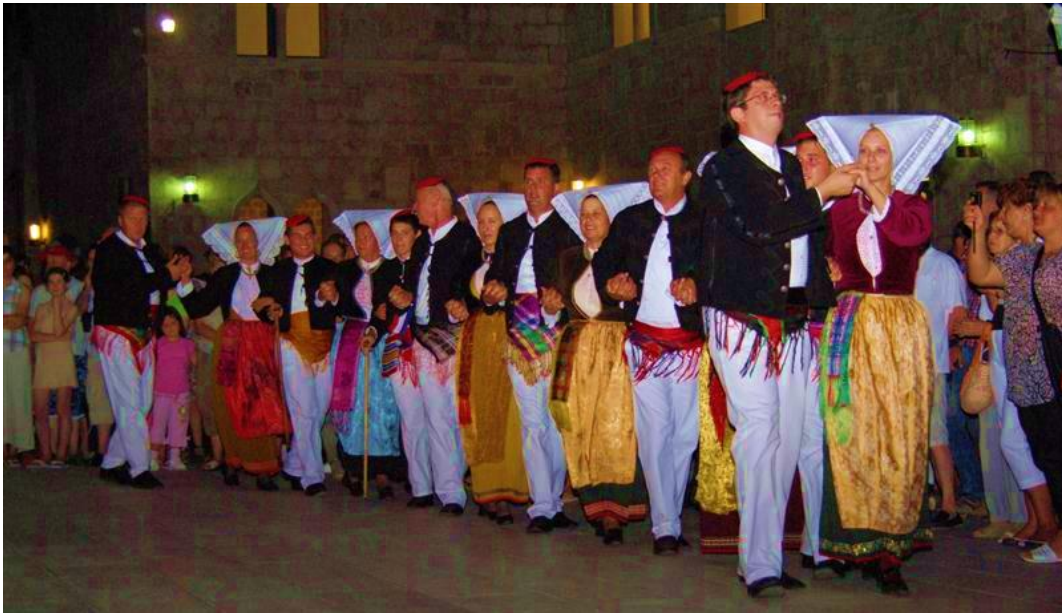
Slika 3. Paško kolo, Pag