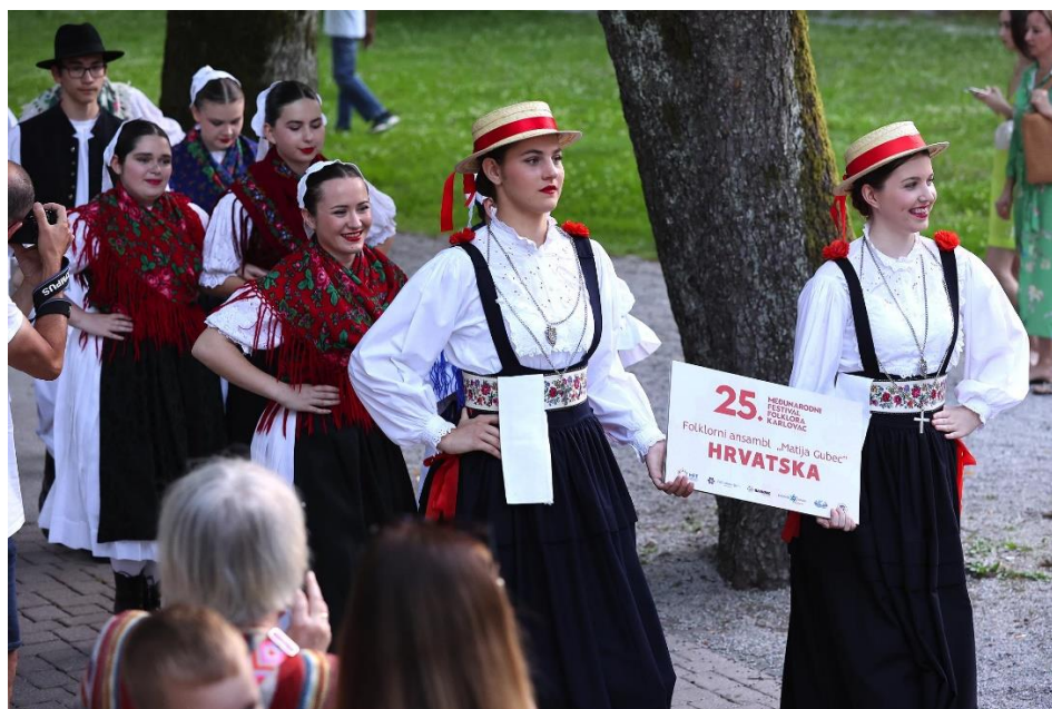
Slika 27. MFF – Ulazak folklorne skupine Hrvatska