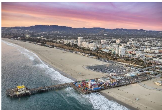
Slika 15.: Santa Monica i Los Angeles