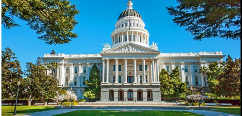
Slika 12. California State Capitol Museum

pokrete poput borbe za građanska prava. Muzej također sadrži obnovljene povijesne prostorije, uključujući ured guvernera i zakonodavne komore, koje nude uvid u političke procese i povijest države.