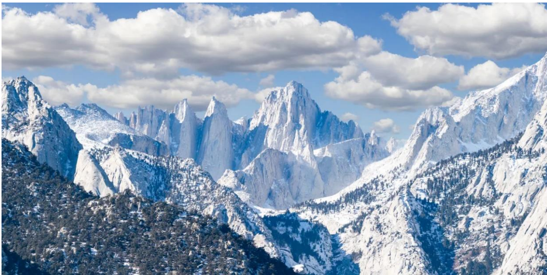
Slika.1. Mt. Whitney

Najznačajniji i od brojnih planinskih lanaca države je Sierra Nevada u Kaliforniji, Sierra Nevada je asimetričan lanac s vrhom i visokim vrhovima prema istoku. Vrhovi se kreću od 11.000 do 14.000 stopa ili 3.350 do 4.270 metara nadmorske visine, od Mount Whitney (Slika 1.) do 14.494 stopa ili 4.418 metara, najvišeg vrha u susjednim Sjedinjenim Državama. Planinski lanac Sierra Nevada nalazi se u istočnoj Kaliforniji.