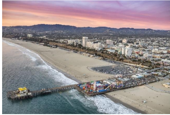
Slika 15.: Santa Monica i Los Angeles