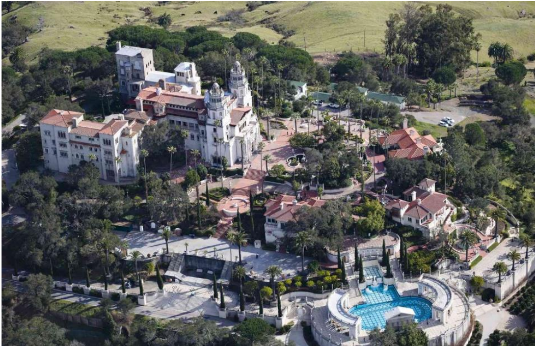
Slika 13. Kompleks dvorca Hearst

unutarnji bazen Neptune Pool , okružen klasičnim grčkim kipovima, te zatvoreni Rimsky bazen s detaljima u zlatnim mozaicima.