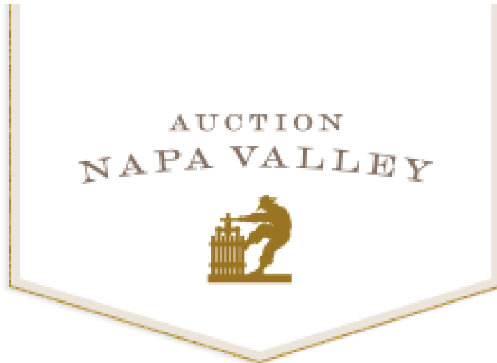
Slika 14.: Napa Valley Wine Auction Logotip

Napa Valley Wine Auction je prestižna aukcija vina koja se održava godišnje u regiji Napa Valley u Kaliforniji, poznatoj po proizvodnji vrhunskih vina. Ova događanja privlače kolekcionare vina, ljubitelje gastronomije i filantropije iz cijelog svijeta, koji dolaze sudjelovati u aukciji najboljih vinskih berbi i ekskluzivnih doživljaja povezanih s vinogradarstvom. Napa Valley Wine Auction ne samo da promiče vrhunska vina i kulinarsstvo, već i podržava lokalne zajednice kroz dobrotvorne svrhe, prikupljajući sredstva za edukaciju, zdravstvene inicijative i očuvanje okoliša. Ovaj događaj je izvanredna prilika za uživanje u najboljim vinima, upoznavanje s vodećim vinarijama i podršku lokalnim inicijativama koje obogaćuju zajednicu Napa Valleya . Vinarije Napa Doline kroz uspjeh industrije privlače oko 3,5 milijuna turista kroz godinu.