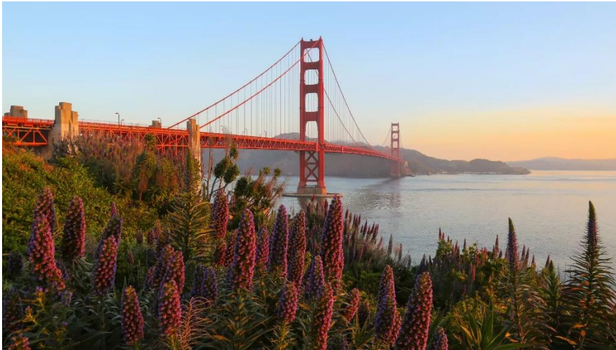
Slika 10. Most Golden Gate

projektiranju visećih mostova, čast projektiranja Golden Gatea pripada Leonu Mosesu, koji je projektirao i poznati Manhattan Bridge u New Yorku. Stupovi ovog impresivnog mosta uzdižu se na visinu od 227,4 metra, dok most visi na sajlama promjera do 93 centimetra, koji su napravljeni kao snop od 27.572 čelične žice. Zbog svoje snage ne mogu ga ugroziti vrlo loši vremenski uvjeti. Ukupna dužina mosta je 2737,4 metra, a danas preko njega dnevno prelazi više od 100.000 vozila. Most ima ukupno 6 traka koji povezuju gradove San Francisco i Marin County .