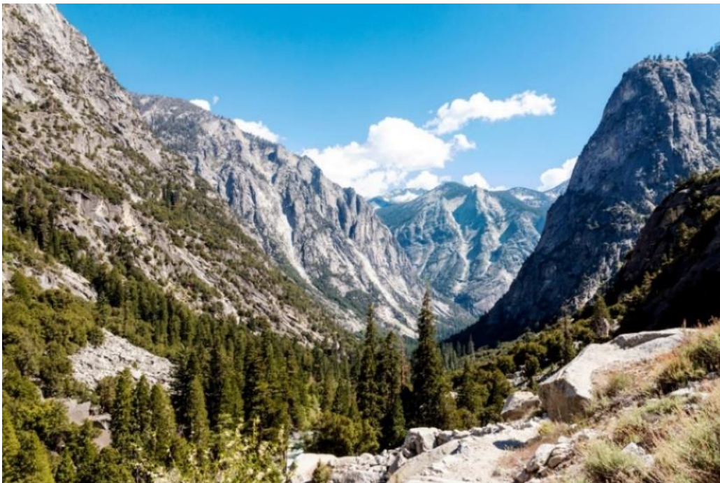
Slika 9. Nacionalni park Kings Canyon

Nacionalni park Kings Canyon nudi izvanredan niz krajolika i aktivnosti na otvorenom. Od dubina Kings Canyon a do visokih divovskih sekvoja Grant Grove a, park pruža brojne mogućnosti za istraživanje i avanturu. Njegova raznolika staništa i geologija stvaraju mjesto za razne rekreacijske aktivnosti.