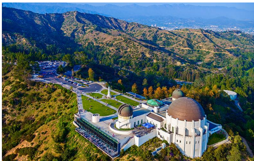
Slika 10. Park i Zvjezdarnica Griffith

astronomiji, što je priča ispričana u kontekstu četiri direktora zgrade ( Griffith Observatroy , 2024). Griffith Observatory , smješten na južnom obronku planine Hollywood u Los Angelesu, poznata je institucija čija je reputacija izgrađena na značajnom doprinosu astronomiji i javnom obrazovanju. Od svojeg otvaranja 1935. godine, zvjezdarnica je služila kao centar za znanstvena istraživanja i javnu edukaciju. Njena prepoznatljiva arhitektura u stilu Art Decoa, dizajnirana od strane Johna C. Austina i Fredericka M. Ashleyja. Unutar zvjezdarnice posjetitelji otkrivaju bogatstvo edukativnih izložbi, interaktivnih prikaza i najsuvremenijih teleskopa. Zvjezdarnica posjeduje Zeiss refraktorski teleskop promjera 12 inča, koji omogućuje jasno promatranje nebeskih objekata, te solarni teleskop za promatranje Sunca.