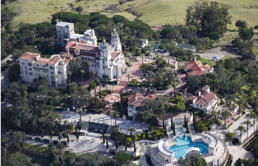
Slika 13. Kompleks dvorca Hearst

unutarnji bazen Neptune Pool , okružen klasičnim grčkim kipovima, te zatvoreni Rimsky bazen s detaljima u zlatnim mozaicima.