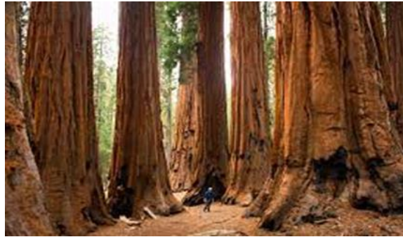
Slika 5. NP Sequoia

parkovima zajedno kao nacionalni parkovi Sequoia i Kings Canyon . UNESCO je odredio područja kao rezervat biosfere Sequoia-Kings Canyon 1976. Tokopah Falls Staza do slapova Tokopah počinje odmah preko Marble Fork Bridgea u kampu Lodgepole . Lagana je jednosmjerna šetnja duž mramornog račva rijeke Cavea do impresivnih granitnih stijena i vodopada kanjona Tokopah .