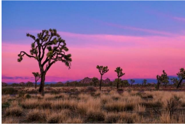
Slika 4. Nacionalni Park Joshua Tree ( Yucca Brevifolia )