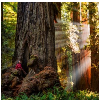
Slika 7. Prikaz Redwood šume