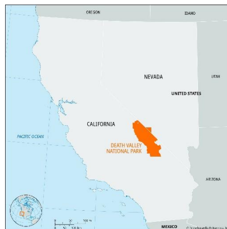
Slika 6. Prikaz lokacije Doline Smrti

Nacionalni park Dolina smrti, koji se nalazi u istočnoj Kaliforniji i Nevadi, poznat je po svojim ekstremnim ekološkim uvjetima, a obuhvaća jedno od najtoplijih i najsuših mjesta na Zemlji. Pokrivajući otprilike 13.650 km 2 , park sadrži razne geološke formacije uključujući prostrane slane ravnice, dine, pustinje, doline, kanjone i planinske lance (NPS, 2023). Najniža točka u Sjevernoj Americi, Badwater Basin , nalazi se ovdje na 86 metara ispod razine mora (Rothman H., Miller C., 2013). Flora parka uključuje otporne vrste prilagođene sušnim uvjetima, kao što su grm kreozota ( Larrea tridentata ), mesquite ( Prosopis spp. ) i razni kaktusi. Unatoč surovom okolišu, Dolina smrti podržava iznenađujuće raznolik niz faune, uključujući endemske vrste kao što je štene iz Doline smrti ( Cyprinodon salinus ), koje nastanjuje izolirane izvore i močvare. Na višim nadmorskim visinama parka obitava pustinja ovca tolstorog ( Ovis canadensis nelsoni ) i niz vrsta ptica. Dolina Smrti je poznata po tome da je najsuše i najtoplije mjesto u Sjevernoj Americi, te ima najnižu nadmorsku visinu na kontinentu od oko 86 metara ispod razine mora. Dubina i oblik Doline smrti utječu na njene ljetne temperature (Bryan T. Scott, Tucker B., 2009).