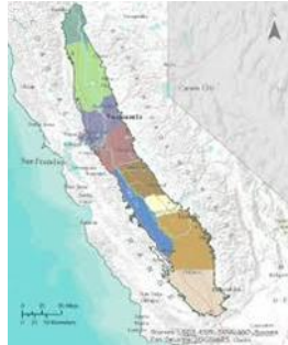
Slika 2. Central Valley

U Kaliforniji se također nalazi dolina koja se proteže na površini od gotovo 47.000 km 2 . Central Valley (Slika 2.) ili Središnja dolina jest jedna izdužena i široka plosnata dolina koja se prostire kroz unutrašnjost Kalifornije, zauzima gotovo trećinu Kalifornije.