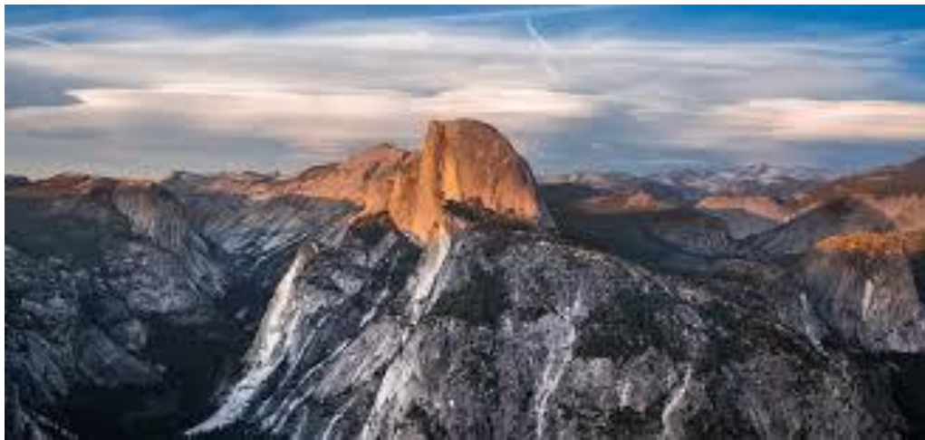
Slika 3. Nacionalni park Yosemite