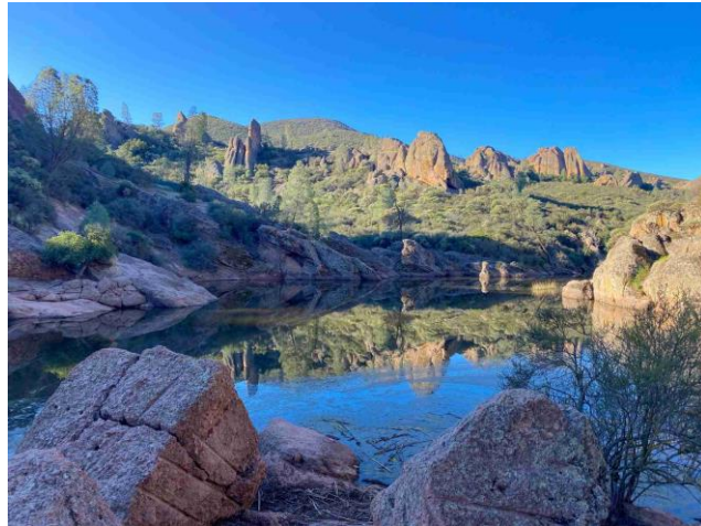
Slika 8. Nacionalni park Pinnacles

ulogu u očuvanju. Upravljanje parkom usmjereno je na očuvanje jedinstvenih ekosustava i zaštitu ugroženih vrsta. Posebno su vrijedni pažnje napori u praćenju i podršci populacije kalifornijskih kondora. Kondori su opremljeni radio odašiljačima za praćenje njihovog kretanja i osiguravanje njihove sigurnosti. U tijeku su projekti obnove staništa kako bi se održao prirodni krajolik i promicala biološka raznolikost. Posjetiteljima su dostupni edukativni programi i vođeni obilasci koji naglašavaju važnost očuvanja i prirodne povijesti parka. Ovi programi imaju za cilj poticanje dubljeg razumijevanja i uvažavanja jedinstvenog okoliša parka.