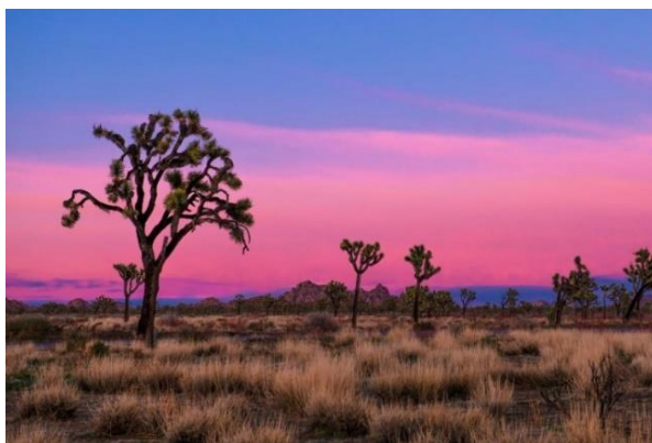
Slika 4. Nacionalni Park Joshua Tree ( Yucca Brevifolia )