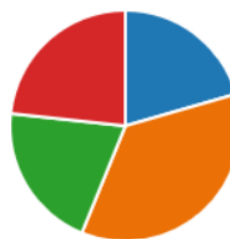
Slika 8.

Podaci pokazuju da samo manji postotak ispitanika koristi mediteranske sastojke svakodnevno, dok većina koristi ove sastojke nekoliko puta tjedno ili rjeđe.