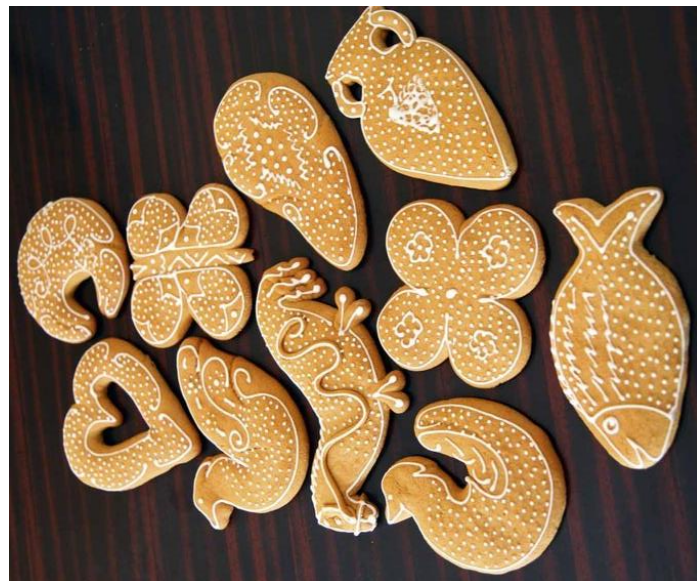
Slika 3. Paprenjaci iz Starog Grada, https://www.iceipice.hr/hr/clanak/paprenjaci-iz-staroga-grad (2. srpnja 2024.)

Izrađuju se za posebne prigode kao što su krštenja, vjenčanja, pričesti, krizme, Božić i drugi blagdani. Na vjenčanjima je običaj da rodbina, prijatelji i susjedi donose na dar paprenjoke, a domaćini im uzvraćaju darovima nakon vjenčanja. Simbol su kulturnog identiteta Staroga Grada, a turistička zajednica radi na očuvanju tradicije organiziranjem natjecanja u izradi ove slastice, pod nazivom „Zlatni paprenjok“. Kako bi se očuvala tradicija izrade, organiziraju se i radionice i festivali gdje starogradski majstori slastičari prenose svoje znanje mlađim naraštajima. 24