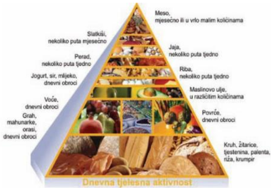
Slika 1. Piramida namjernica mediteranske prehrane https://hrcak.srce.hr/file/34850 (30. lipnja 2024.)

Temeljna načela mediteranske prehrane očituju se u organizaciji odabranih namjernica, koje se mogu smjestiti unutar piramide mediteranske prehrane. Ova piramida je konstruirana na temelju stvarnih prehrambenih navika ljudi koji žive na mediteranskom području. Grafički prikazuje tradicionalni način prehrane karakterističan za stanovnike Krete i južne Italije u 1960 – ima.