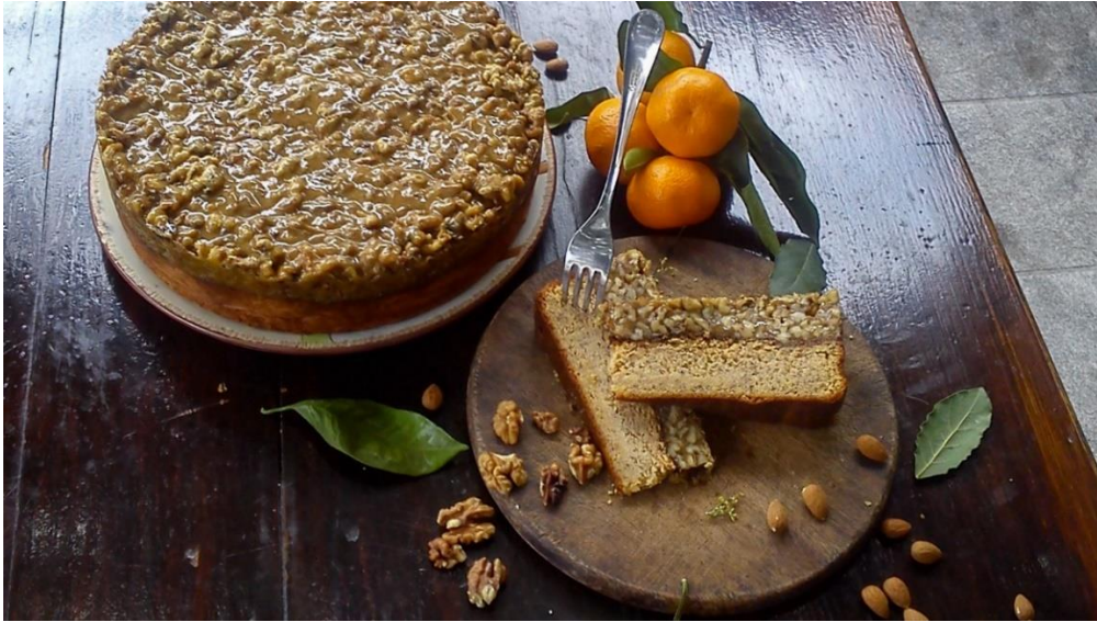
Slika 4. Torta hrapočuša