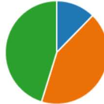
Slika 19. Izvor: autorica diplomskog rada

Veći broj ispitanika nije sudjelovao u kulinarskim događanjima, ali bi to volio/la.