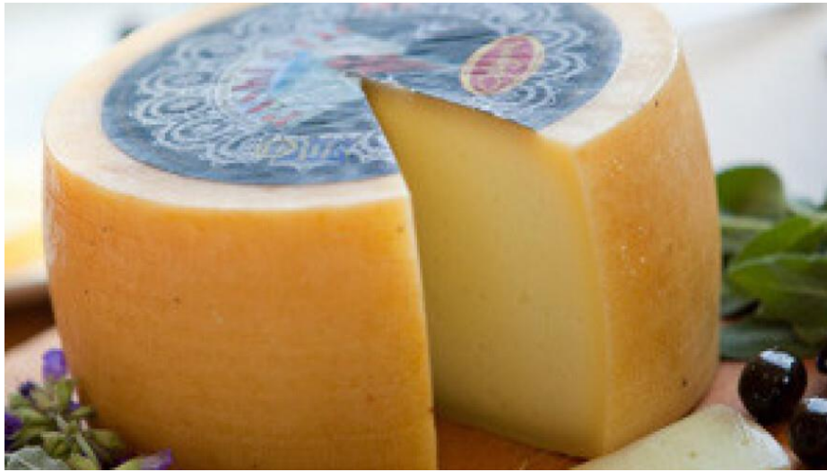
Slika 1. Paški sir

proizvodom koji je prepoznatljiv i cijenjen širom svijeta. Njegova proizvodnja nije samo industrija, već i očuvanje kulturne baštine otoka Paga.