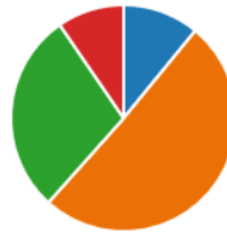
Slika 16.

Rezultati ukazuju na percepciju da zaštita mediteranske prehrane kao nematerijalnog kulturnog dobra nije potpuno adekvatna.