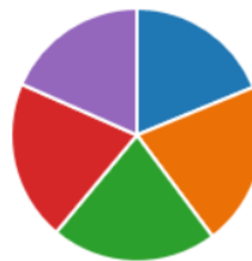
Slika 17.

Sudionici su najviše naglasili organizaciju kulinarskih festivala i promociju tradicionalnih recepata kao ključne za očuvanje mediteranske prehrane.