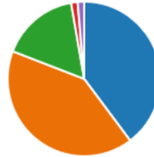
Slika 14.

Većina smatra da je mediteranska prehrana vrlo važna za očuvanje kulturne baštine Hrvatske.