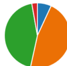
Slika 18.