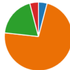
Slika 5.