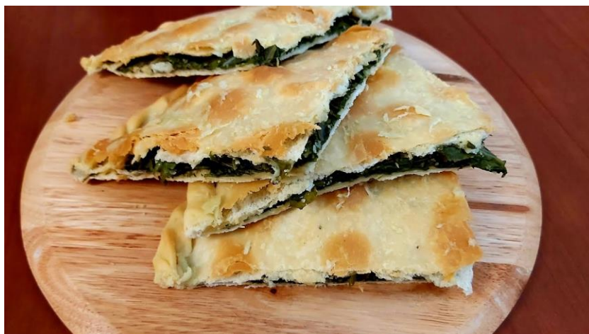
Slika 2. Soparnik, https://gastro.24sata.hr/soparnik-9157 (30. lipnja 2024.)

Soparnik je autentično dalmatinsko jelo koje svojim jednostavnim sastojcima i tradicionalnim načinom pripreme predstavlja dio kulturne baštine Hrvatske. Njegova priprema i okus ostavljaju poseban dojam na svakog tko ga kuša, a očuvanje ove tradicije pridonosi bogatstvu hrvatske gastronomije.