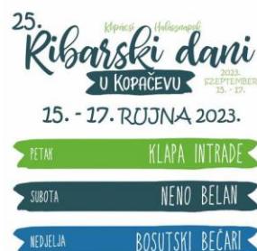
Slika 23. Ribarski dani u Kopačevu

Manifestacija Ribarski dani u Kopačevu traje po dva dana (vikend). Manifestacija se održava svake godine u rujnu (Turistička zajednica Općine Bilje, 2024). Kopačevo ovom manifestacijom promovira tradiciju i seoski turizam.