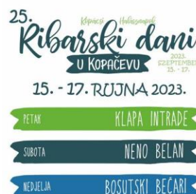
Slika 23. Ribarski dani u Kopačevu

Manifestacija Ribarski dani u Kopačevu traje po dva dana (vikend). Manifestacija se održava svake godine u rujnu (Turistička zajednica Općine Bilje, 2024). Kopačevo ovom manifestacijom promovira tradiciju i seoski turizam.