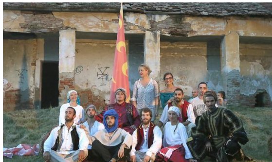
Slika 25. Tarda Fest – Povijesni festival kulture i običaja iz otomanskog razdoblja

Poznata je činjenica da je čuveni Sulejmanov most bio negdje na prostoru Osijeka i Baranje. Most išao je upravo do Darde tj. današnjeg perivoja Dvorca Esterhazy (Općina Darda, 2024). Na prostorima Dvorca Esterhazy održava se ova manifestacija.