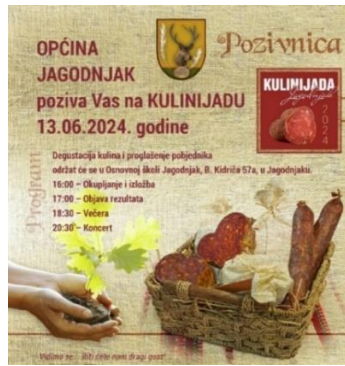
Slika 22. Kulenijada

Uz Festival kulena , ističe se Kulenijada . Za razliku od Festival kulena , koji je novija manifestacija, Kulenijada (nazivana i Kulinijada ) u Jagodnjaku organizira se već dugi niz godina (Agroklub, 2024). Dana 13. lipnja 2024. održana je 23. Kulenijada .