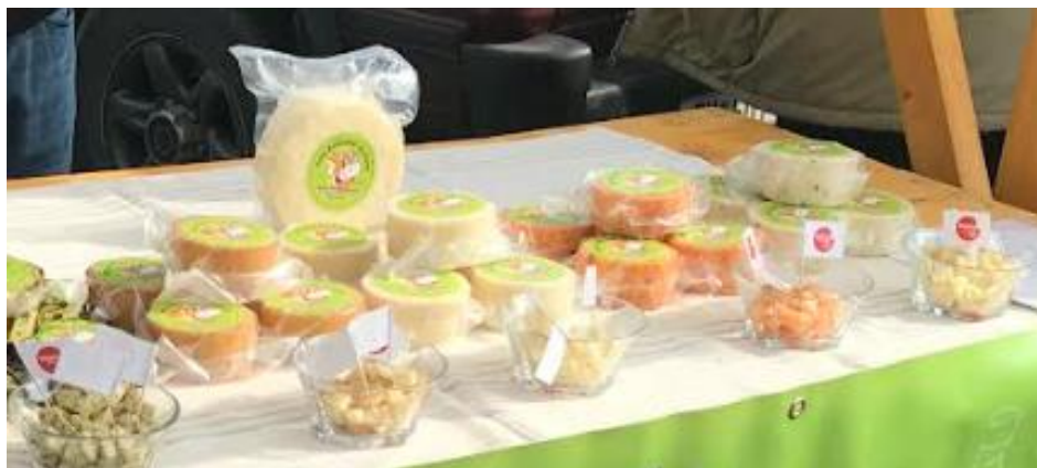
Slika 31. Domaći mliječni proizvodi