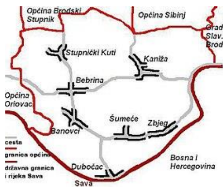
Slika 2. Karta općine Bebrine