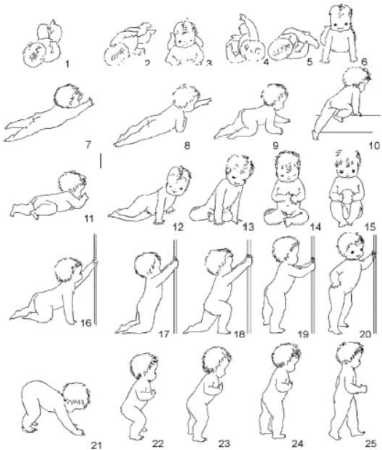
Slika 5. Razvojne faze grube motorike