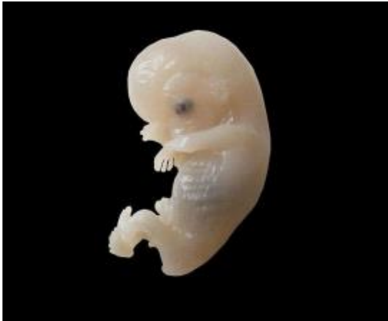
Slika 2. Ljudski embrij