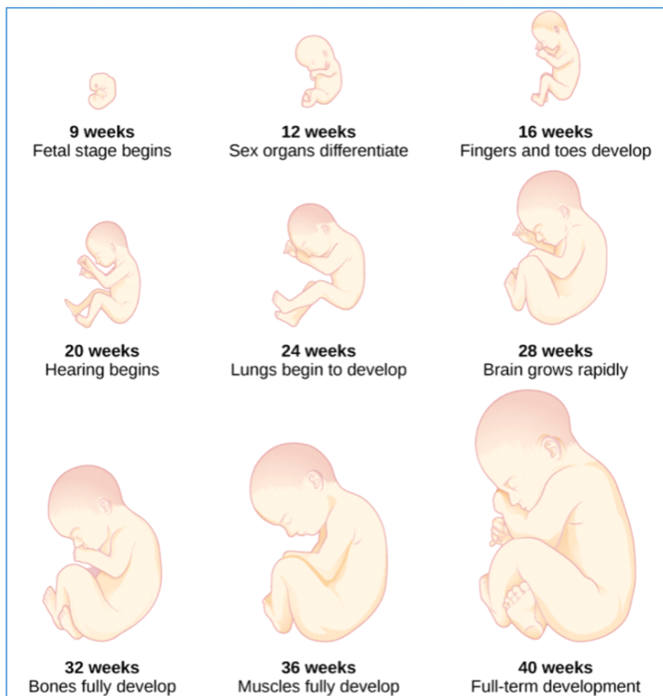
Slika 1. Razvoj ploda po tjednima

organa. Plod prolazi kroz stadije rane diobe stanica, implantacije u maternici i početnog razvoja organa. Neuralna cijev, iz koje će se razviti mozak i leđna moždina, formira se oko trećega tjedna, dok srce počinje kucati oko šestoga tjedna. Do kraja prvoga tromjesečja većina glavnih organa je formirana, a embrij prelazi u stadij fetusa. Drugo tromjesečje, od 13. do 26. tjedna, obilježeno je daljnjim razvojem i sazrijevanjem organa. Fetus počinje poprimiti ljudski oblik; ruke, noge, prsti i nožni prsti postaju jasno definirani. Kostiju počinju očvršćivati, a fetus počinje izvoditi pokrete koje majka može osjetiti. Osjetila se također razvijaju – oči reagiraju na svjetlost, a uši na zvukove. Koža postaje manje prozirna, a fetus počinje nakupljati masno tkivo (Molfese i sur., 2013).