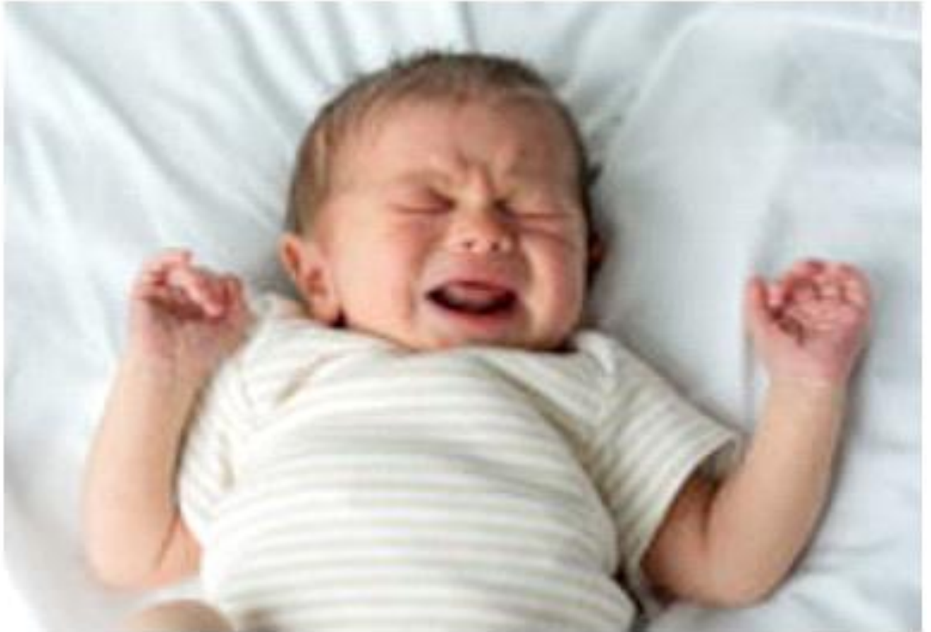
Slika 4. Samo nekoliko dana stara, ovaj beba već zna kako komunicirati svoje potrebe svojim skrbnicima plakanjem.

bebama, članovima obitelji i širemu okruženju. Djeca uče o socijalnim normama, oponašajući ponašanje odraslih i učeći kroz igru. Kroz te interakcije oni razvijaju svoje vještine komunikacije i uče kako surađivati s drugima (Humphreys i sur. 2015).