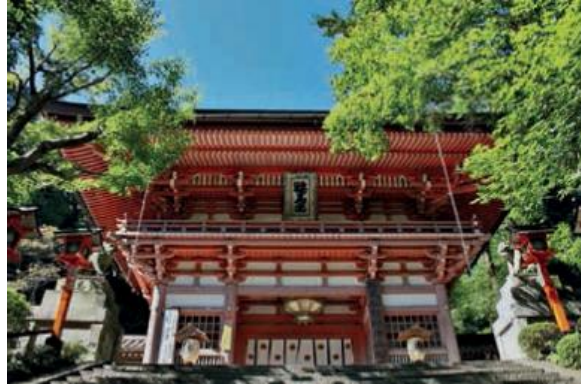
Slika 8 prikaz hrama Kurama u kojem su tengu navodno boravili

razloga da ne poznajemo sažaljenje. Zato pomozimo Ushiwaki, naučimo ga metodi tengua tako da može napasti očevog neprijatelja“.