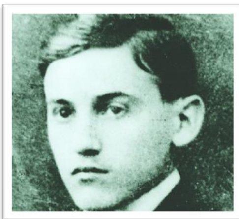
Sl. 2: Mladi Alojzije Stepinac

Nakon što je u mjesnoj osnovnoj školi završio četiri razreda, 1909. poslan je u klasičnu gimnaziju u Zagrebu, kao učenik koji plaća školovanje.