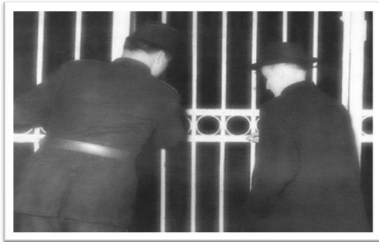
Sl. 8: Stepinčevo uhićenje 1946.

Dana 19. listopada 1946. Stepinac je prebačen u Lepoglavu, nekadašnji pavlinski samostan koji je prenamijenjen u zatvor. Tu je proveo pet godina, u posebnom krilu za zatvorenike potpuno odijeljene od ostalih. Svakodnevno je služio mise u susjednoj ćeliji koja je pretvorena u kapelicu.