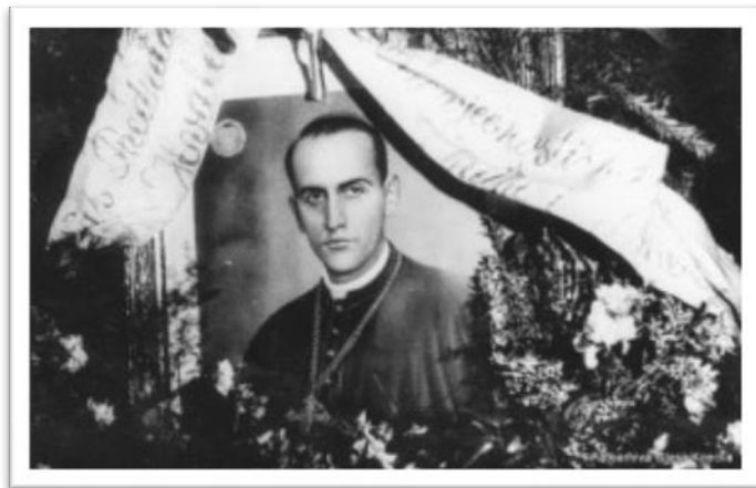
Sl. 10: Detalj sa Stepinčeva pokopa

Smrt je dočekaao miran, pri punoj svijesti, moleći za svoje progonitelje i opraštajući svima koji su mu nanijeli zlo. Umro je u Krašiću 10. veljače 1960. Unatoč početnom protivljenju vlasti, njegovi posmrtni ostaci na kraju su pohranjeni u zagrebačkoj katedrali.