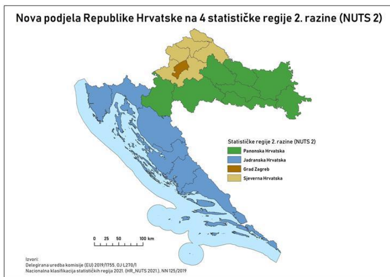
Slika 1. Nova podjela Republike Hrvatske na 4 statističke regije 2. razine (NUTS 2), Nova statistička podjela Hrvatske na NUTS2 regije - Aurora (istra-europa.eu) (pristupljeno 16.8.2023.)

gospodarske raznolikosti, ulaganje u infrastrukturu, poticanje inovacija te podržavanje lokalnih poduzetnika. Na taj način se može stvoriti ravnoteža između regija i pružiti svima prilika za napredak. Regionalna podjela Hrvatske duboko utječe na njezinu identitet, ekonomiju i društveni razvoj. Različite regije imaju svoje jedinstvene karakteristike, kulturne običaje i ekonomske izazove. Ključno je usmjeriti napore prema postizanju ravnoteže u razvoju regija, smanjenju ekonomske i socijalne nejednakosti te promicanju očuvanja bogate kulturne baštine svakog dijela Hrvatske. Samo kroz cjelovitu pažnju prema svim regijama zemlje može se osigurati održiv i uravnotežen razvoj Hrvatske kao cjeline.