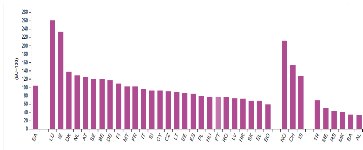
Slika 5. Obujam indeksa BDP-a po stanovniku 2022., EU 27=100