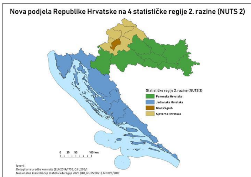
Slika 1. Nova podjela Republike Hrvatske na 4 statističke regije 2. razine (NUTS 2), Nova statistička podjela Hrvatske na NUTS2 regije - Aurora (istra-europa.eu) (pristupljeno 16.8.2023.)

gospodarske raznolikosti, ulaganje u infrastrukturu, poticanje inovacija te podržavanje lokalnih poduzetnika. Na taj način se može stvoriti ravnoteža između regija i pružiti svima prilika za napredak. Regionalna podjela Hrvatske duboko utječe na njezinu identitet, ekonomiju i društveni razvoj. Različite regije imaju svoje jedinstvene karakteristike, kulturne običaje i ekonomske izazove. Ključno je usmjeriti napore prema postizanju ravnoteže u razvoju regija, smanjenju ekonomske i socijalne nejednakosti te promicanju očuvanja bogate kulturne baštine svakog dijela Hrvatske. Samo kroz cjelovitu pažnju prema svim regijama zemlje može se osigurati održiv i uravnotežen razvoj Hrvatske kao cjeline.