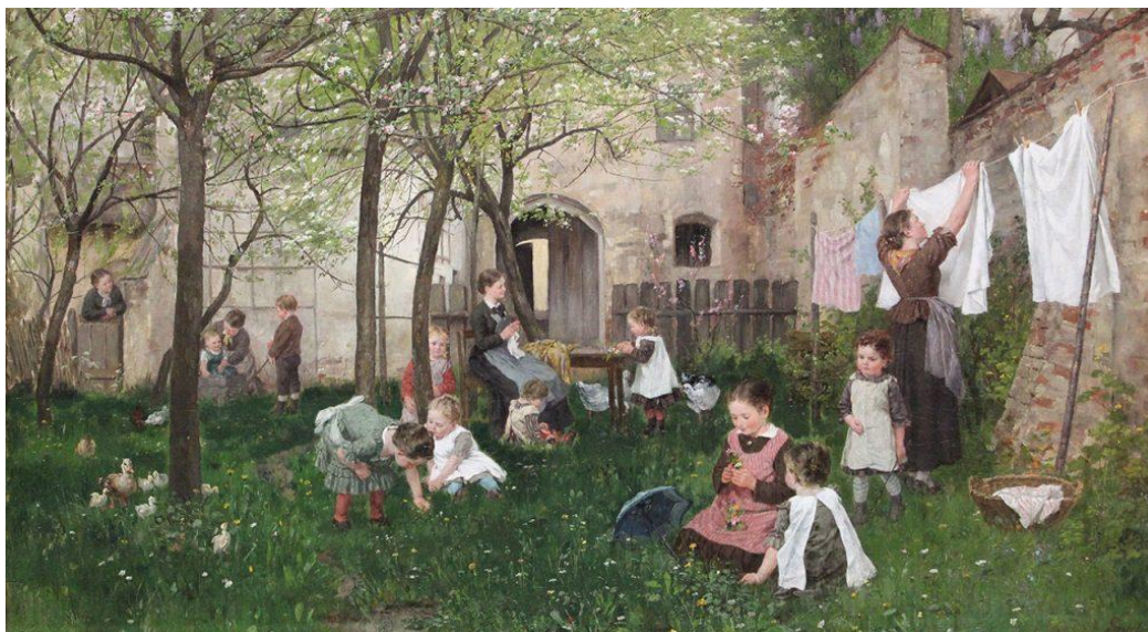
Slika 2. Froebelov vrtić.