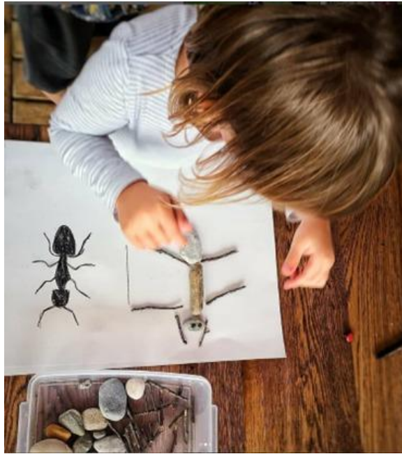
Slika 11. Razvoj kreativnih vještina

Kombinacija metoda omogućuje djeci da razviju kritičko mišljenje, samopouzdanje i empatiju, dok istovremeno potiče njihov fizički razvoj kroz aktivnosti koje uključuju kretanje i igru. Emocionalni razvoj podržava se kroz sigurno i poticajno okruženje u kojem djeca mogu slobodno izražavati svoje osjećaje i razvijati emocionalnu inteligenciju. Socijalni razvoj se promiče kroz grupne aktivnosti i suradničko učenje, gdje djeca uče vještine timskog rada, komunikacije i rješavanja sukoba. Intelektualni razvoj se stimulira kroz izazovne i zanimljive aktivnosti koje potiču istraživanje, inovaciju i kreativno razmišljanje (Slika 12.).