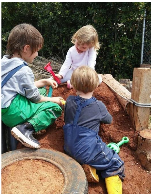
Slika 12. Razvoj vještina.

Velika pažnja se posvećuje razvoju radnih navika putem jednostavnih, ali korisnih aktivnosti koje se provode u prirodi. To uključuje vrtlarenje, paljenje logorske vatre, izradu igračaka, pripremu hrane, kompostiranje te sakupljanje bilja i plodova iz šume i vrta (Slika 13.). Kroz ove aktivnosti, djeca uče važnost samostalnosti i brige o svom okruženju, dok vještine koje stječu imaju univerzalnu primjenu te su korisne za njihov svakodnevni život.