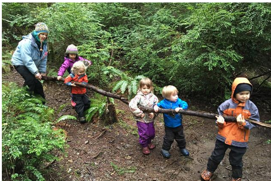
Slika 3. Aktivnosti u šumi.

sunce, sjene, kiše i vjetar te istraživati crve, puževe i insekte u blizini. Froebel je tvrdio da kroz vrtlarjenje djeca mogu početi vidjeti povezanost između rasta biljaka i životinja te vlastitih života, poput zajedničke potrebe za hranom, vodom, skloništem i brigom. To, je vjerovao, produbljuje dječje početno razumijevanje samih sebe i međusobne povezanosti svih živih bića. Froebel je naglašavao da bi djeca trebala doživjeti sve aspekte prirode, ne samo biljke i životinje. To uključuje i univerzalne zakone prirode poput sila, nagiba, gravitacije, kretanja, energije, svjetlosti, zvuka, svojstava materijala i njihovih transformacija. Jedan od najboljih načina na koji djeca mogu doživjeti prirodu, je kroz igru na otvorenom u vrtu i u širem prirodnom okruženju (Slika 3.). Danas se Froebelove ideje o međusobnoj povezanosti odražavaju u suvremenim shvaćanjima ekologije i brige za održivost. S obzirom na sve veće udaljavanje djece od prirodnog svijeta, njegove ideje postaju iznimno važne. Stoga je iskustvo prirode bitno za praksu koja se temelji na Froebelovim principima. Ipak, to iskustvo mora biti sveobuhvatno i povezano. Na primjer, djeca bi trebala sudjelovati u svim fazama životnog ciklusa biljaka, od sadnje sjemena, preko rasta i berbe, do kompostiranja. To može uključivati sitnjenje zemlje, pisanje oznaka, rješavanje problema poput podrške stabljike biljke, izradu strašila te početak shvaćanja važnosti crva i pčela.