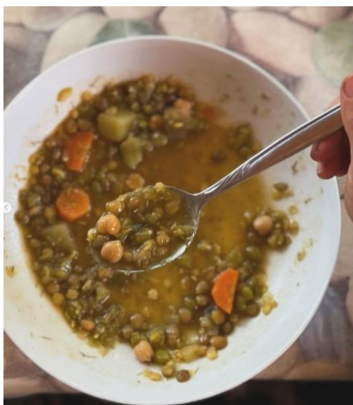
Slika 10. Primjer obroka.

Kroz aktivnosti poput uzgoja salate, djeca uče o važnosti zdrave prehrane te razvijaju svijest o održivom načinu života. Tako se dodatno naglašava povezanost s prirodom i predanost promicanju zdravih životnih navika među djecom. Ističe se i važnost lokalno uzgojene hrane i samo održivosti, čime se podržava ekološka osviještenost i očuvanje okoliša.