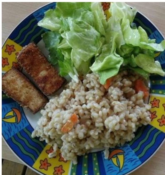
Slika 9. Primjer obroka.

Kroz aktivnosti poput uzgoja salate, djeca uče o važnosti zdrave prehrane te razvijaju svijest o održivom načinu života. Tako se dodatno naglašava povezanost s prirodom i predanost promicanju zdravih životnih navika među djecom. Ističe se i važnost lokalno uzgojene hrane i samo održivosti, čime se podržava ekološka osviještenost i očuvanje okoliša.