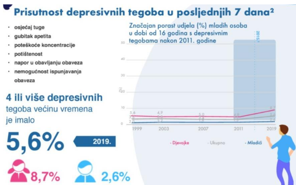
Slika 5. Prisutnost depresivnih tegoba kod mladih.

Prikazom infografike "Mentalno zdravlje mladih u Hrvatskoj" uoči Svjetskog dana mentalnog zdravlja (Slika 5.), Hrvatski zavod za javno zdravstvo želi potaknuti dublju refleksiju i aktivno djelovanje kako bismo zajednički unaprijedili zaštitu i očuvanje mentalnog zdravlja mladih u našoj zemlji. Ovo je posebno značajno s obzirom na izazove s kojima se mladi suočavaju, a koji su dodatno pojačani pandemijom COVID-19.