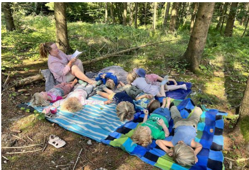
Slika 1. Šumski vrtić u Danskoj. (izvor: https://courier.unesco.org/en/articles/learning-among-trees-denmark , pogledano: 8.6.2024.).

Šumski vrtići, modelirani prema svojim skandinavskim uzorima, slijede slične principe i ideologije nordijskih zemalja. U šumskom vrtiću " potiče se razvoj djeteta u odgovornu i zajednicu sposobnu osobnost " (Haefner, 2002). Važne lekcije poput socijalnih vještina, ekološkog obrazovanja i tjelesnog odgoja ističu se unutar koncepta šumskih vrtića. Socijalne vještine poput komunikacije i suradnje uče se kroz ovisnost o svojim vršnjacima i rješavanje problema u okolišu, a " okoliš se odnosi na širi red uključujući fizičke, društvene i umjetne okoline " (Atasoy, 2015). U nastavku je prikazan šumski vrtić u Danskoj (Slika 1.) na kojoj odgajateljica čita priču, dok djeca gledaju okoliš.