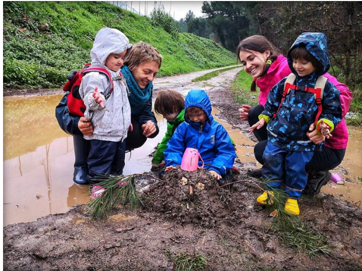
Slika 8. Igra u blatu.