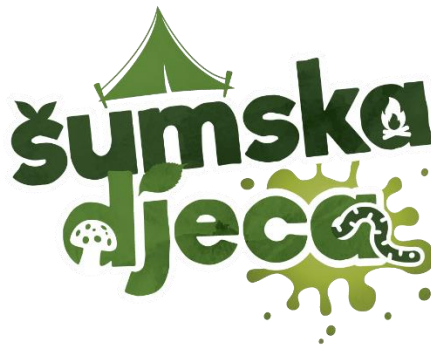
Slika 7. Logo vrtića.

Cilj vrtića je pružati djeci temeljna stjecanje saznanja o sebi i svijetu oko sebe kroz interakciju s prirodom. Programi vrtića namijenjeni su ne samo obiteljima koje već imaju naviku boravka u prirodi, već i onima koji nemaju takvu mogućnost, poput stanovnika urbanih sredina. Također, vrtić nastoji uključiti cijelu obitelj u svoje aktivnosti, potičući zajedništvo i suradnju između roditelja i djece. Vizija vrtića je postati uzor drugim ustanovama u regiji, demonstrirajući kako prirodno okruženje može biti najbolji učitelj. Kroz suradnju s roditeljima i zajednicom, vrtić želi širiti svijest o važnosti prirodnog okruženja za zdrav razvoj djece, te potaknuti što veći broj obitelji na sudjelovanje u programima. Takav koncept je zamišljen s idejom kojom se nastoji ojačati zajedništvo i stvarati zajednice koje cijene i čuvaju okoliš. Na taj način se djeca razvijaju u odrasle, osviještene ljude koji žive u skladu s prirodom, poštuju je i tako čine planet sigurnijim, zdravijim i boljim mjestom za život.