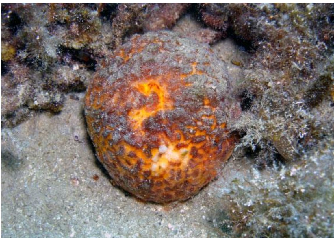
Slika 18. Morska naranča ( Tethya aurantium ) 75

Karakterističnog je okruglog oblika, s vidljivim apikalnim oskulumom, izvana i u prerezu nalikuje na naranču. Narančaste je boje, promjera 6-10 cm, čvrsta je i elastična, živi pojedinačno. Raste na čvrstim dnima, podnosi sedimentaciju. 74