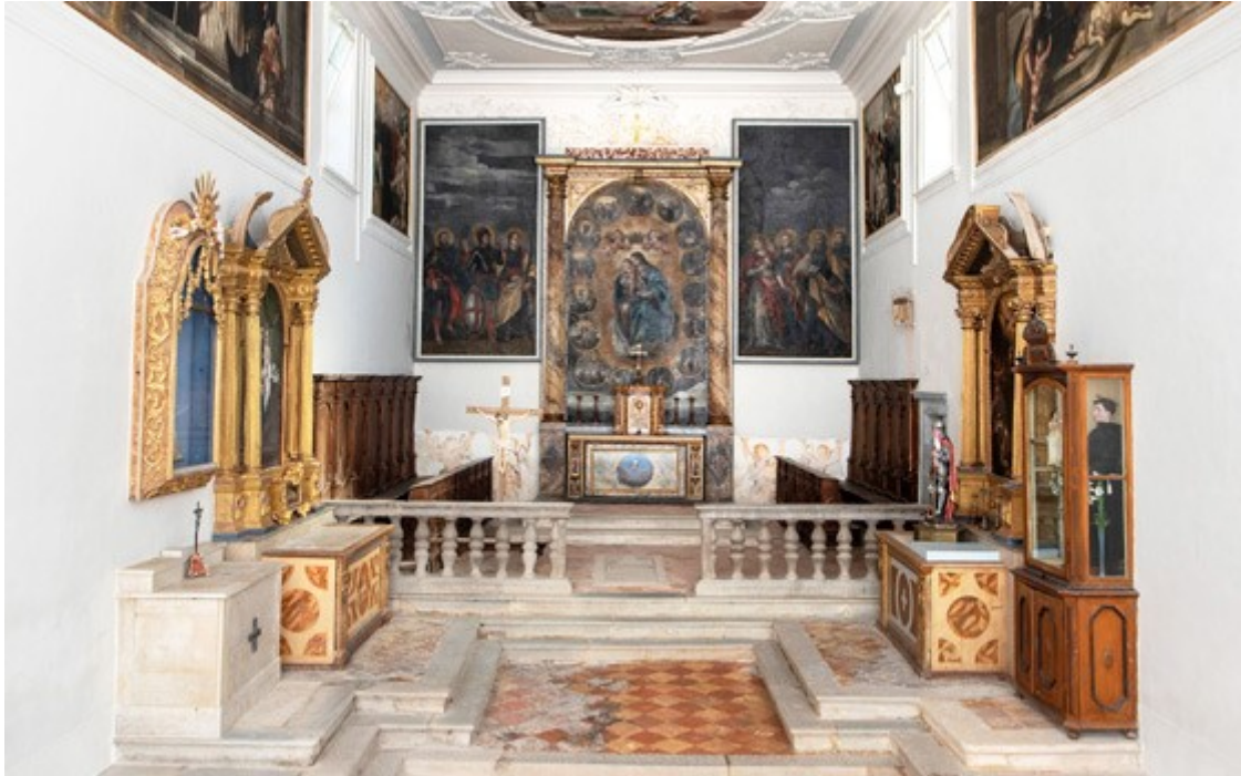
Slika 21. Crkva sv. Jurja u starogradskoj jezgri Buzeta

temelja obnovljena. Krajem XVIII. stoljeća crkva je ponovno preuređena i oslikana medaljonima. 48