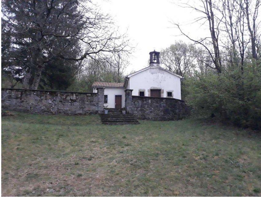
Slika 17. Crkva sv. Nikole u Rašporu