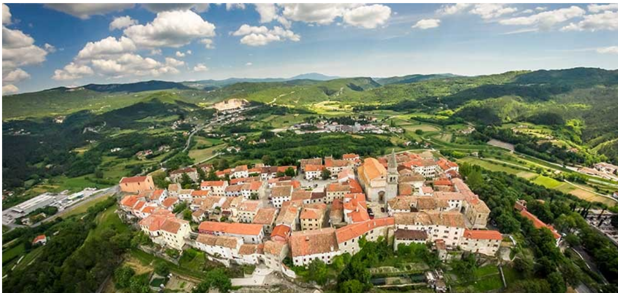
Slika 3. Grad Buzet

manifestacijama, danu grada, brdskim utrckama te kulturno-povijesnoj baštini. U okolici grada nalaze se brojna sela, utvrde, spomenici i crkve koji svjedoče o bogatoj povijesti grada.