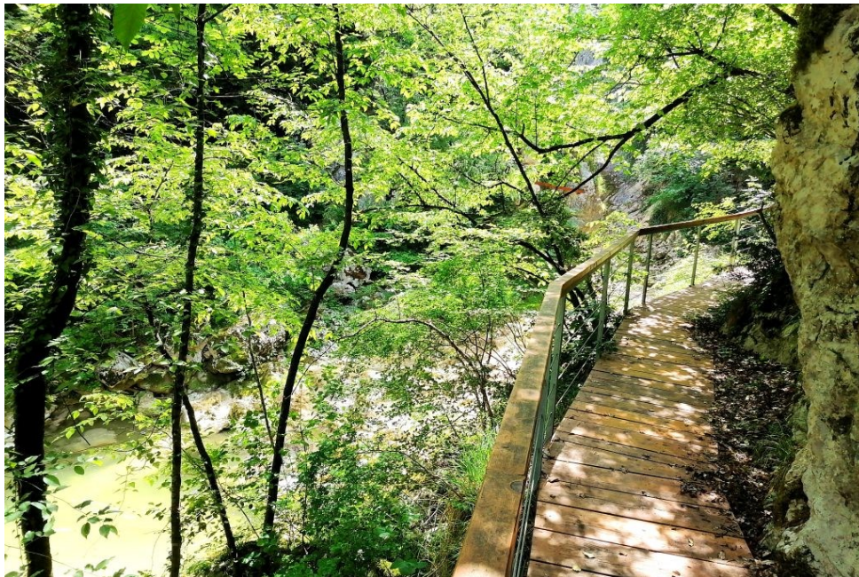
Slika 8. Dio Staze sedam slapova

Staza sedam slapova još je jedna u nizu od prirodne baštine na području Bužeštine. Duga je 15-ak kilometara i potrebno je otprilike 5-6 sati pješaćenja kako bi se prošla cijela staza. Startna pozicija je u Buzetu, pokraj Istarskog vodovoda Buzet te obuhvaća relacije Selca – Glistonija - Kuhari – Kotli - Buzet. Početak staze je pored trim staze s lijeve strane i tu kreće put po stazi simboličnog naziva, s obzirom da se na ovom kružnom putu nalazi sveukupno sedam slapova. Upravo ova staza pruža posebnost kulturne baštine ovoga područja, ali potiče i na kulturni i sportski turizam, privlačeći tako brojne posjetitelje u Buzet upravo iz toga razloga. 30