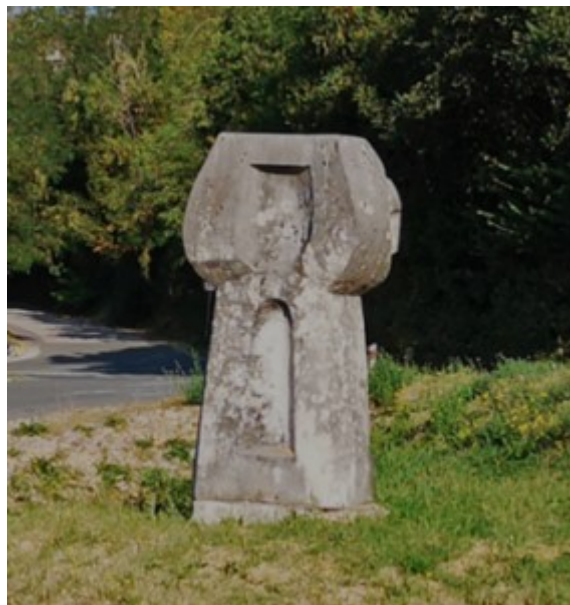
Slika 28. Stup Čakavskog sabora