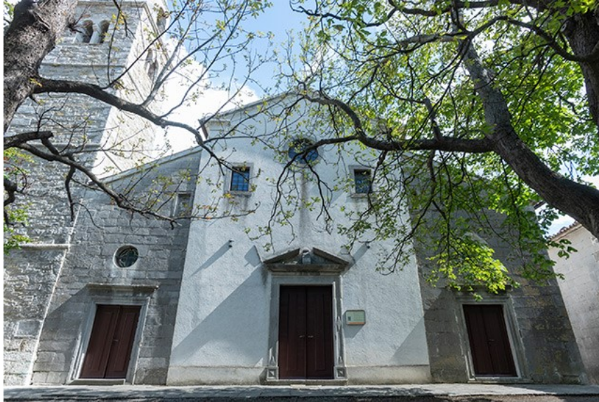
Slika 18. Crkva sv. Bartola u Roču