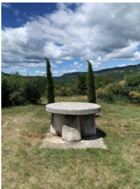
Slika 29. Stol Ćirila i Metoda

Sljedeći spomenik nalazi se u mjestu Forčići i naziv mu je Stol Ćirila i Metoda. Spomenik je u obliku stola i naziv je zapisan latinicom, glagoljicom i ćirilicom, na obodu stola. Simbolično, pored stola posađena su dva čempresa koji simboliziraju braću Ćirila i Metoda, a svečano je otkriven 1978. Stol stoji na tri kamena stupa, tj. na tri kamene noge prema staroj uzrečici „Sve trojno je savršeno.“ Glagoljski tekst ispisan na stolu uklesan je uglatom glagoljicom kakva se koristila i u crkvenim redovima. 70