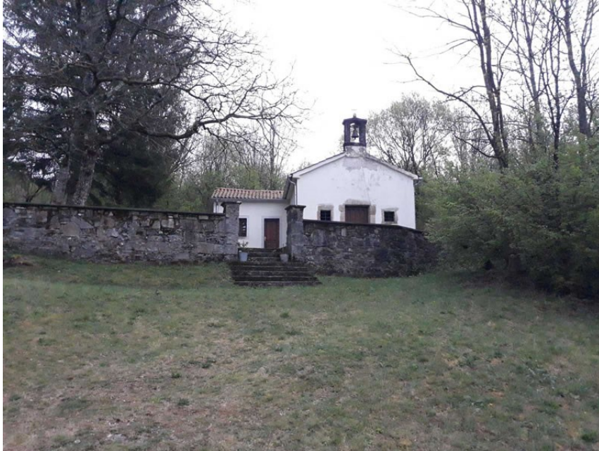
Slika 17. Crkva sv. Nikole u Rašporu