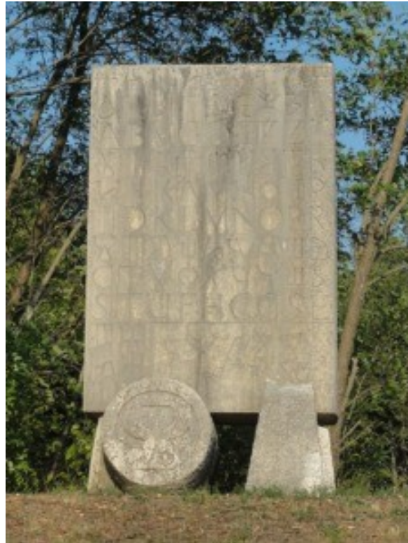
Slika 33. Vidikovac Grgura Ninskog