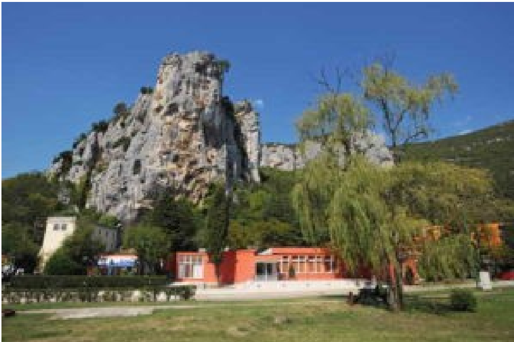
Slika 7. Istarske toplice

Istarske Toplice prirodna su baština sjeverne Istre. Nalaze se pokraj Buzeta u netaknutoj prirodi koja pruža savršen ugođaj za mir i odmor. Iznad Toplica nalazi se stijena ispod koje je izvor Sv. Stjepan, s vodom koja ima optimalno visoki udio sumpora i topla je, puna minerala koji liječe brojne bolesti. Upravo ljekovitost ove vode svrstava Toplice među top 3 u Europi, gledajući kvalitetu. Prva analiza vode datira iz 1858. godine, a rezultati tadašnjih ispitivanja jednaki su današnjima. Nakon Drugog svjetskog rata, Toplice su radile kao odjel za fizikalnu terapiju, a kasnije su bile dijelom turističkog poduzeća Rivijera. Danas su Istarske Toplice u privatnom vlasništvu te pružaju prirodan način liječenja te usluge fizikalne terapije. S obzirom na ljekovita svojstva vode, Toplice su omiljeno odredište mnogih gostiju iz cijele Europe. Upravo zbog svojih ljekovitih svojstava i izvora iznad samih Toplica, one se svrstavaju u prirodu baštinu ovoga područja. 29