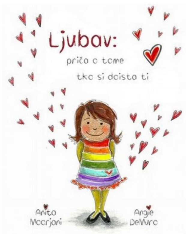
Slika 9 Slikovnica Ljubav: Priča o tome tko si zaista ti