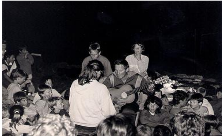
Slika 1. Večernje druženje

Članovi TVD-a Partizan, danas Sportskog društva Narodni dom iz Ljubljane, u Premanturu su došli nakon što su nekoliko godina boravili na pulskim Valovinama. Nakon što je Valovine kupio Savez boraca iz Maribora, u današnjem kampu Tašalera kupili su oko 2000 metara kvadratnih zapuštenog i u makiju zaraslog zemljišta, tik uz more, koje su sami uređivali. S vremenom su tako izgradili kuhinju, sanitarije, ambulantu, plesni podij, stolove za stolni tenis, košarkaški i odbojkaški teren, kafić... 47