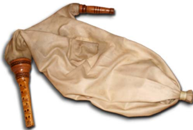
Slika 3. Istarski mih 12

Cilj ovoga primjera je prvenstveno razvijati suradnju škole i obitelji. Osim povezanosti škole i obitelji u ovom primjeru pokušat će se dati i mogućnost povezivanja učenika iz različitih odjela, te povezivanje cjelokupne školske zajednice s lokalnim i nacionalnim poduzetnicima.