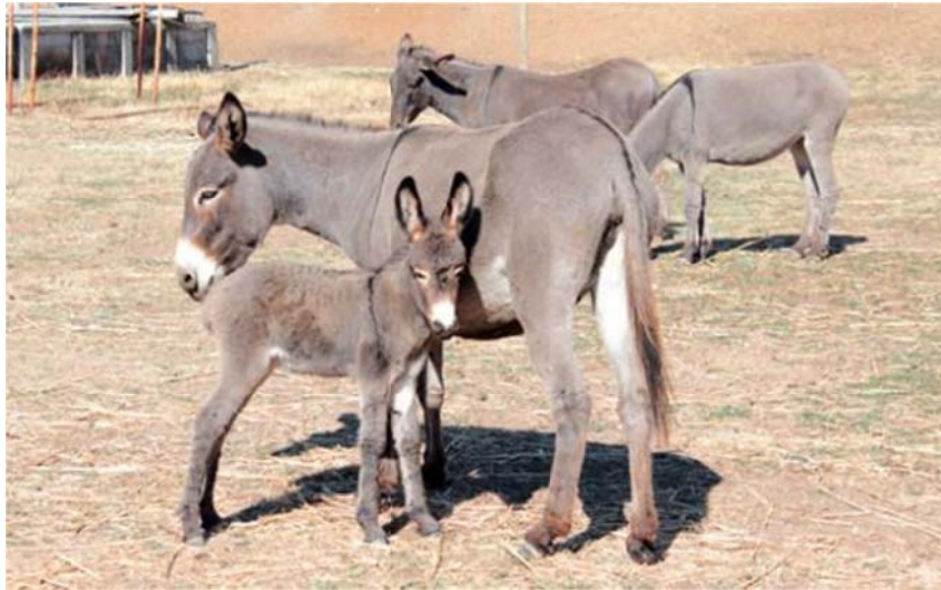
Slika 5. Istarski magarac 15

Kao oslonac za razradu projekta mogao bi poslužiti Nacionalni program očuvanja izvornih i zaštićenih pasmina domaćih životinja u Republici Hrvatskoj 14 .