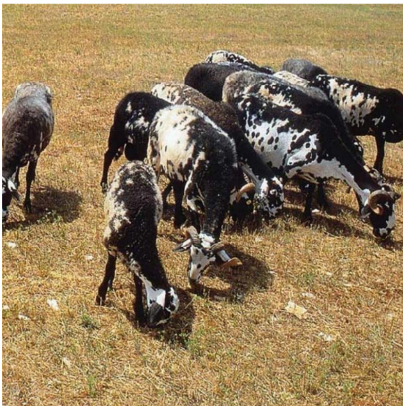
Slika 6. Istarska ovca 17

Glavna tema ili problem je očuvanje i zaštita izvornih pasmina domaćih životinja, a podteme i probleme te načine suradnje roditelja, učenika i škole prikazat će se prema tablici.