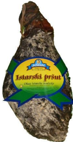
Slika 4. Istarski pršut

dalmatinskog (dalmatinski pršut u procesu proizvodnje prolazi fazu dimljena). Ovako proizveden istarski pršut predstavlja autohtoni hrvatski proizvod i vrhunsku deliciju koja je reprezentant zdravlja i gustatorne radosti (Pršutana Jelenić, Istarski pršut , 2016.).