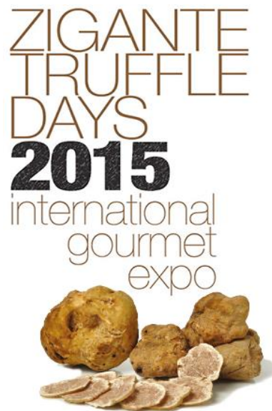
Slika 6. Dani Zigante tartufa

Gostima se prezentiraju i spravljaju tipična jela s tartufima: fuži, pljukanci, njoki, fritaja te razne kombinacije s mesom. Cilj ove manifestacije je doživjeti Istru u malom, a „Dani istarskog tartufa“ (Slika 6.) u Livadama to i pružaju. Za sve posjetitelje ulazak na sajam je besplatan, kao i degustacije svih autohtonih proizvoda i sve to u svrhu promocije istarskog tartufa (Službeni turistički potral Istre, Dani Zigante tartufa, 2016.).