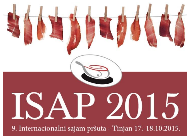
Slika 8. Internacionalni sajam pršuta u Tinjanu

Na ISAP-u svake godine sudjeluje veći broj izlagača iz raznih Europskih zemalja. Na sajmu je 2015. godine sudjelovalo preko 30 proizvođača pršuta iz Hrvatske, Italije, Slovenije, BiH, Španjolske i Austrije. Slijedom navedenog, vidljiv je izniman doprinos ISAP-a afirmaciji i promociji kako Istre tako i čitave Republike Hrvatske kao destinacije vrhunskih suhomesnatih autohtonih delicija na međunarodnoj sceni. Upravo iz svega prethodno navedenog vidljivo je kako organizacija takve manifestacije iziskuje mnogo truda i vremena (ISAP, Poziv na sudjelovanje na ISAP-u , 2016.).