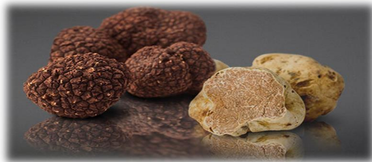
Slika 2. Istarski tartuf

Tartuf. Tartufom se smatra rijetka gljiva, gomoljastog izgleda i intenzivnog mirisa koja raste samo na nekoliko mjesta u Europi kao što su Francuska, Italija i Istra. Stanište tartufa u Istri proteže se od Motovunske šume, sjeveroistokom do grada Buzeta i Lupoglava te jugoistočno uz rijeku Rašu sve do Pazinštine. Rijetka je to i skupocjena gljiva koja se smatra vrhunskom gastronomskom delicijom, iako još uvijek nije utvrđeno radi li se o hrani ili začinu. Tartuf je pod zemljom skriven gomolj koji raste u sivoj glinastoj zemlji u središtu Istre. Može biti bijeli i crni (Slika. 2.), a upravo je istarski bijeli tartuf jedan od najprestižnijih na svijetu.