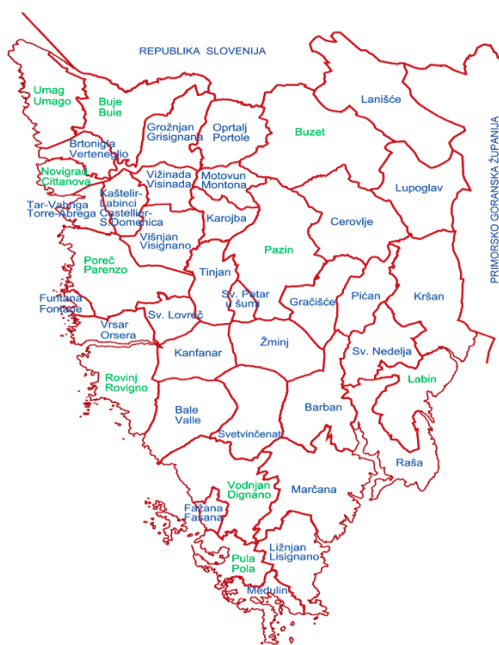
Slika 7. Ceste maslinovog ulja u Istri

Svrha ovakvog projekta je potaknuti sve veću proizvodnju maslinovog ulja, promociju istih te očuvanje krajolika. Uvelike podiže turistički imidž istarske regije, obogaćuje turistički proizvod te se ujedno povećava mogućnost produljenja turističke sezone. Ovim se cestama maslinova ulja u Istri pridonosi angažiranosti čovjeka s ruralnim prostorom uz očuvanje i obnovu izvornog ambijenta tradicijskih nasljeđa u skladu sa održivim razvojem turizma, te se također ujedinjuju prirodne, kulturološke, sociološke, demografske i proizvodne osobine istarskog kraja u skladnu cjelinu. Maslinarima je omogućena veća promocija proizvoda i prodaja maslina i maslinovog ulja. Kao posljednje ovom manifestacijom omogućeno je stvaranje vjernog i stalnog gosta na osnovi tek nekoliko degustacija (Istarska županija, Turizam maslinova ulja - Ceste maslinova ulja Istre , 2016.).