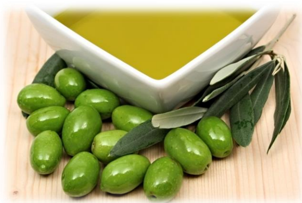
Slika 3. Istarsko maslinovo ulje

Maslinovo ulje. Bogatstvo istarskog poluotoka temelji se na maslinarstvu. Maslinu se osim sa blagim mirisom i gorkastim okusom povezuje i sa simbolom mira (maslinova grančica), simbolom zdravlja i jednim od zaštitnog znaka samog poluotoka. Ulje masline (Slika 3.) još je od davnina poznatije i pod nazivom „tekuće zlato“. Ono je jedan od najkonkurentnijih proizvoda Istre na kojima se uspješno izgradio svjetski prepoznatljiv gastronomski imidž regije. Maslinova se ulja proizvodnjom dijele na različite grupe, a među najzdravijim ali i najskupljim su ekstra djevičanska ulja. Osim gastronomske namjene ovaj se proizvod koristi i kao sredstvo za njegu tijela ili kao lijek protiv mnogih poteškoća. Pogodna klima, geografski smještaj, sastav zemlje, tradicija i veliko iskustvo isprepletено sa modernom tehnologijom omogućilo je višestruku iskoristivost ove namirnice (MyPoreč, Maslinovo ulje , Gastronomija).