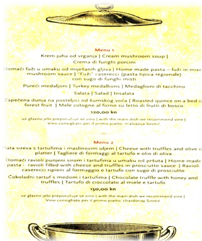
Slika 12. Jelovnik, cijene