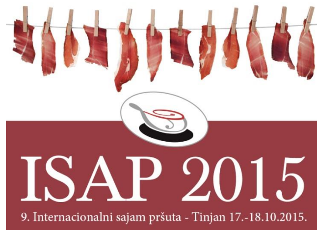
Slika 8. Internacionalni sajam pršuta u Tinjanu

Na ISAP-u svake godine sudjeluje veći broj izlagača iz raznih Europskih zemalja. Na sajmu je 2015. godine sudjelovalo preko 30 proizvođača pršuta iz Hrvatske, Italije, Slovenije, BiH, Španjolske i Austrije. Slijedom navedenog, vidljiv je izniman doprinos ISAP-a afirmaciji i promociji kako Istre tako i čitave Republike Hrvatske kao destinacije vrhunskih suhomesnatih autohtonih delicija na međunarodnoj sceni. Upravo iz svega prethodno navedenog vidljivo je kako organizacija takve manifestacije iziskuje mnogo truda i vremena (ISAP, Poziv na sudjelovanje na ISAP-u , 2016.).