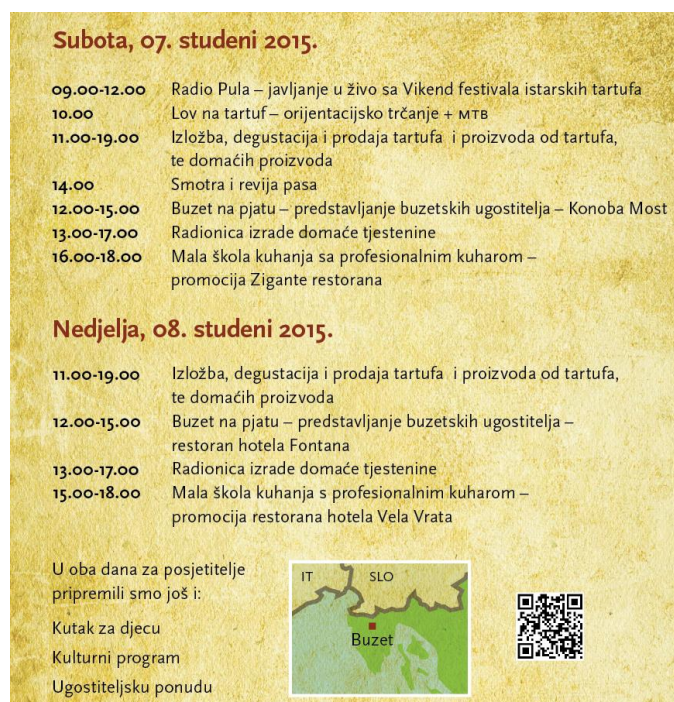
Slika 11. Program događanja manifestacije Dani tartufa u Buzetu

utrku „Lov na tartuf“, radionicu izrade domaće tjestenine, kutak za djecu te kulturno-zabavni program.