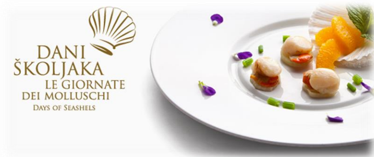
Slika 9. Dani školjaka u Istri

primjercima. U manifestaciji sudjeluje devet restorana i konoba: Astorea iz Brtonigle, Mulino iz Buja, Melon, Rustica i Toni iz Umaga, Pergola i Porto Salvore iz Savudrijete Navigare i San Benedetto iz Novigrada. U ponudi restorana naći će se maštoviti meniji na bazi školjaka (Colours of Istria, Dani školjaka u sjeverozapadnoj Istri , 2016.).