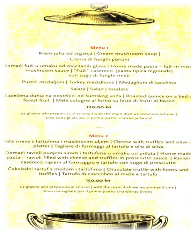
Slika 12. Jelovnik, cijene