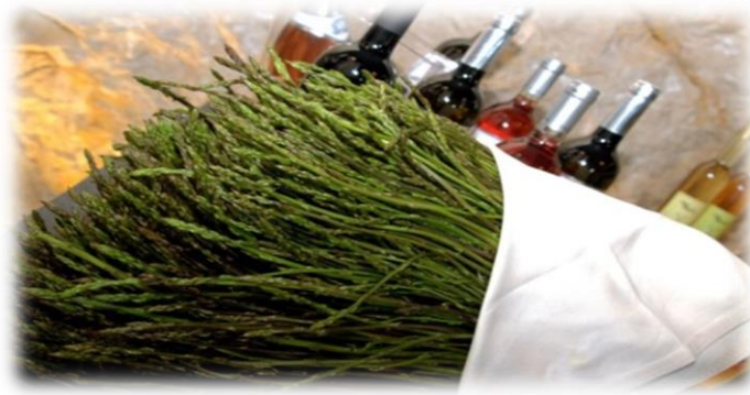
Slika 1. Istarske šparoge