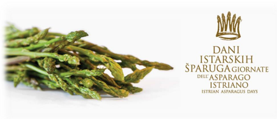
Slika 5. Dani istarskih šparuga

Šparoga je jedna od najcjenjenijih samoniklih kultura koje uspijevaju na području Istre, a bere se od sredine ožujka do konca travnja. Raste na teže dostupnim mjestima, često u zaklonu bodljikavog grmlja (Colours of Istria, Dani istarskih šparoga , 2016.).