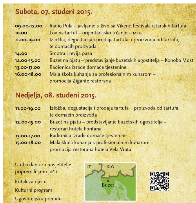
Slika 11. Program događanja manifestacije Dani tartufa u Buzetu

utrku „Lov na tartuf“, radionicu izrade domaće tjestenine, kutak za djecu te kulturno-zabavni program.