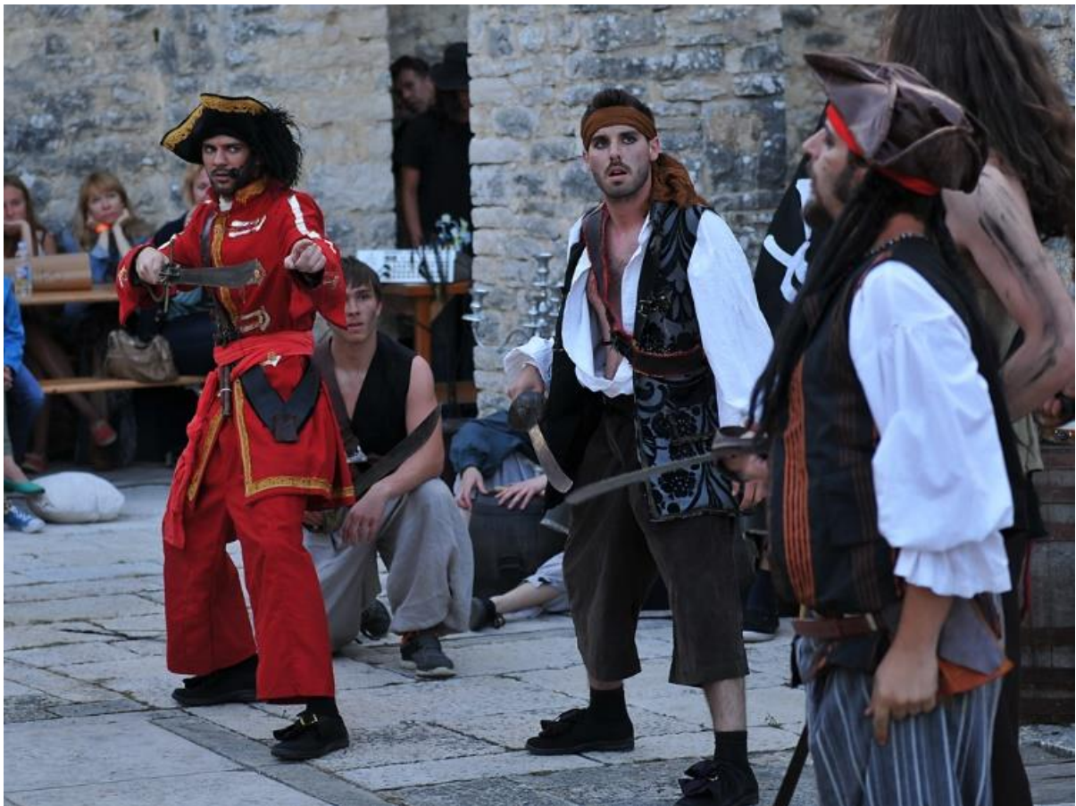
Slika 3: Morganovo blago - Dvigrad