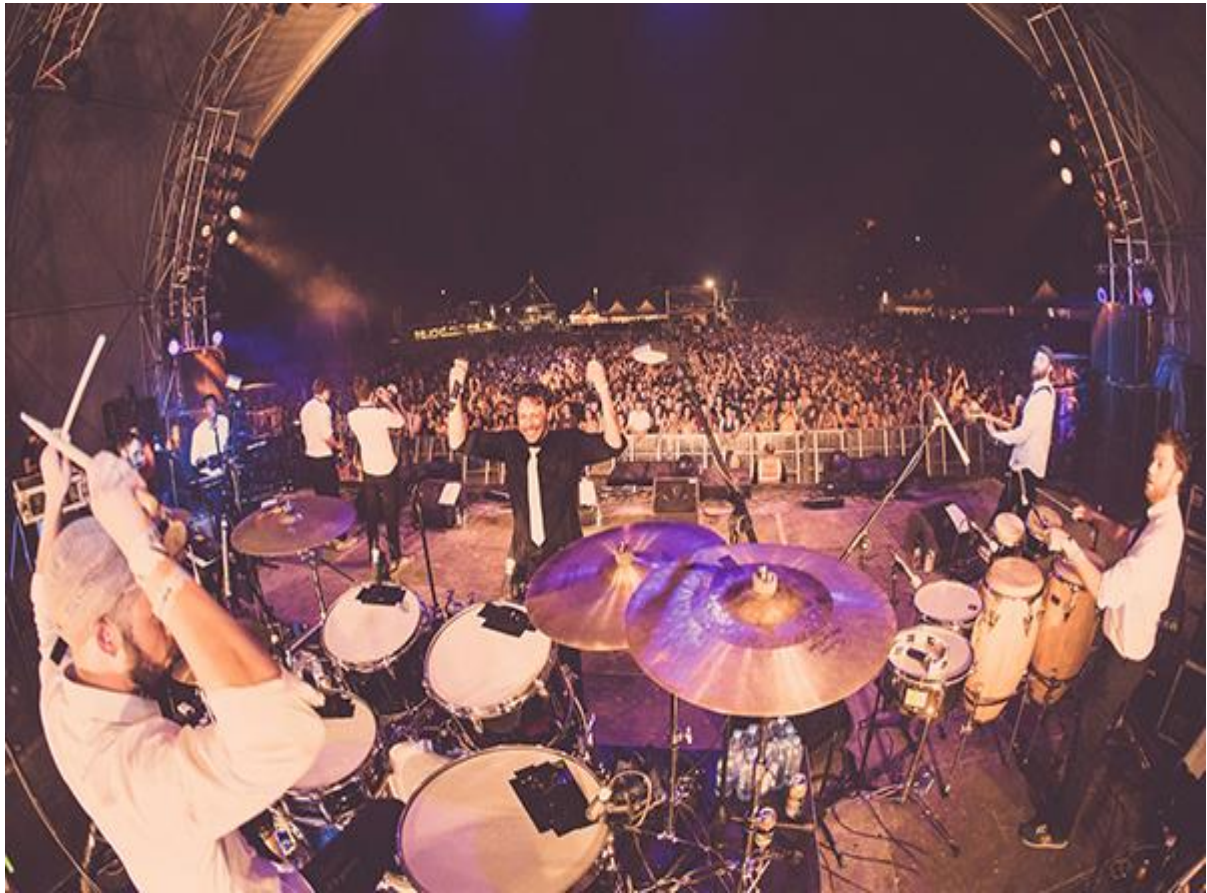
Slika 4: Outlook festival u okolici Pule