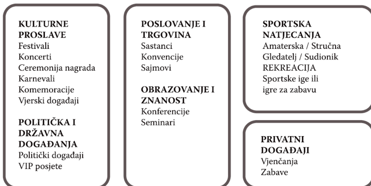
Shema 1: Organizirani događaji po formi

Događaje također možemo klasificirati i prema formi što prikazuje sljedeća shema 1.