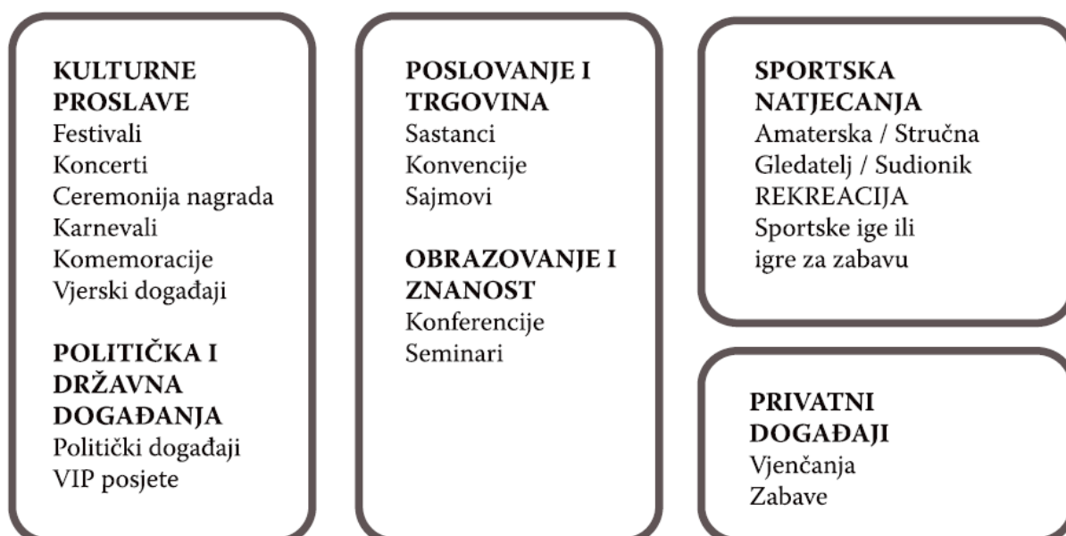
Shema 1: Organizirani događaji po formi

Događaje također možemo klasificirati i prema formi što prikazuje sljedeća shema 1.