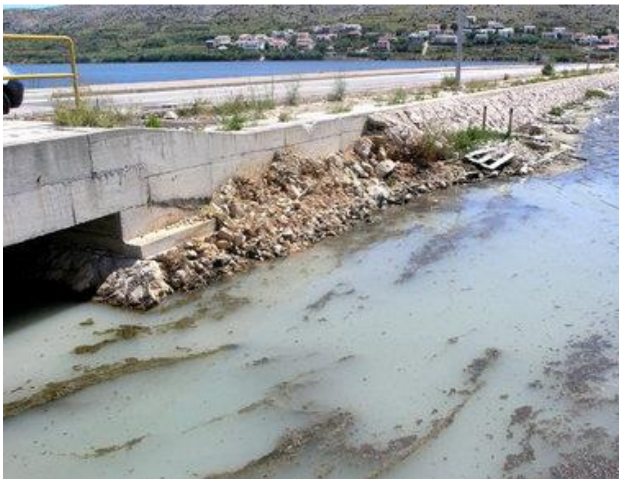
Slika 1: Onečišćenje vode