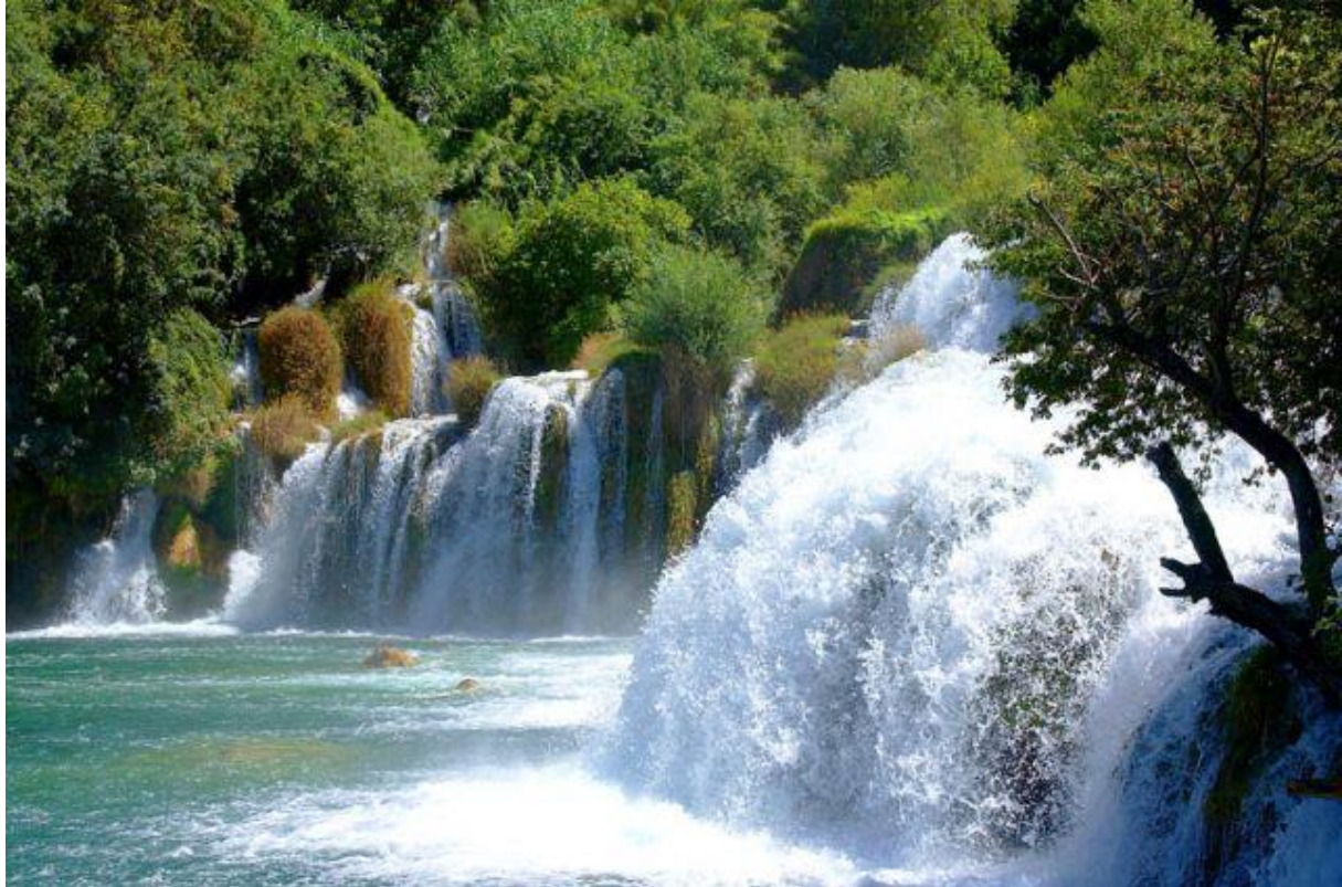
Slika 2: Nacionalni park Krka

prirodne rijetkosti, a jedan od načina je i klasificiranje u više tipova zaštićenih prostora kao što su strogi prirodni rezervati, nacionalni parkovi i parkovi prirode.