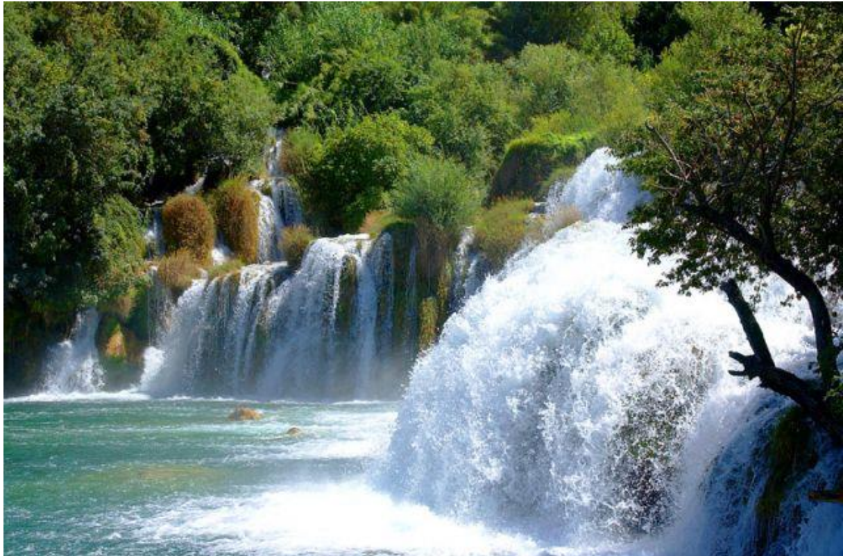
Slika 2: Nacionalni park Krka

prirodne rijetkosti, a jedan od načina je i klasificiranje u više tipova zaštićenih prostora kao što su strogi prirodni rezervati, nacionalni parkovi i parkovi prirode.